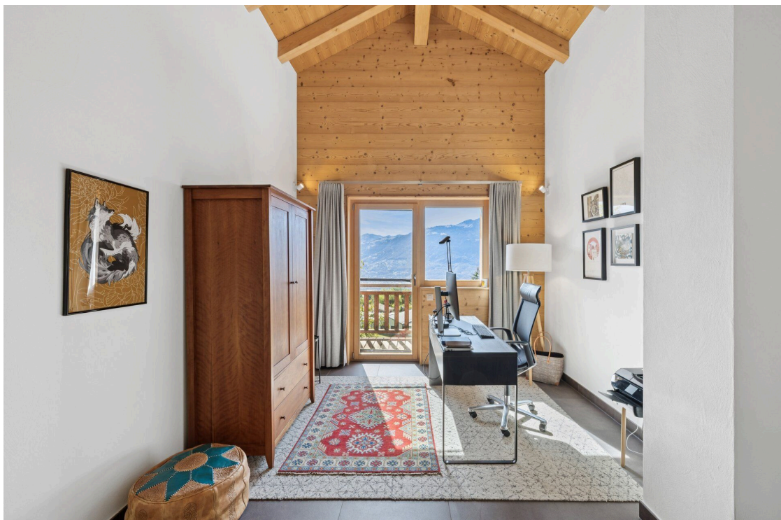
Büro 1. Stock