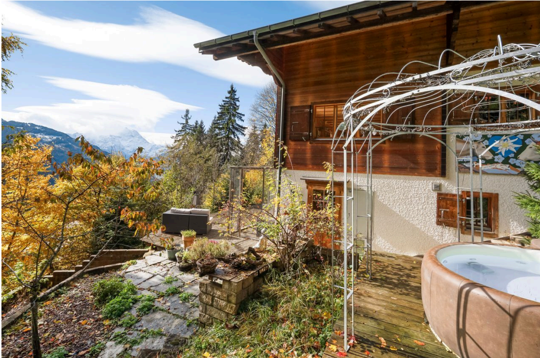
Chalet & Terrace