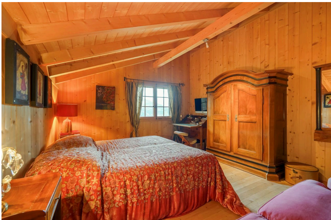
Zimmer 3 - Etage