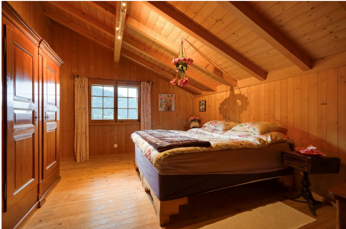
Zimmer 1 - Etage