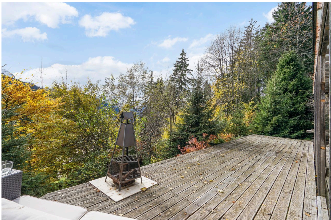
Terrase rez inférieur