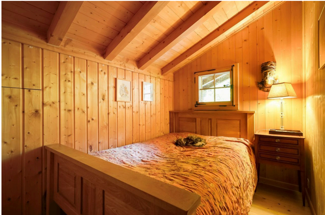
Zimmer 2 - Etage