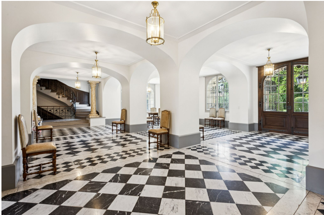
Eingangshalle des Wohnheims