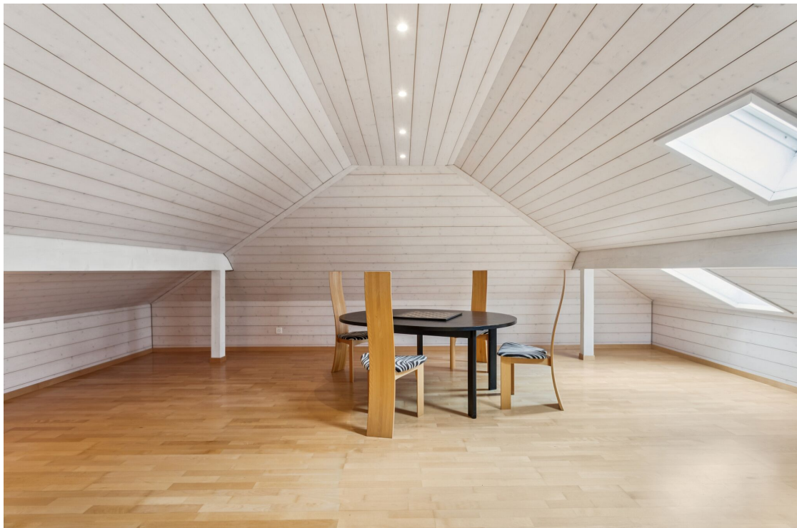
Zimmer im Obergeschoss