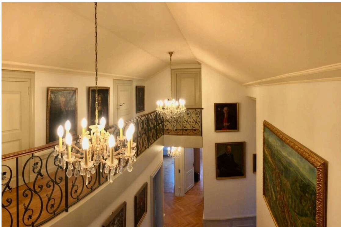
Galerie im Obergeschoss