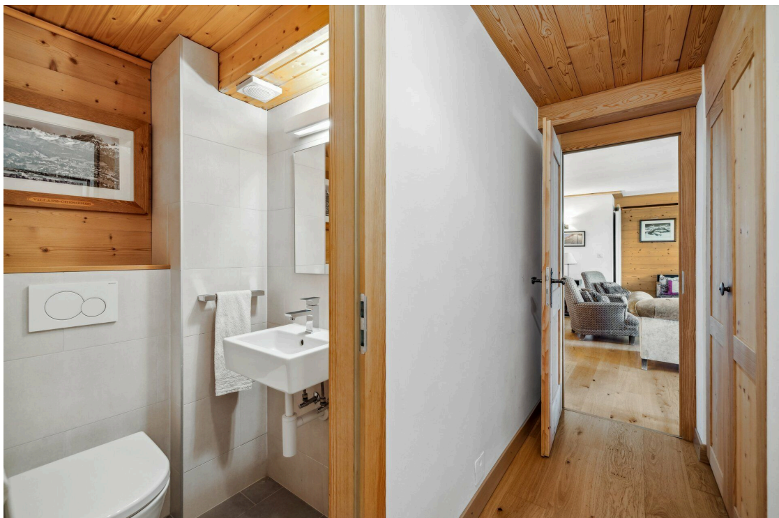
Badezimmer – Flur