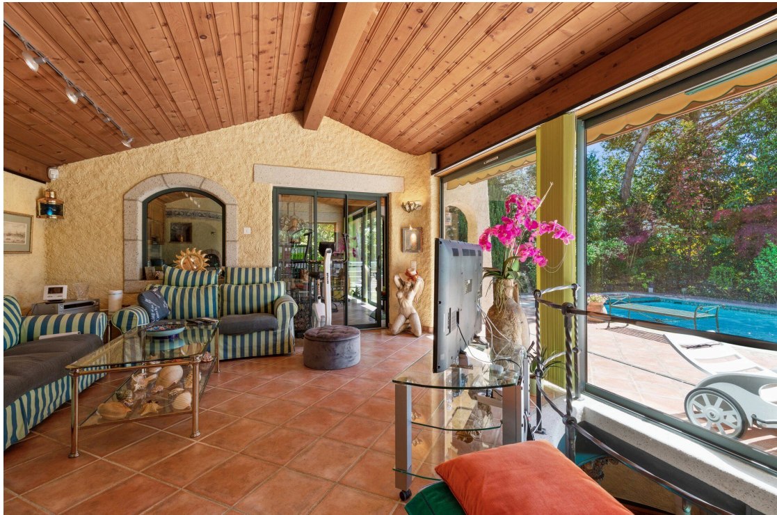
Pool-house/Sommersalon und Wintergarten mit Küche sichtbar im Hintergrund