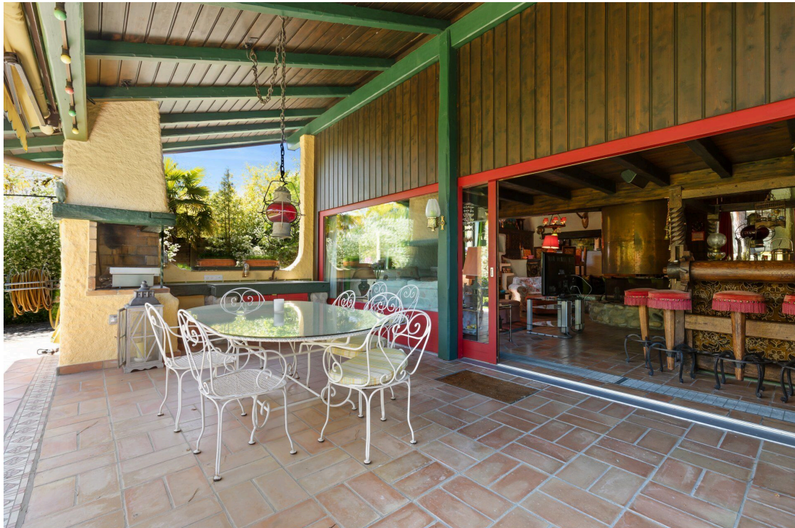
Gedekte Terrasse mit Kamin zum grillieren oder mit el. Plancha