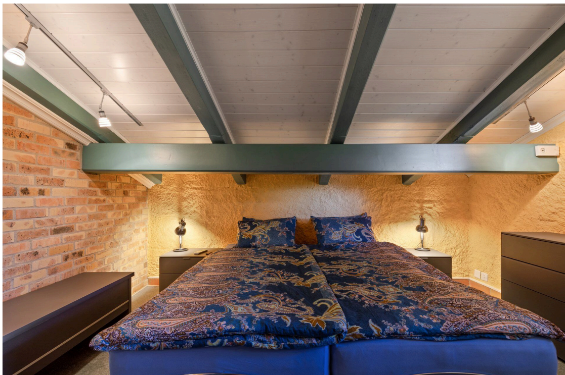
Schlafzimmer im 1