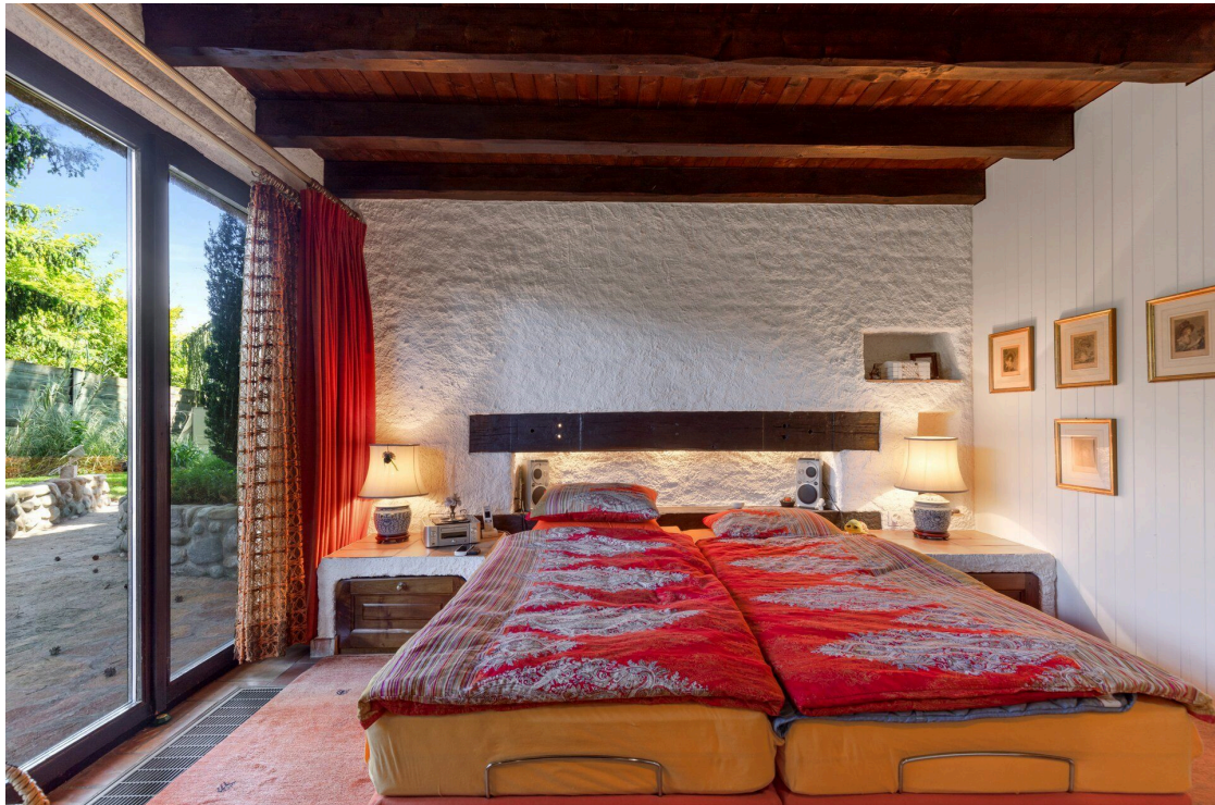
Schlafzimmer im Erdgeschoss