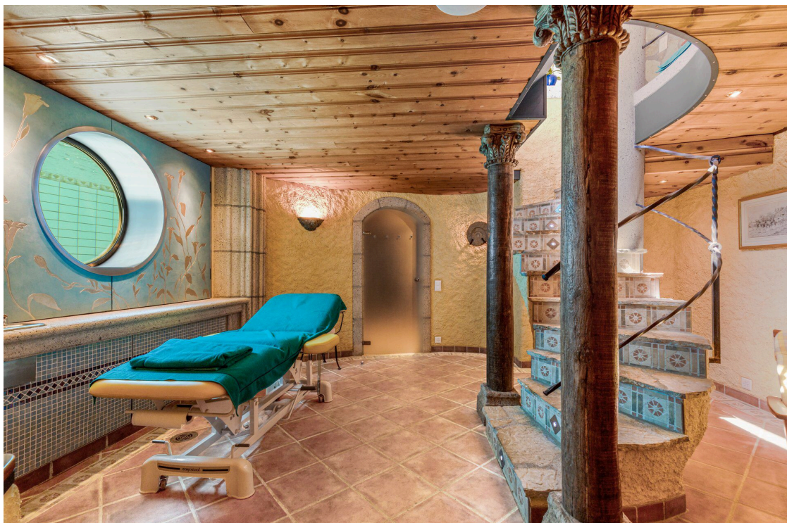
Fitness-, Massage- und Entspannungsbereich