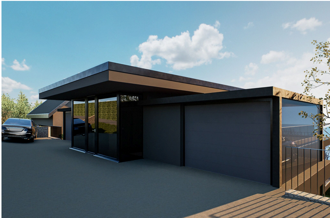
Parkplatz mit zwei Garagen