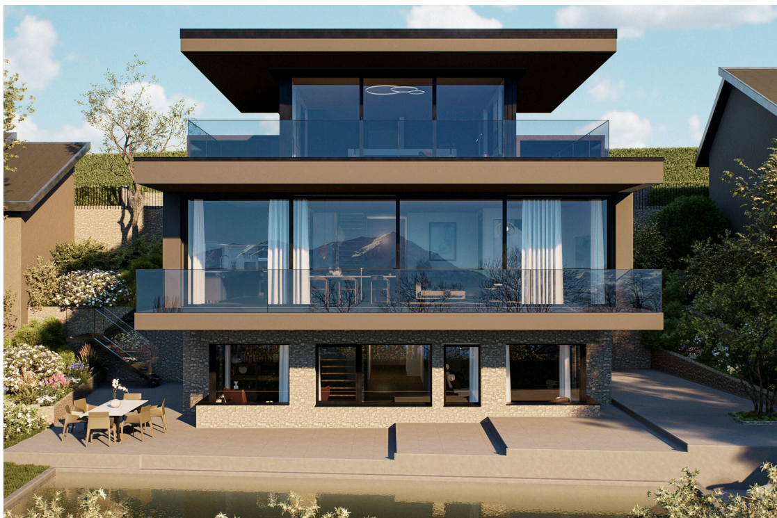
Terrasse mit Pool