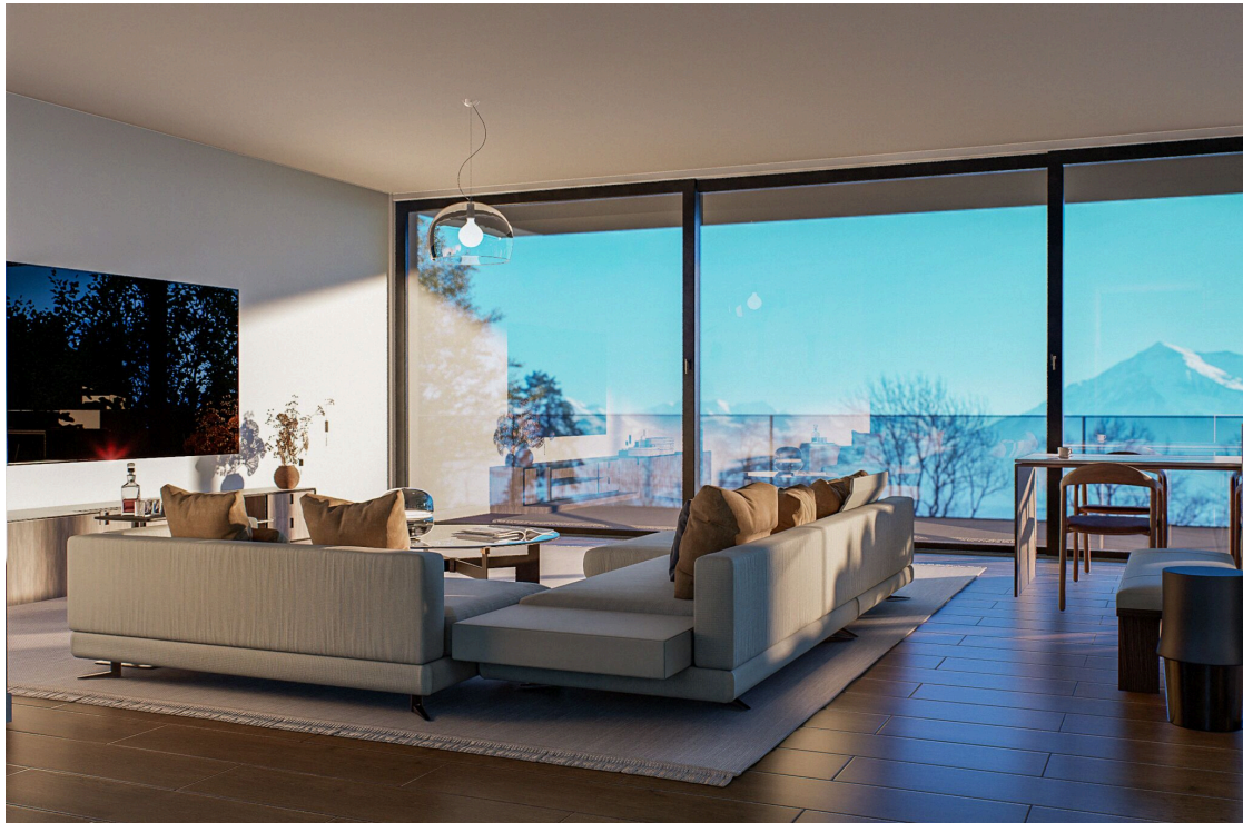
Großer, nach Süden ausgerichteter Sallon