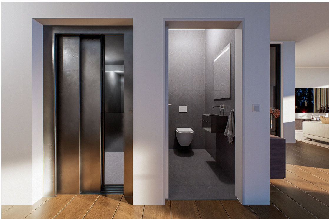
Der Eingangsberich mit Aufzug