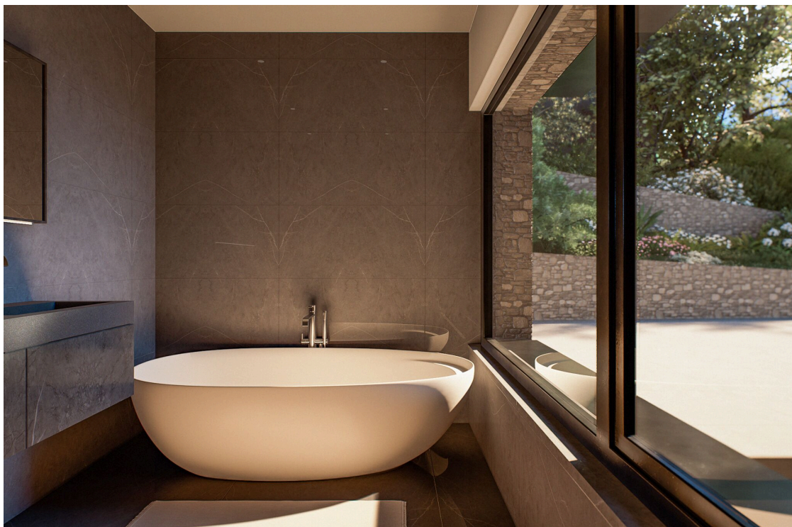
Badezimmer in der Suite im Erdgeschoss