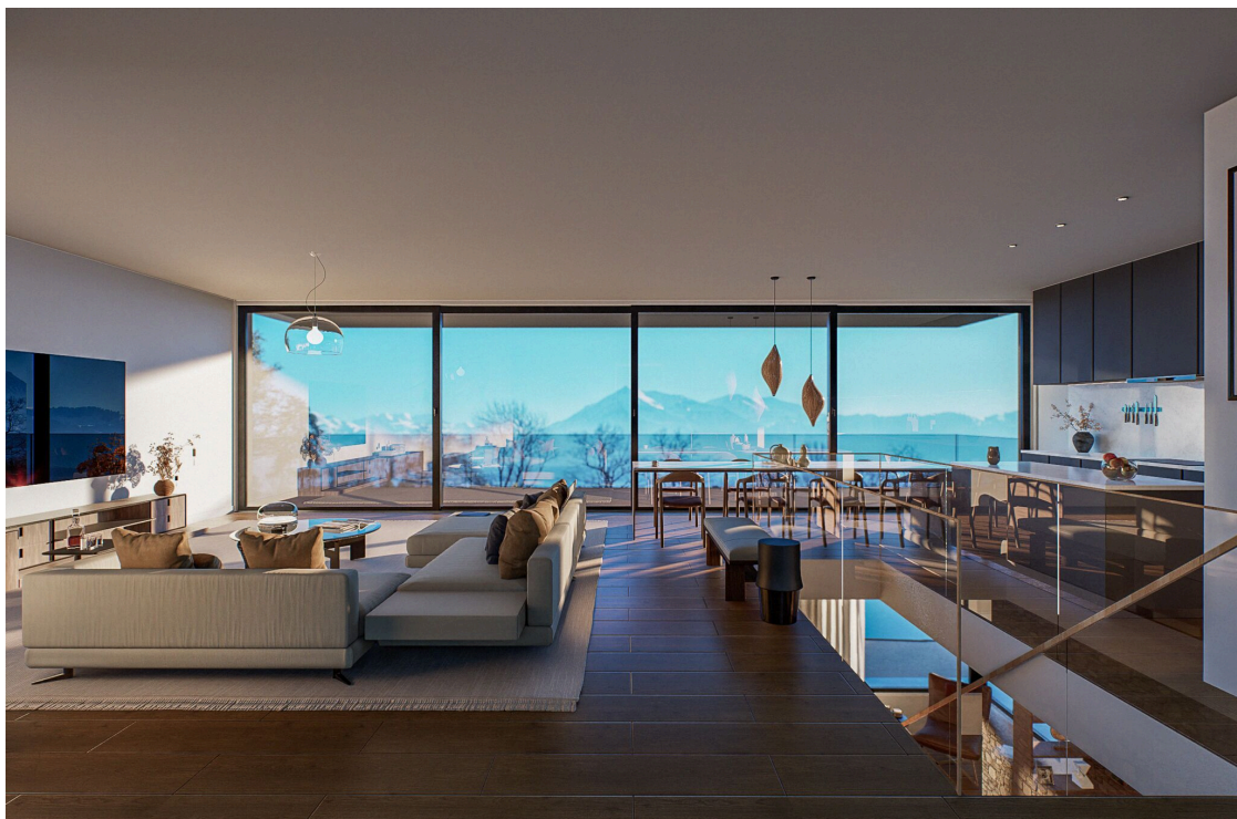
Wohnzimmer mit paronymischer Aussicht