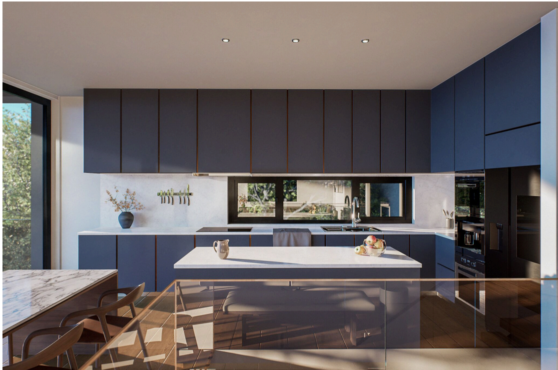
Helle offene Küche