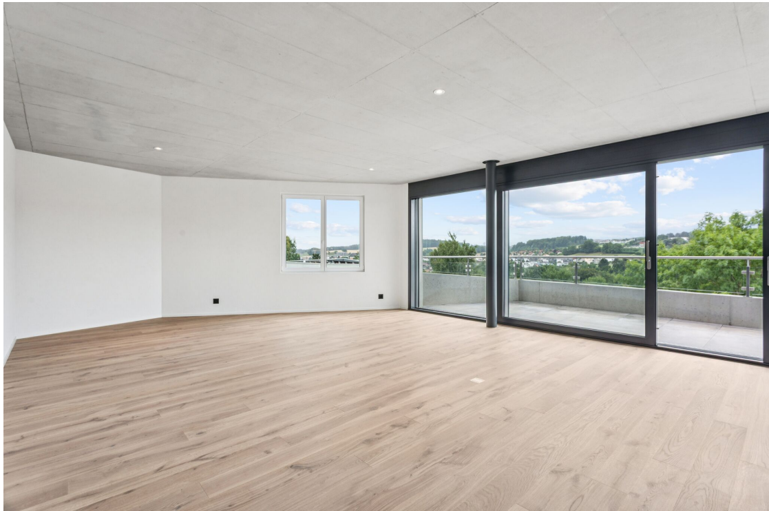
La pièce à vivre