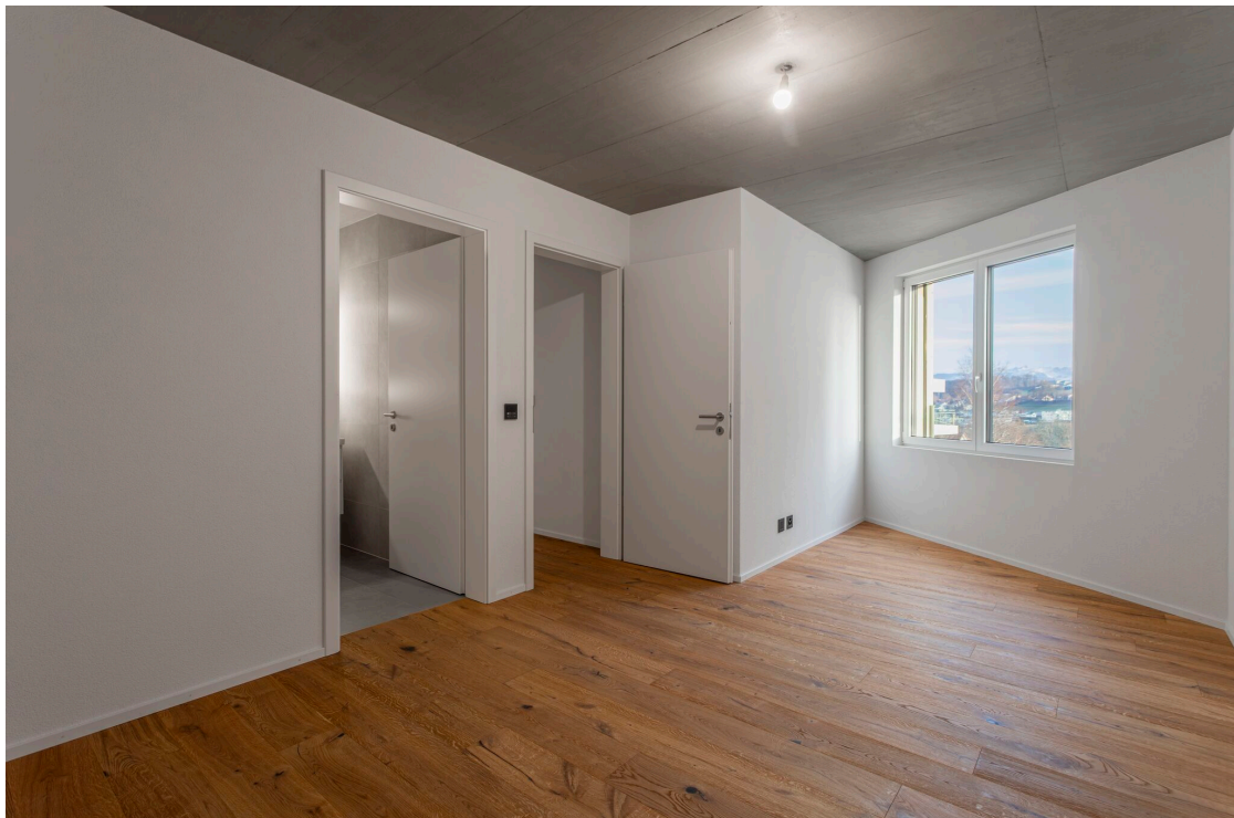
La chambre parentale avec salle d'eau en suite