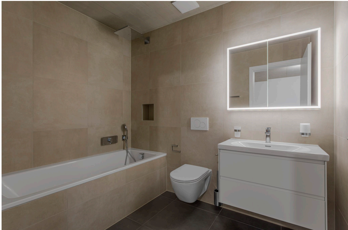
La salle de bains privative