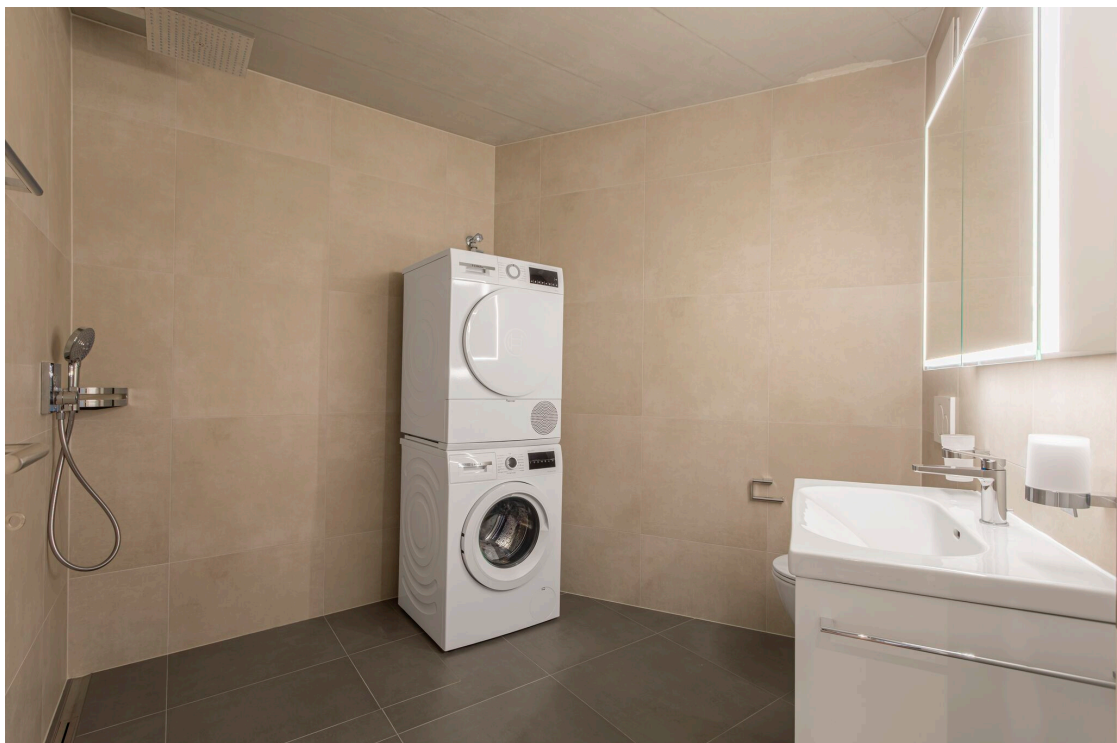
La salle de douche avec colonne de lavage