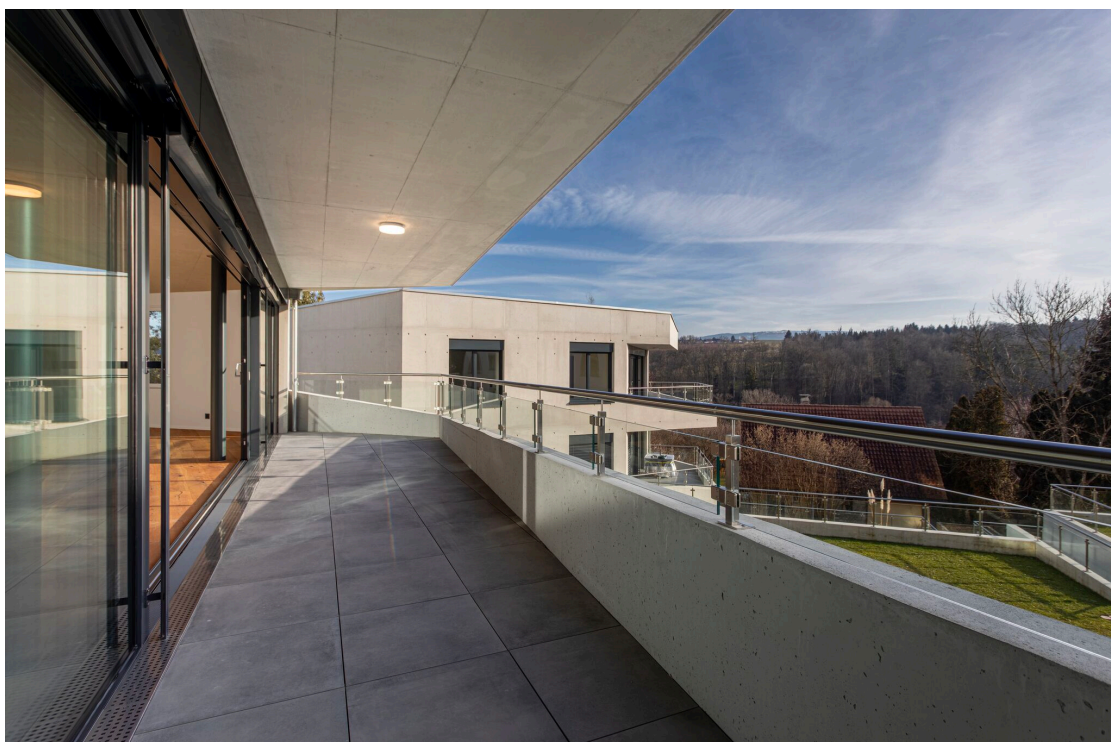
Le balcon avec une belle vue dégagée