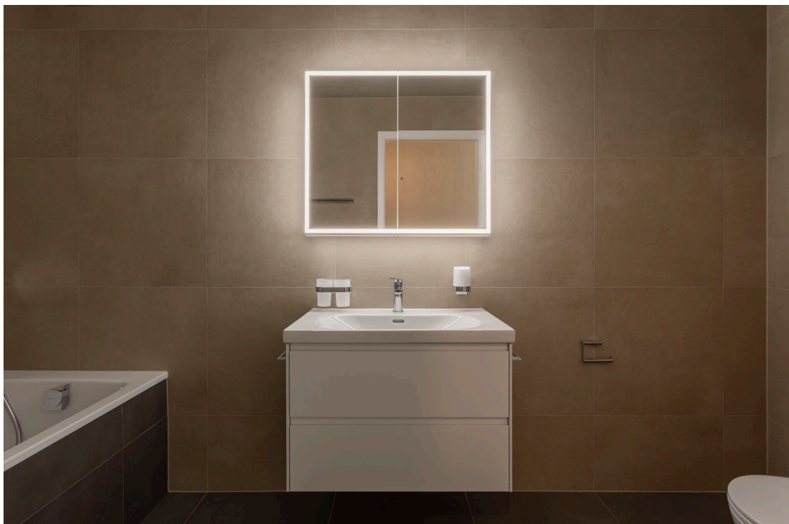
La salle de bains en suite parentale