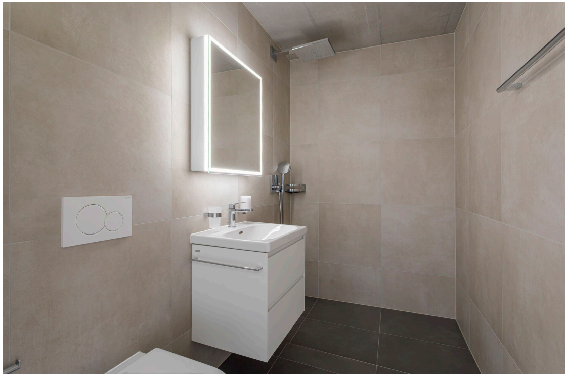
La salle de douche avec colonne de lavage