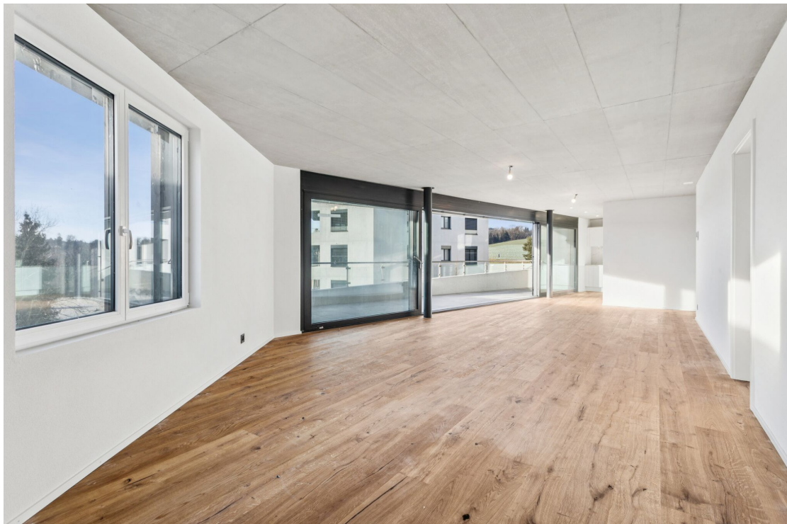
La pièce à vivre