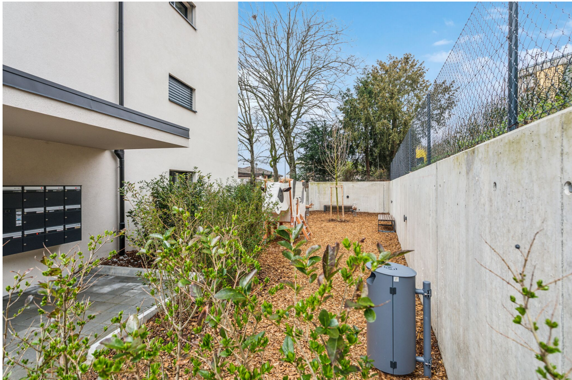
Place de jeux