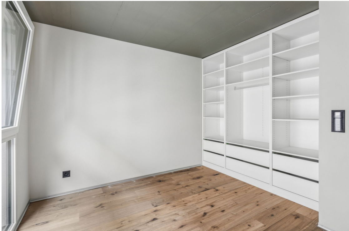
Chambre d'enfant avec dressing