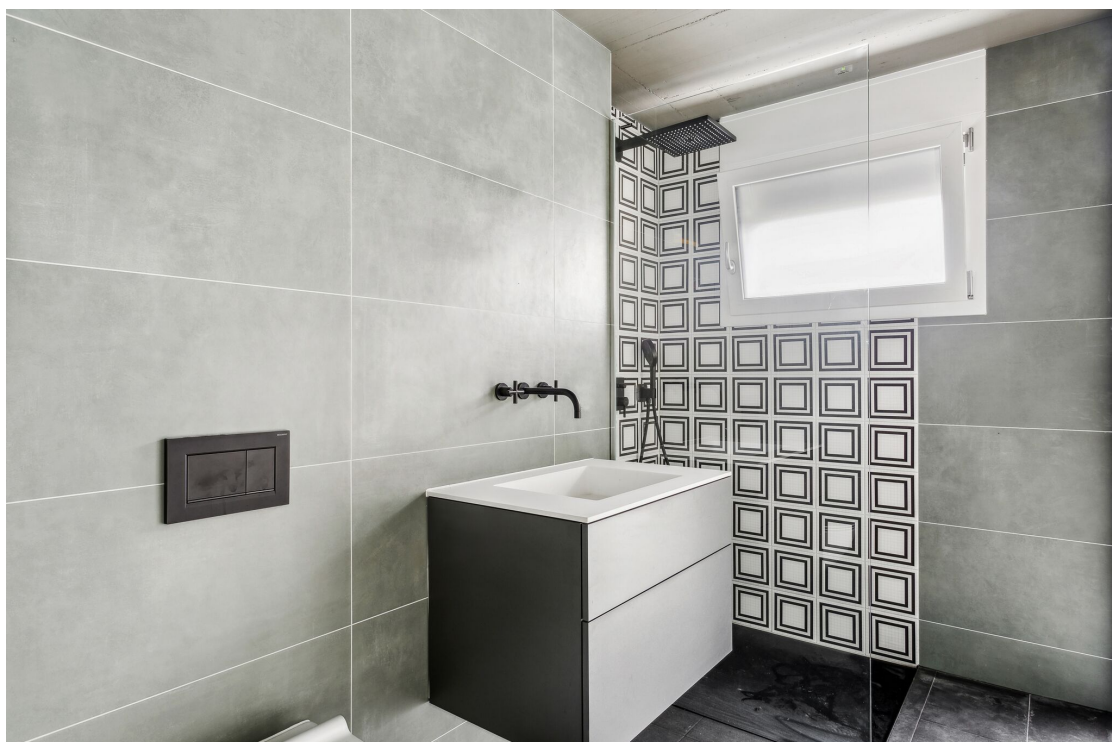
Salle de douche de la suite parentale