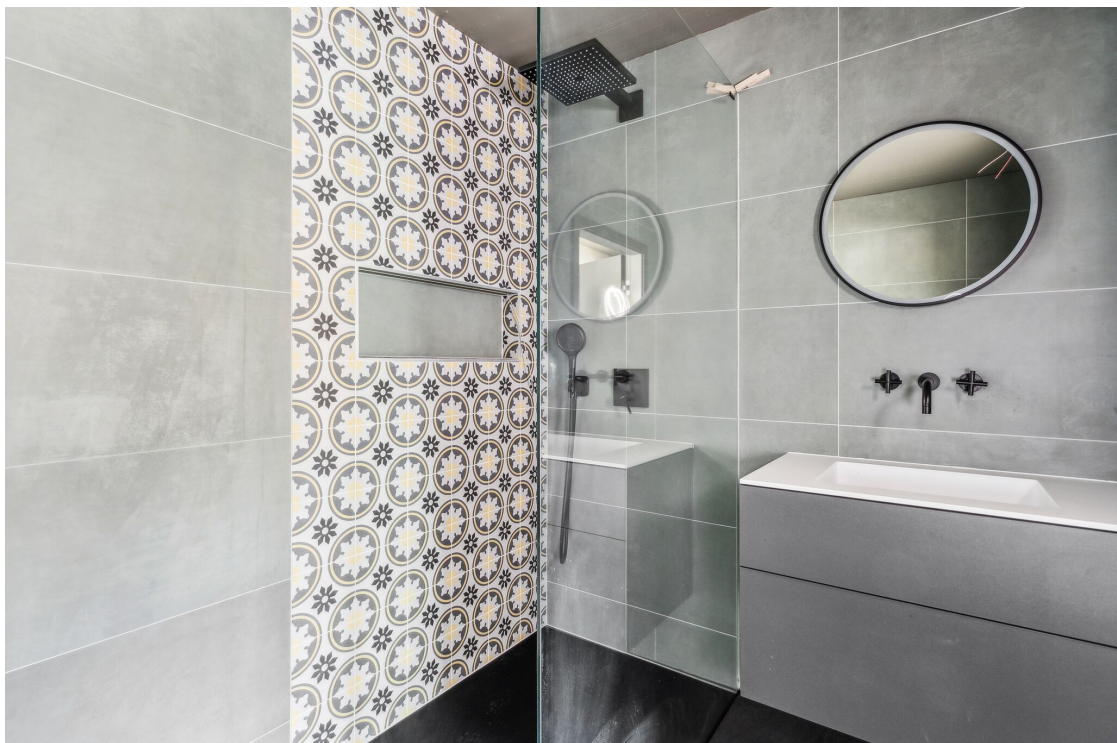
Salle de douche