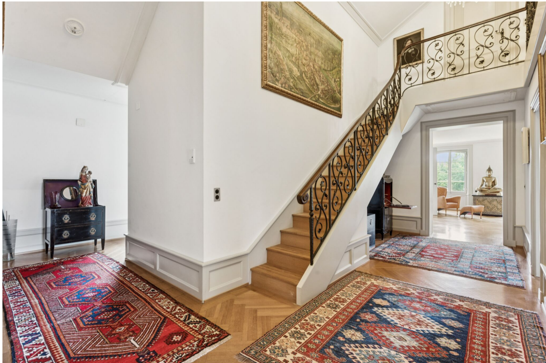
Hall de distribution