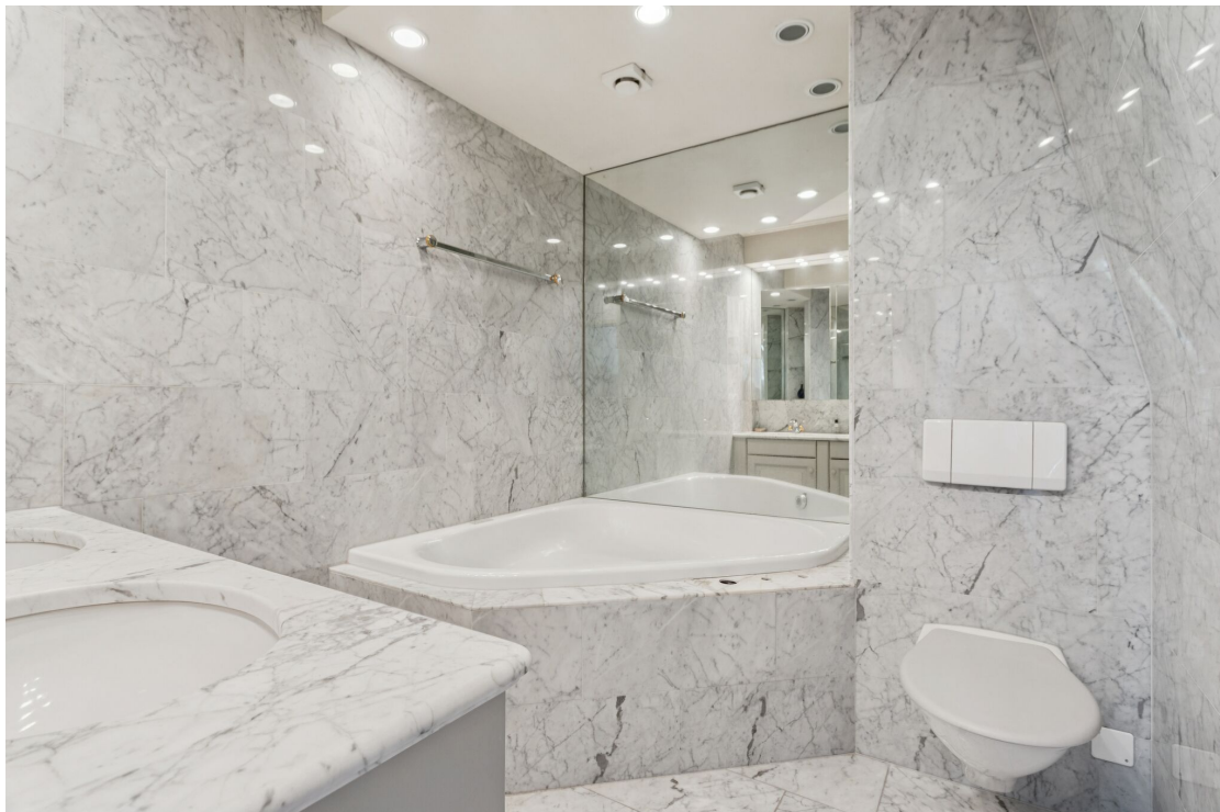
Salle de bains dans la chambre parentale