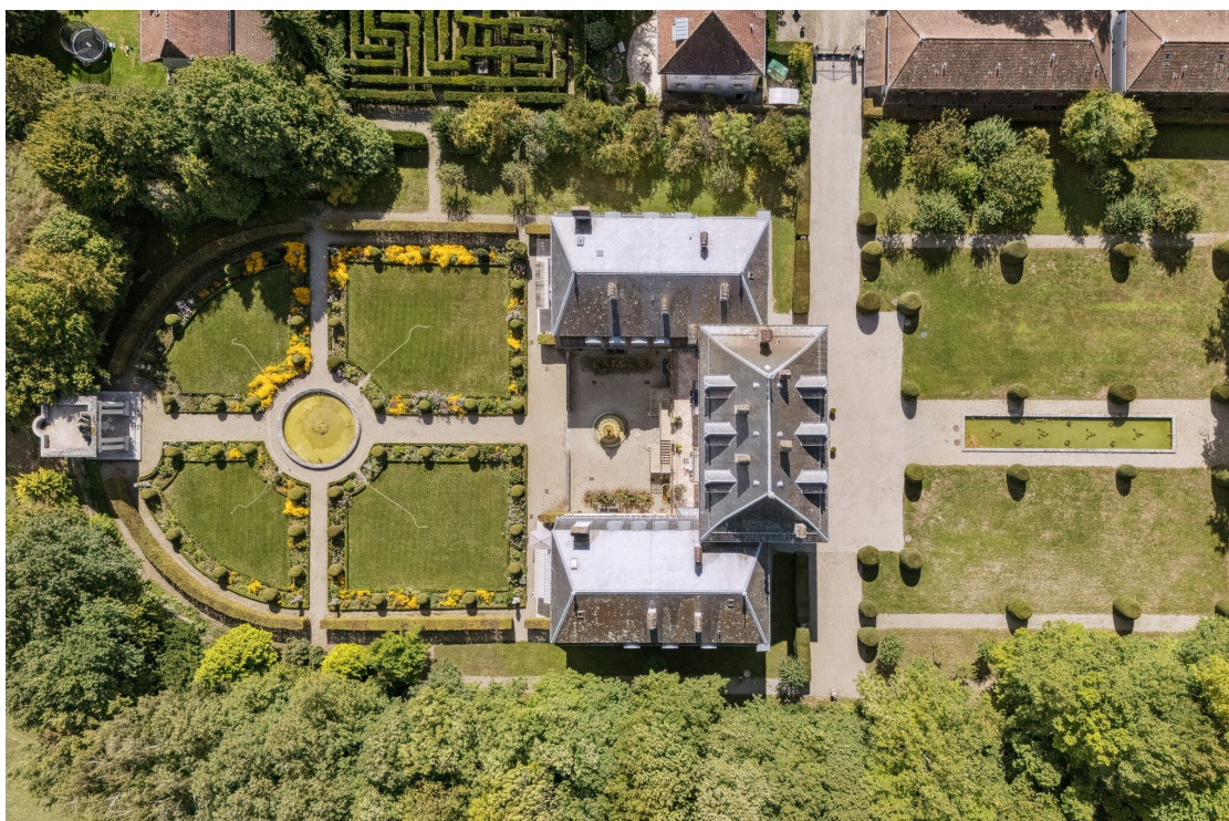
La propriété et ses jardins