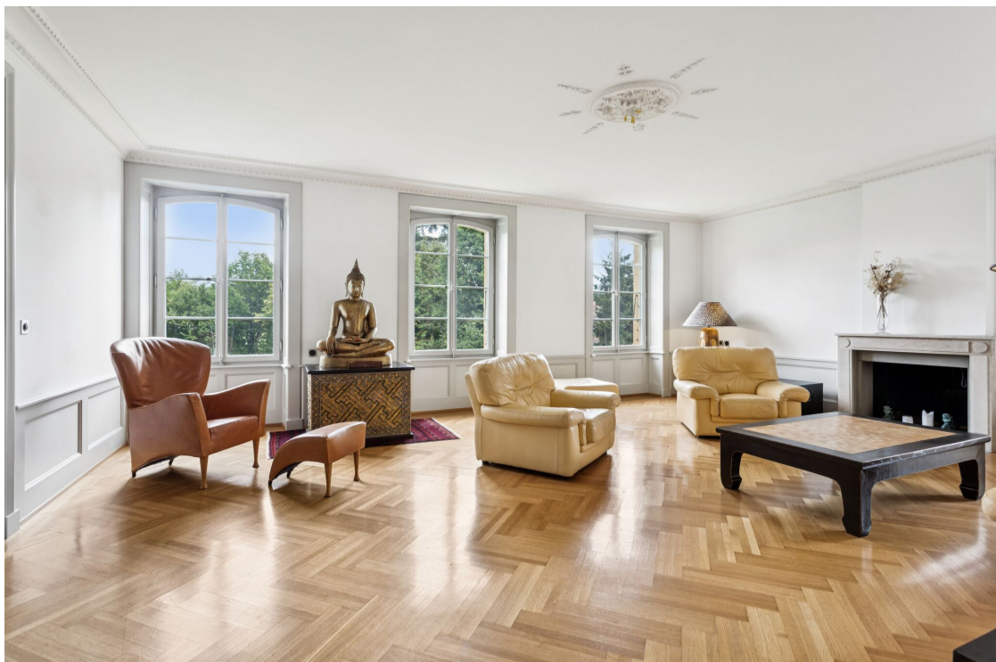
Pièce à vivre