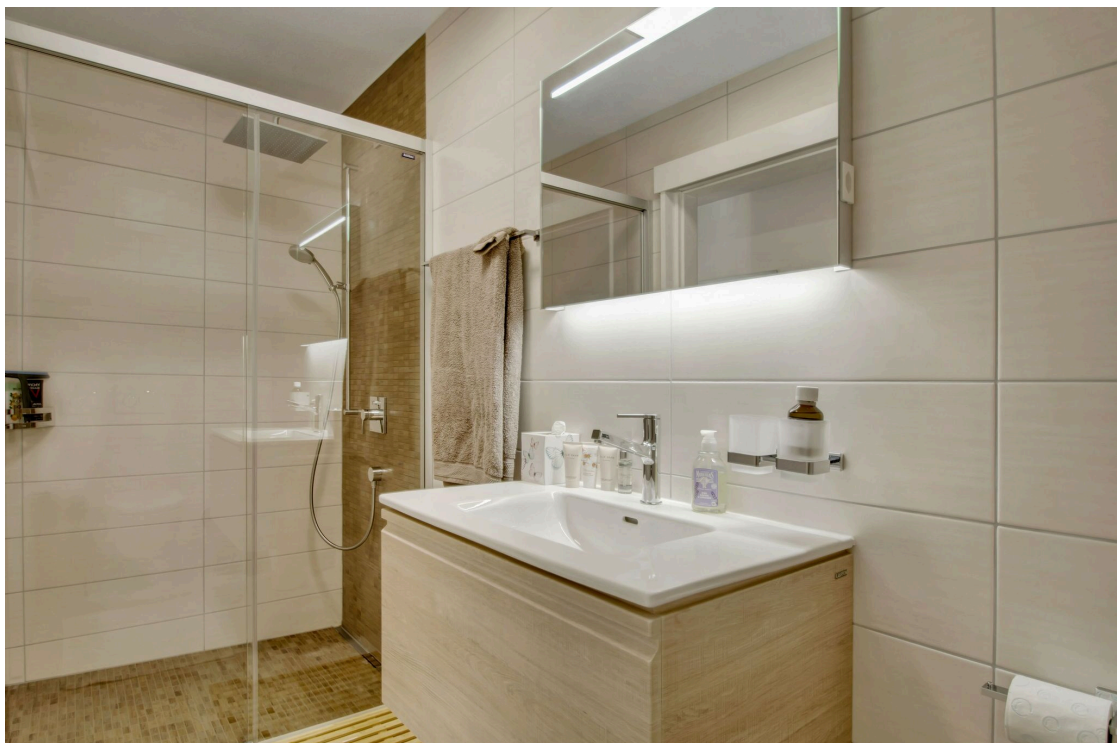
Salle de douche