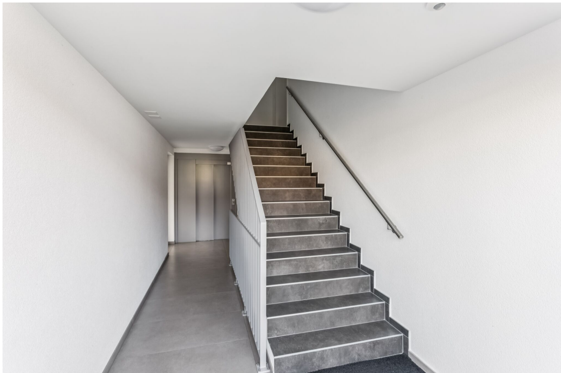
Hall de la PPE avec ascenseur