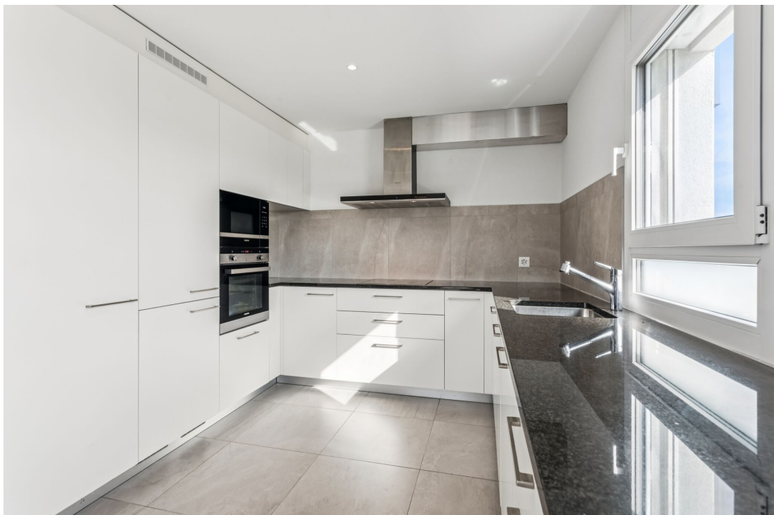
Cuisine ouverte bien équipée