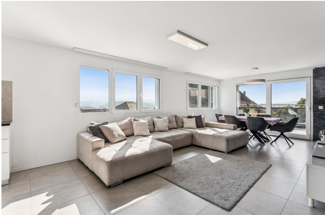
Séjour avec accès au balcon