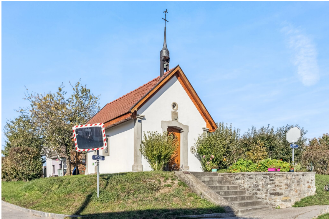
A proximité du centre du village