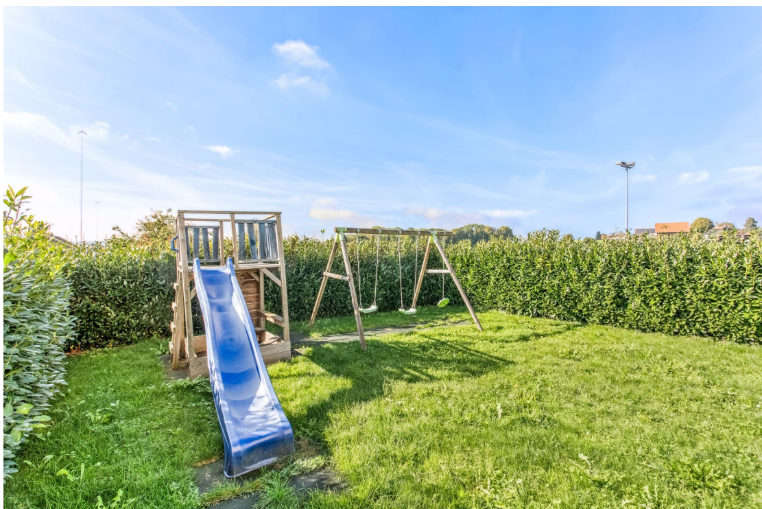
Place de jeux de la PPE