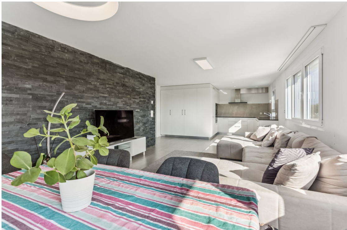
Séjour ouvert sur la cuisine