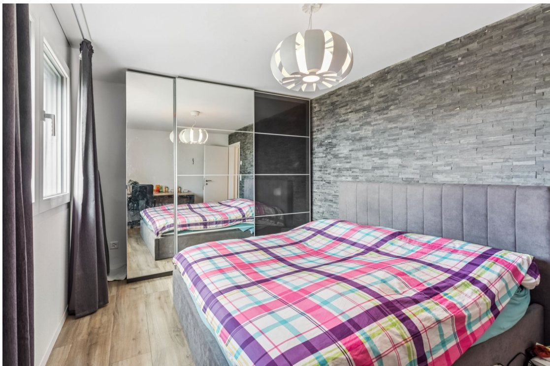
Chambre à coucher parentale