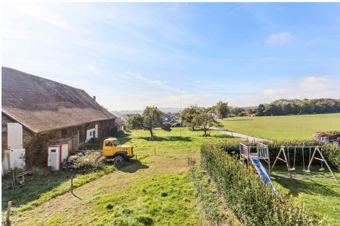
Dégagement depuis le balcon