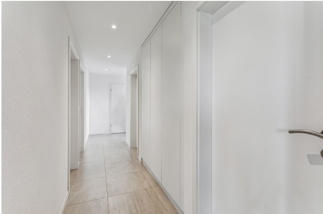
Hall de distribution avec armoires