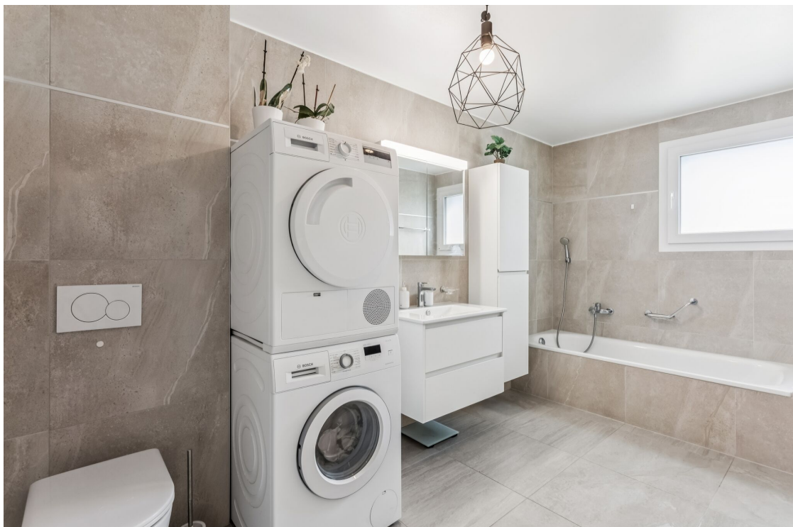
Salle de bains avec colonne de lavage