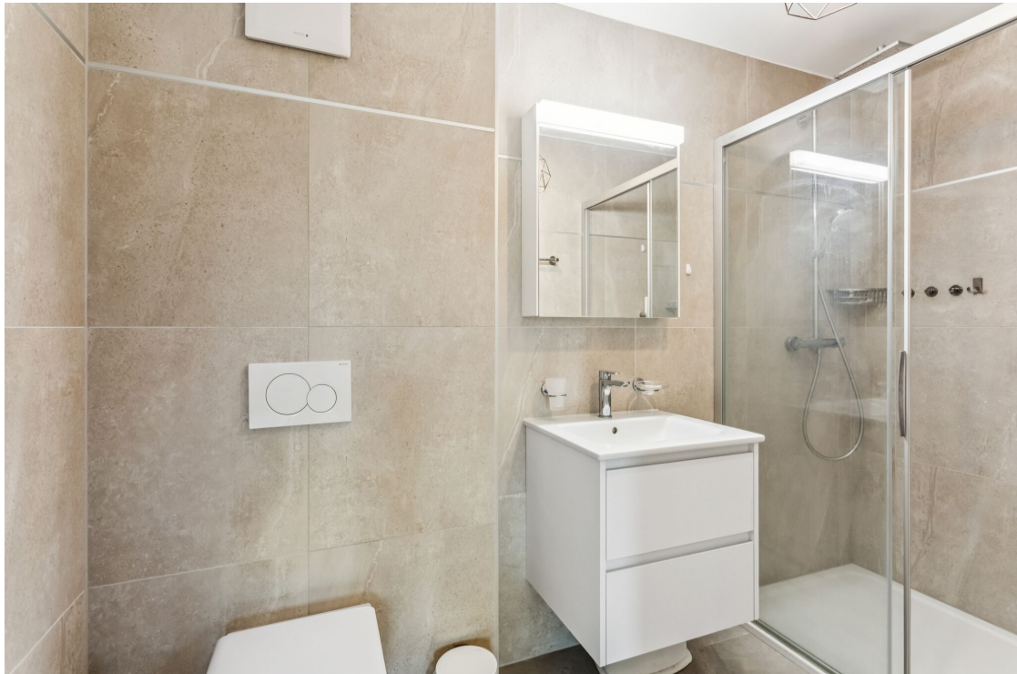
Salle de douche