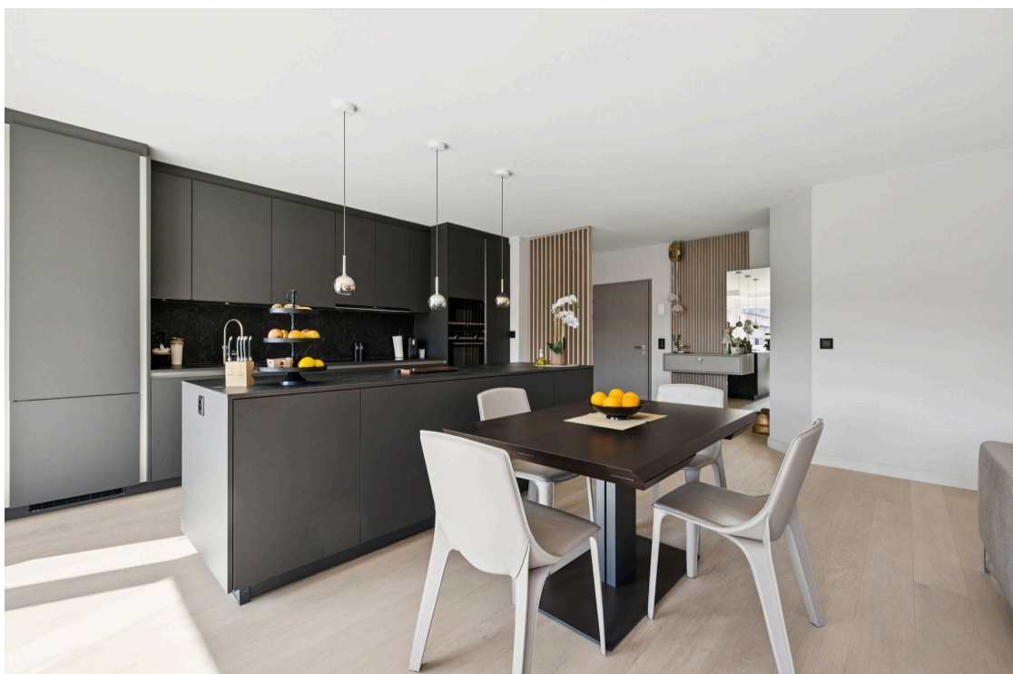
Séjour et cuisine ouverte