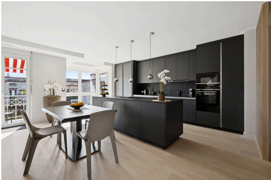
Séjour et cuisine ouverte