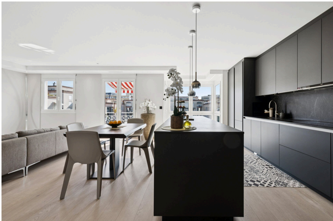
Séjour et cuisine ouverte