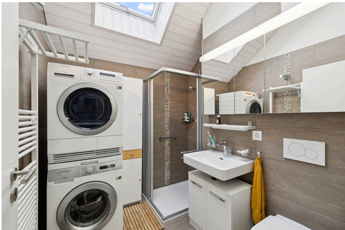
Une salle de bains moderne avec toilettes blanches, lavabo, douche et machine à laver dans un petit grenier