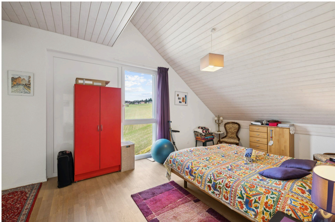
Une chambre avec un grand lit et une grande fenêtre au plafond