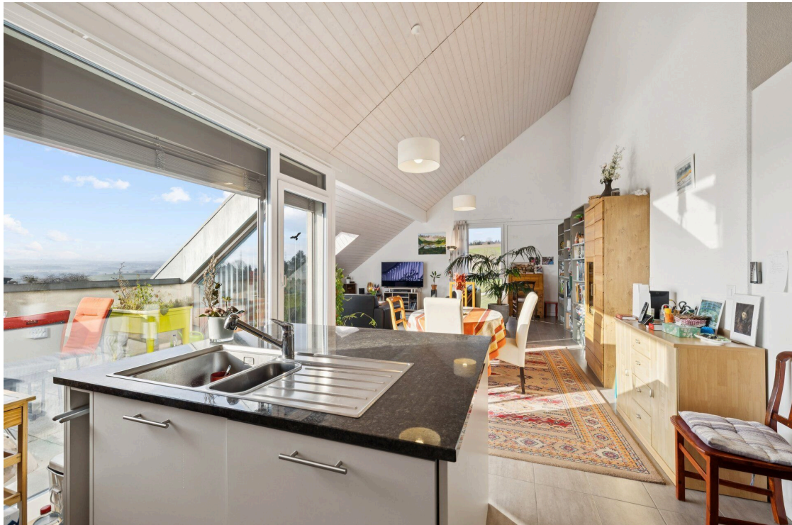
La cuisine et le salon d'une maison moderne