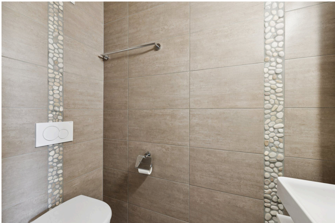
Une salle de bains avec des toilettes blanches et une douche à l'italienne