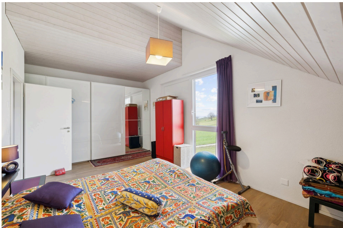
Une chambre blanche avec un grand lit