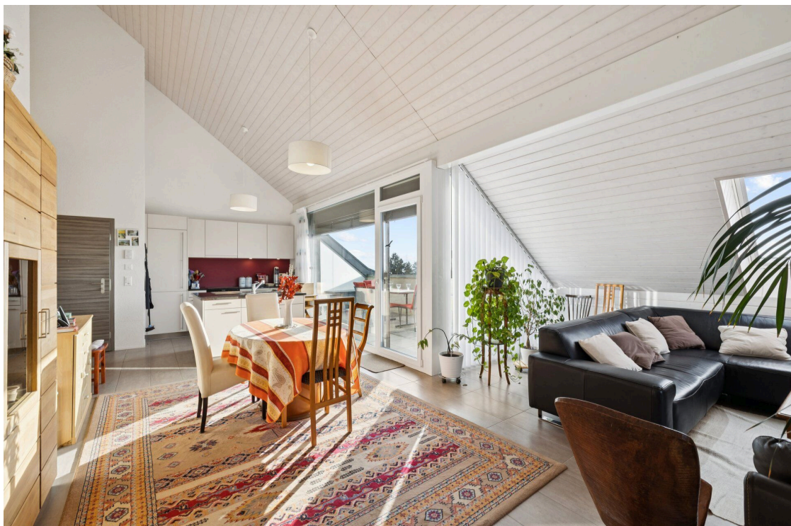
Une grande pièce avec une table et des chaises, un salon et une salle à manger avec vue sur la cuisine