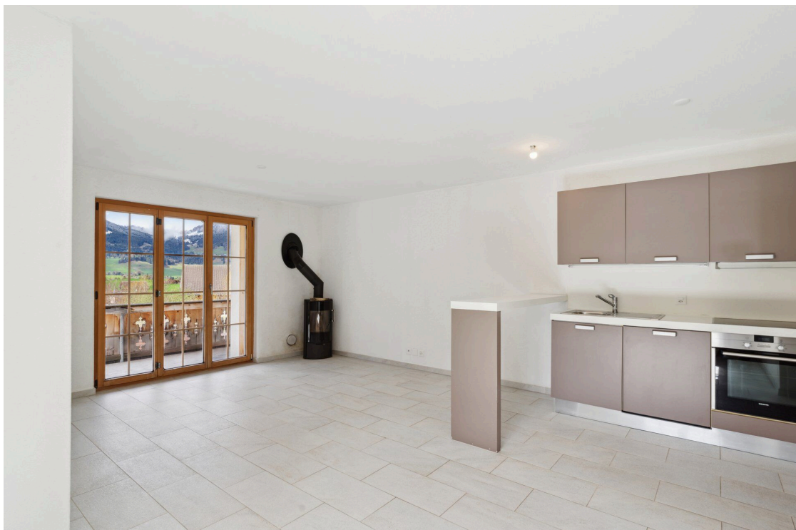
Cuisine ouverte sur le séjour