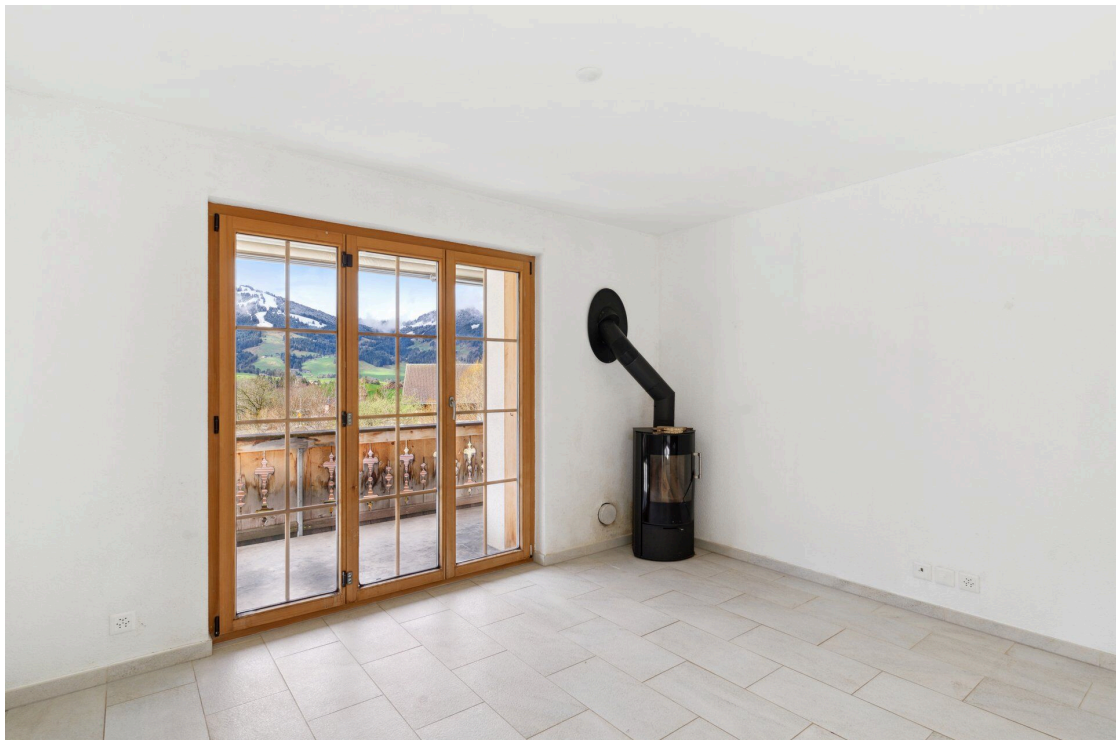
Séjour avec poêle