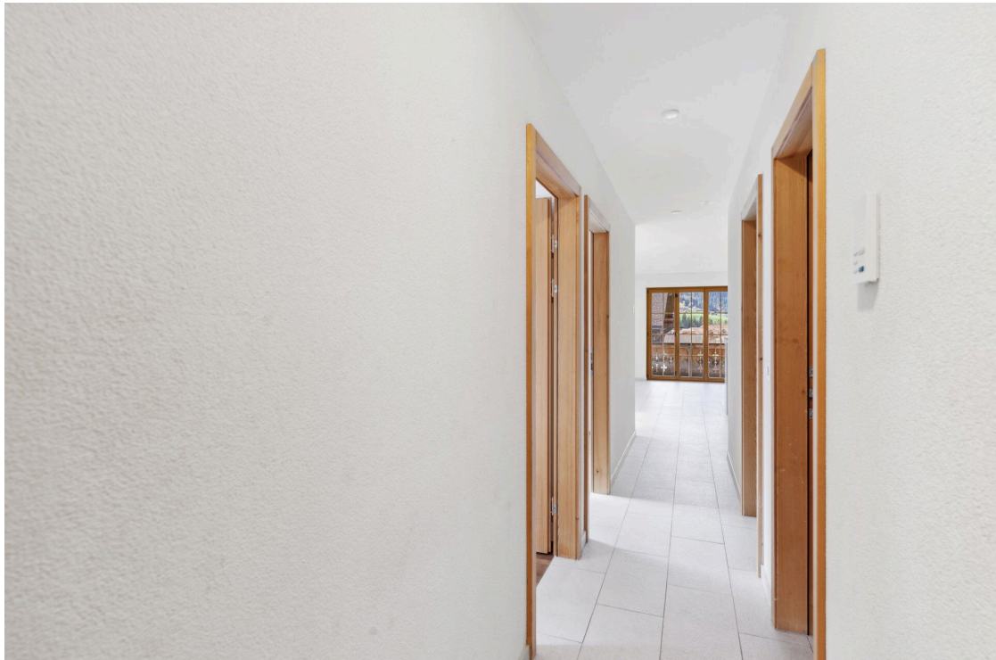
Hall d'entrée et distribution des espaces