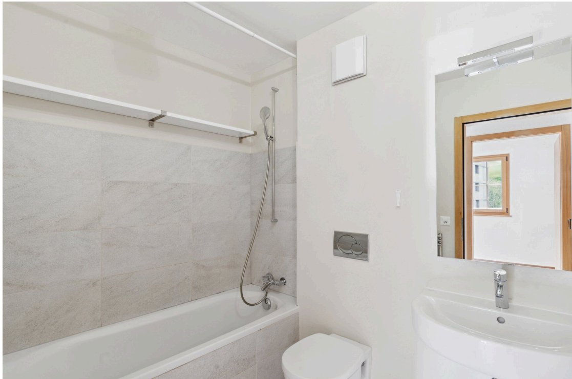
Salle de bain/WC