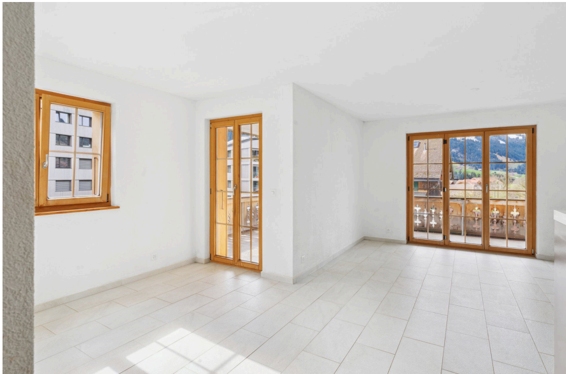
Séjour / coin à manger