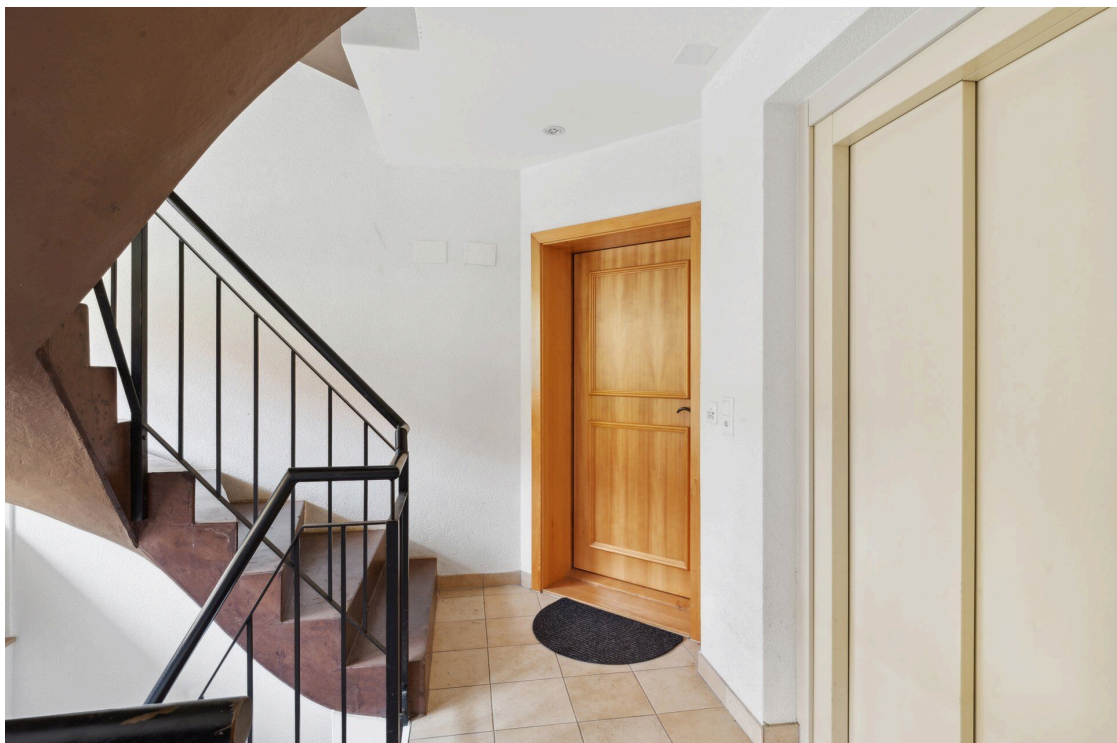
Entrée de l'appartement