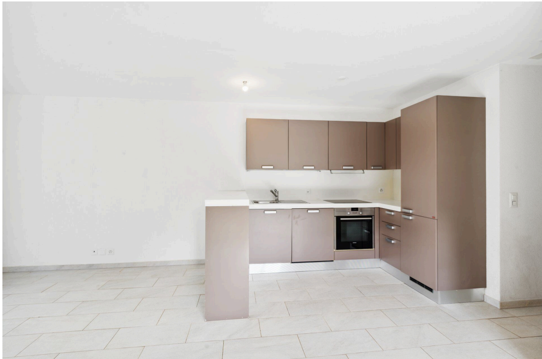
Cuisine ouverte sur le séjour