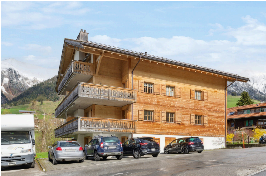
Façade de l'immeuble