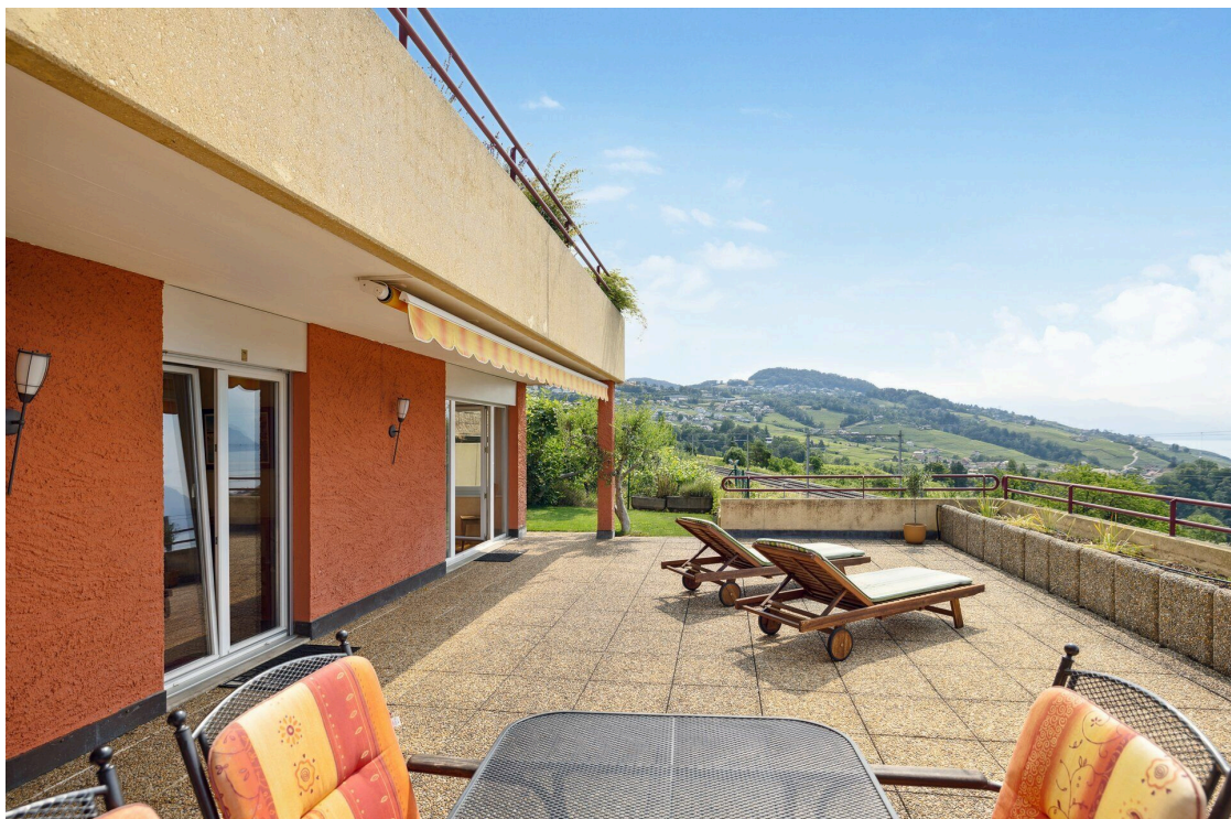
Terrasse avec jardinet