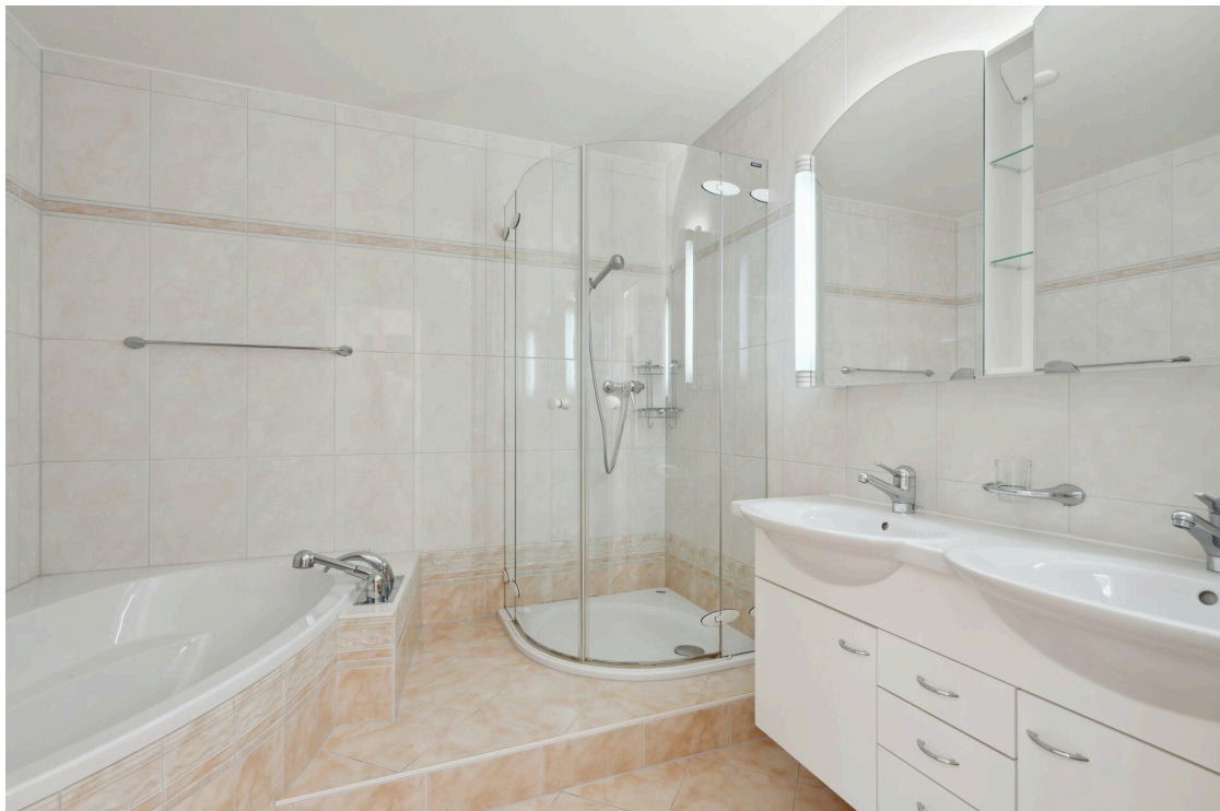
Salle d'eau en suite