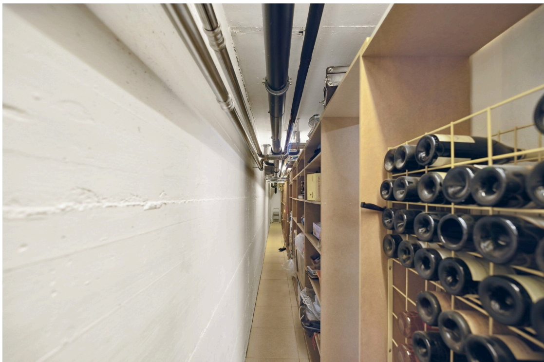
Disponible avec rangement