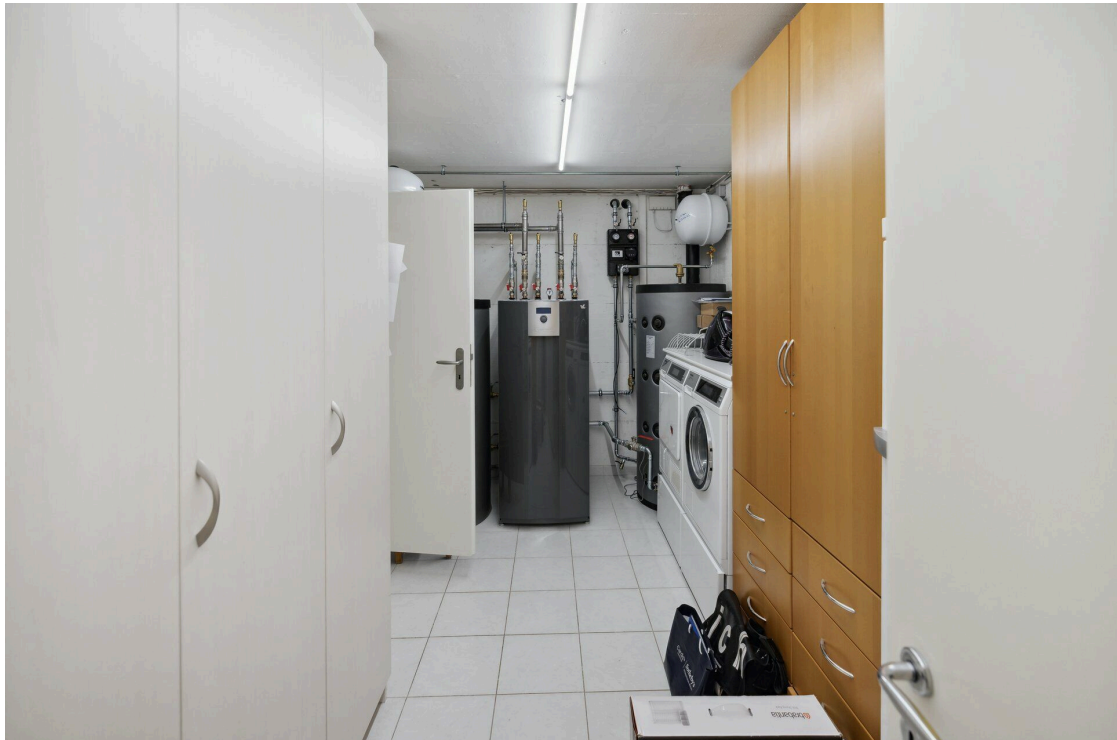
Buanderie / Local technique