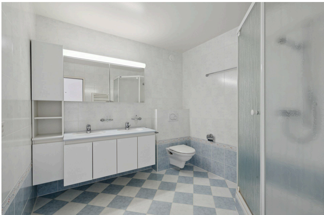
Salle de douche