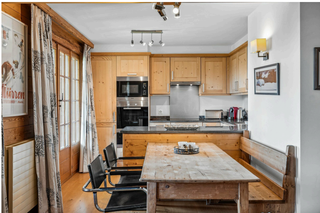
Coin à manger