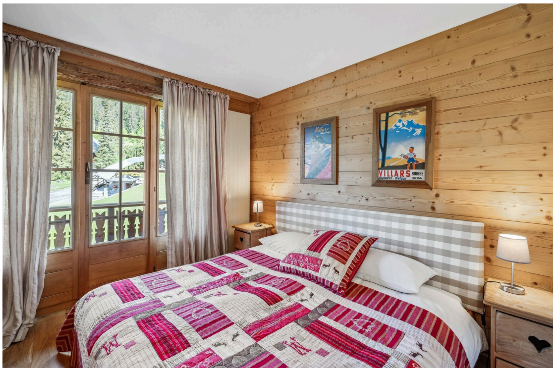
Chambre double 2