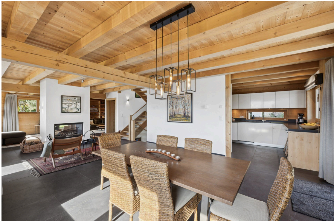
Espace à manger