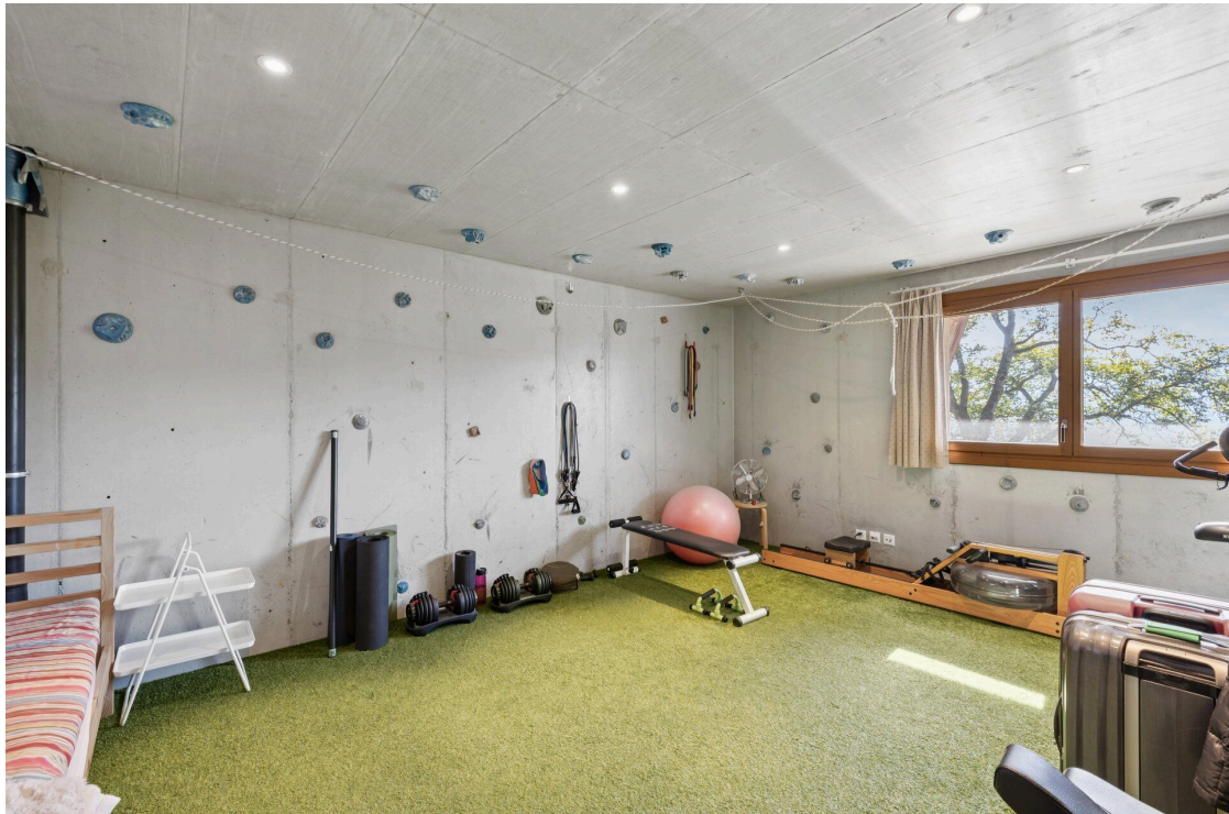
Salle de sport