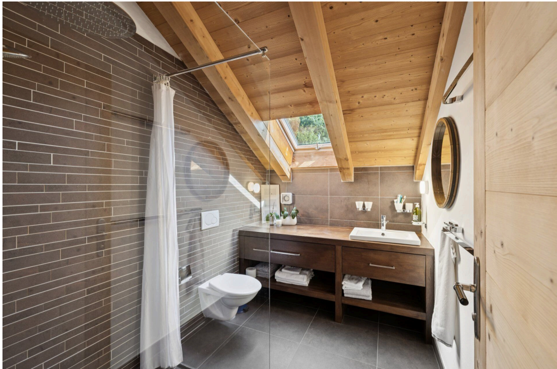
Salle de douche