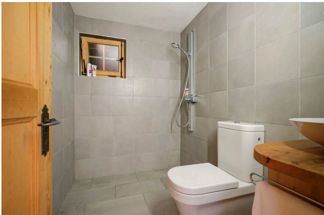
Salle de douche appartement indépendant