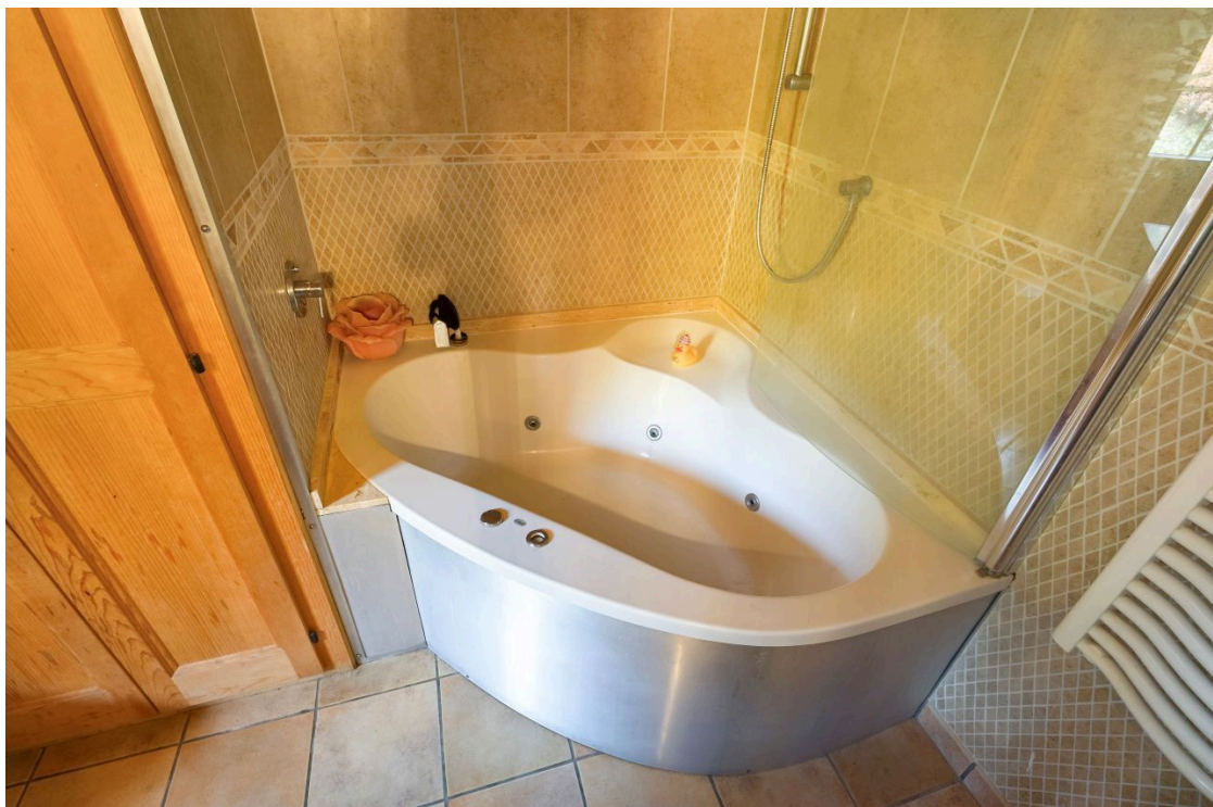
Salle de bain 1er étage