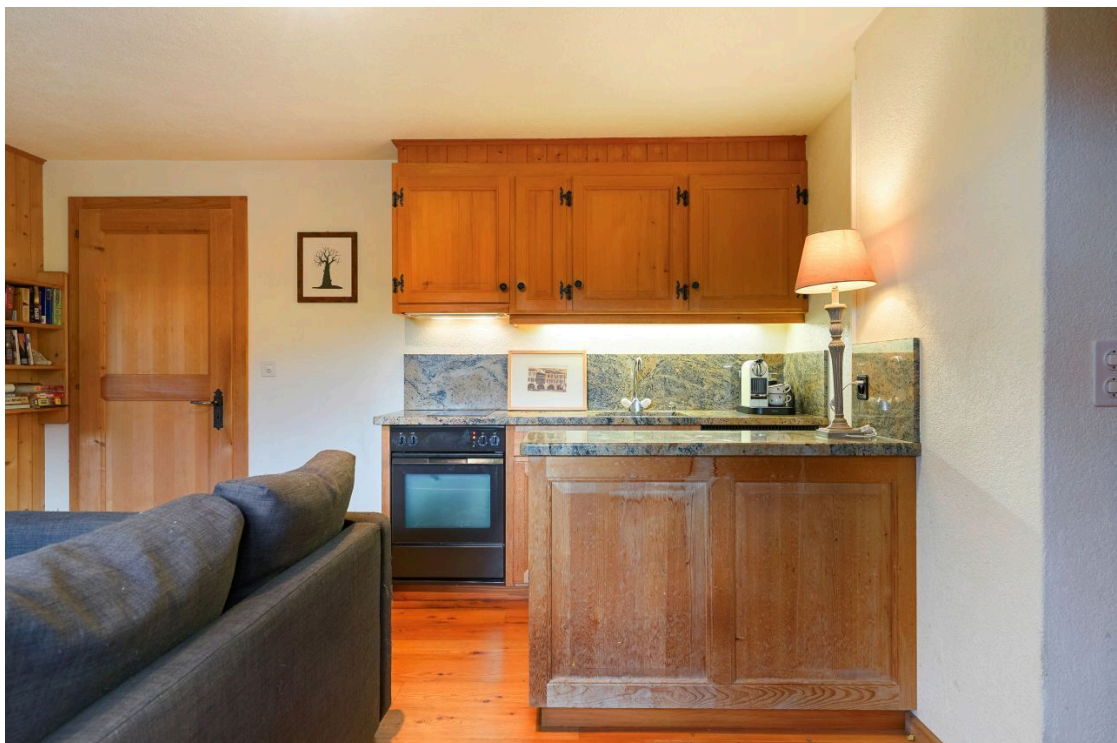
Cuisine appartement indépendant