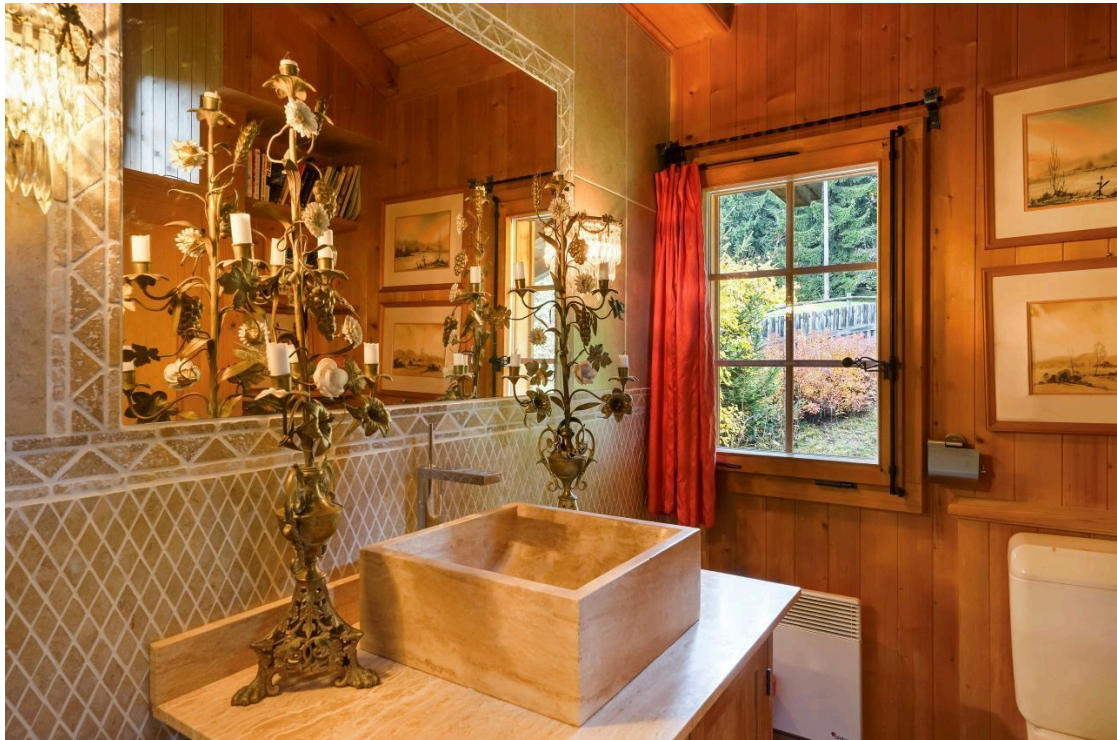
Salle de bain 1er étage