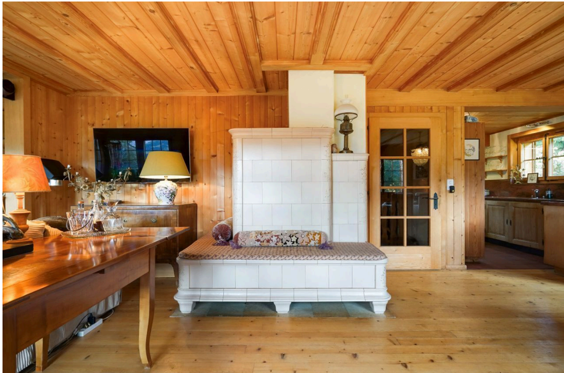
Fourneau à bois