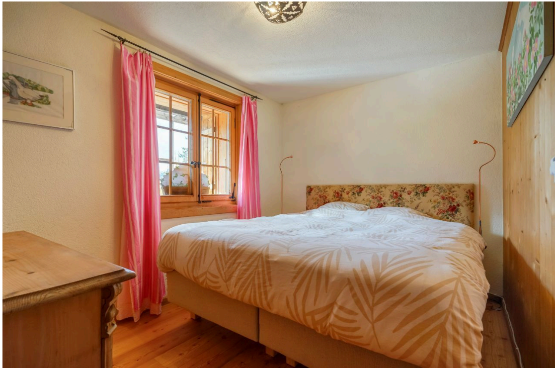
Chambre appartement indépendant