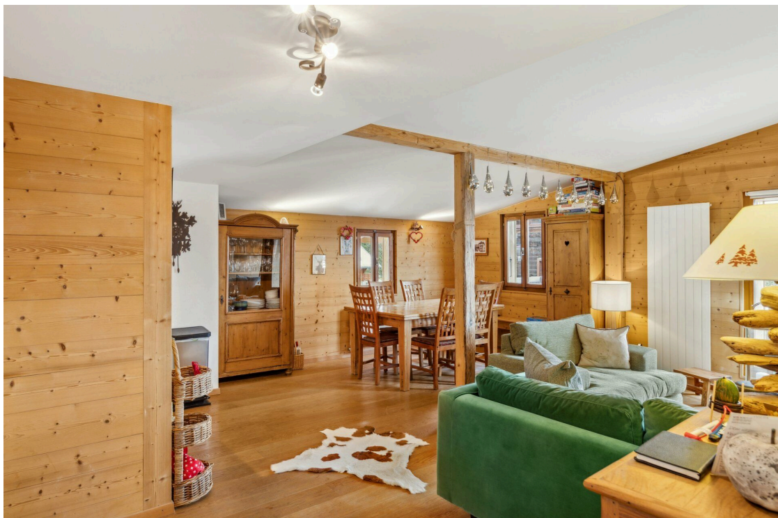
Salon & Salle à manger