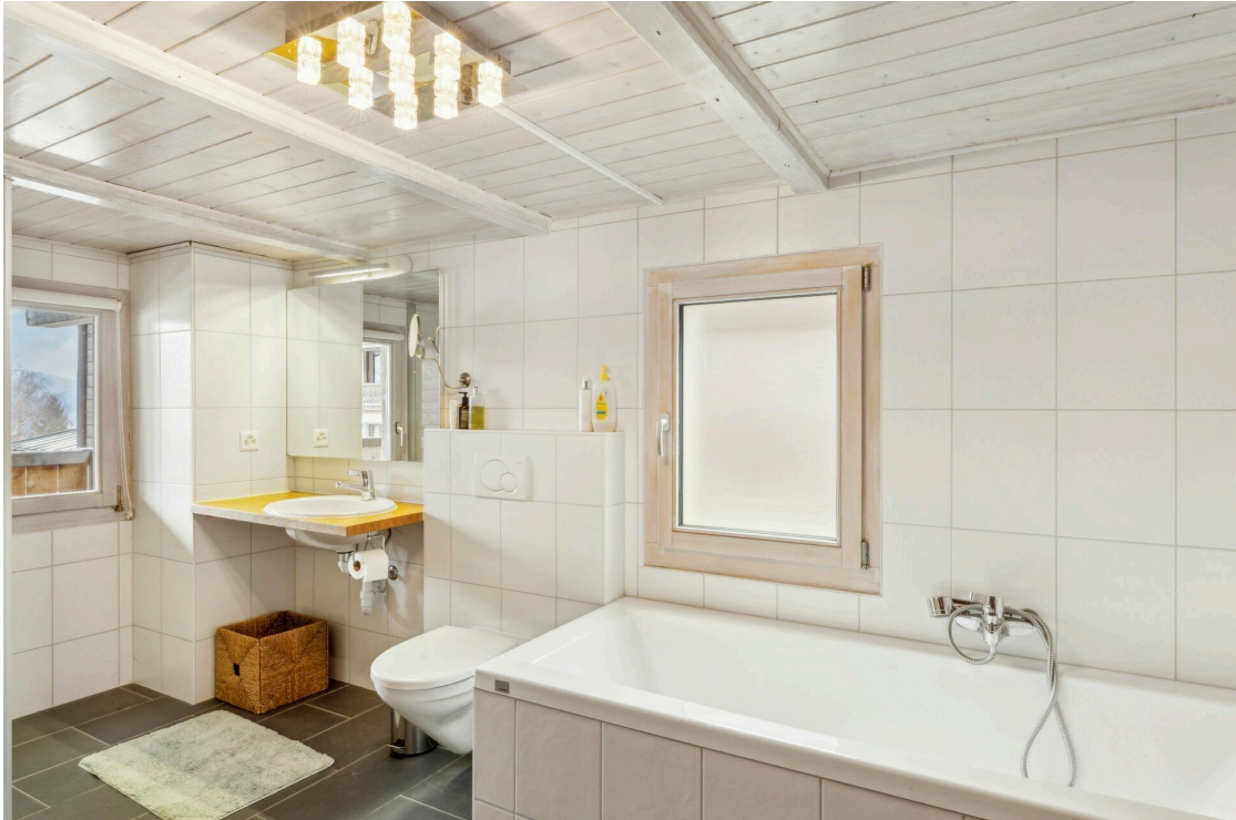
Salle de bain attenante 1