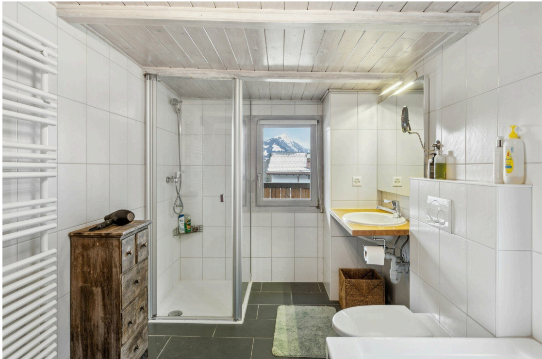
Salle de bain attenante