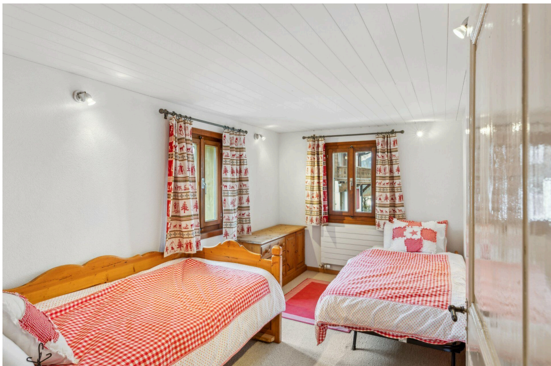
Chambre 4 - rez