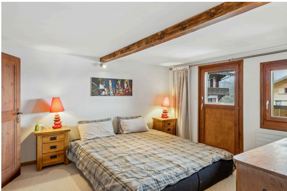
Chambre 2 - rez