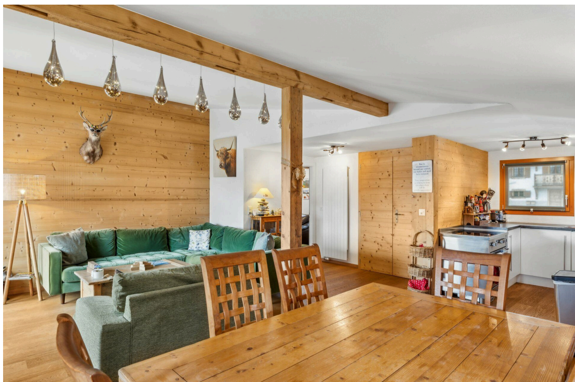
Salon & Salle à manger