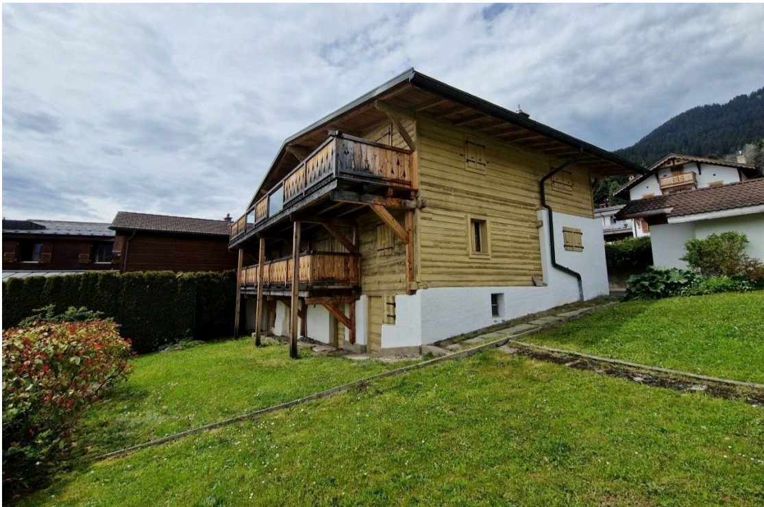
Chalet & Jardin