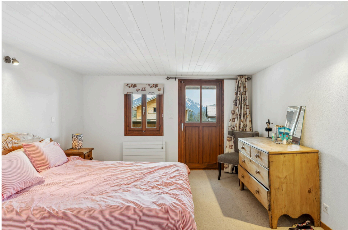
Chambre 3 - rez