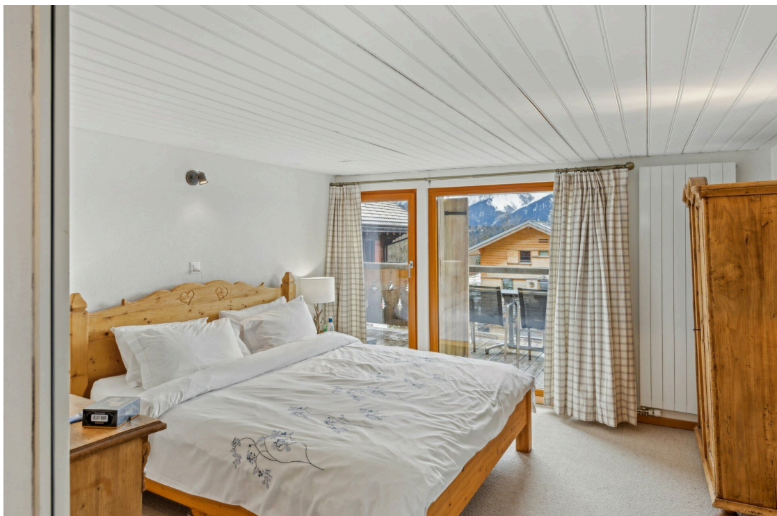
Master suite 1er étage