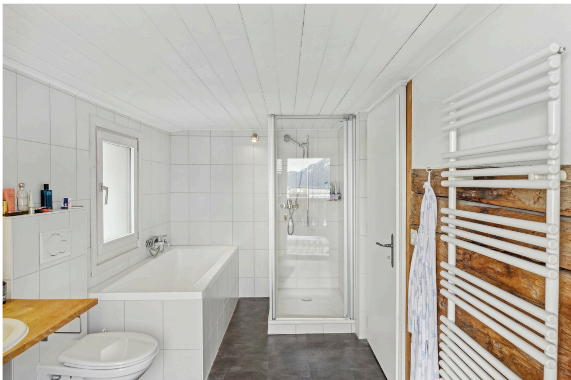
Salle de bain attenante 1