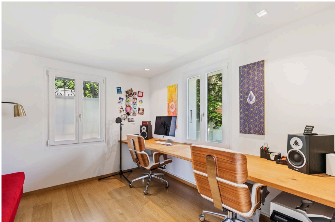
Bureau / Chambre