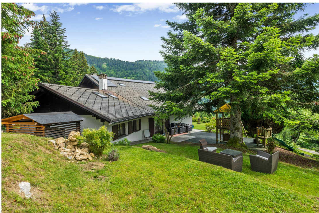
Jardin en terrasses