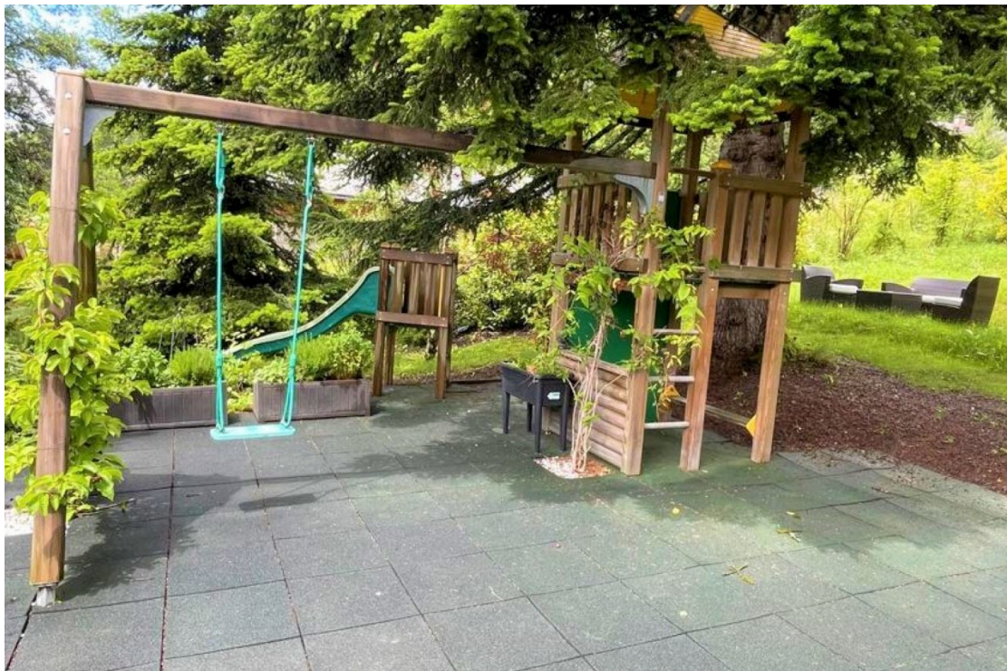
Air de jeux