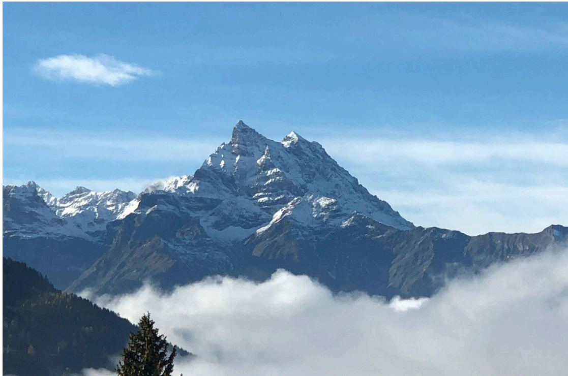
Dents du Midi