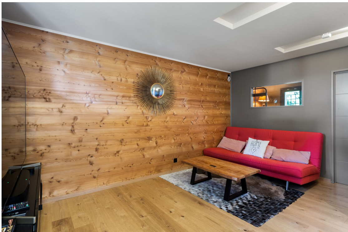
Salle de cinéma