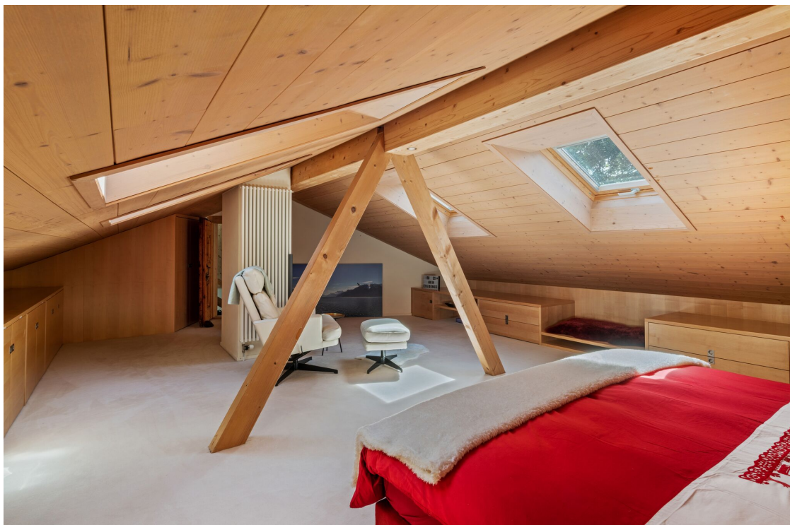
Chambre sous combles