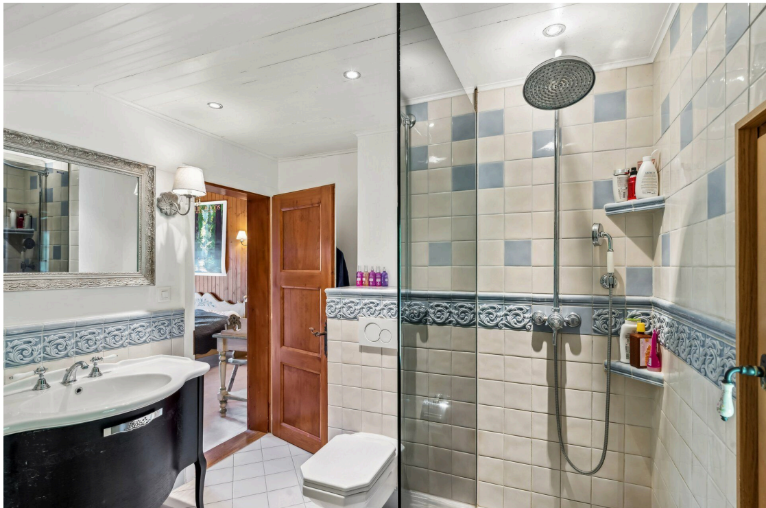
Salle de douche chambre 1