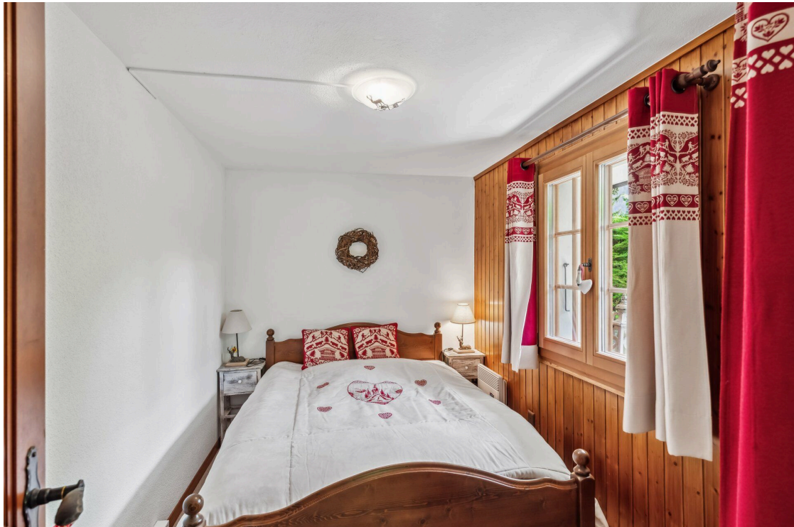
Chambre appartement rez inférieur