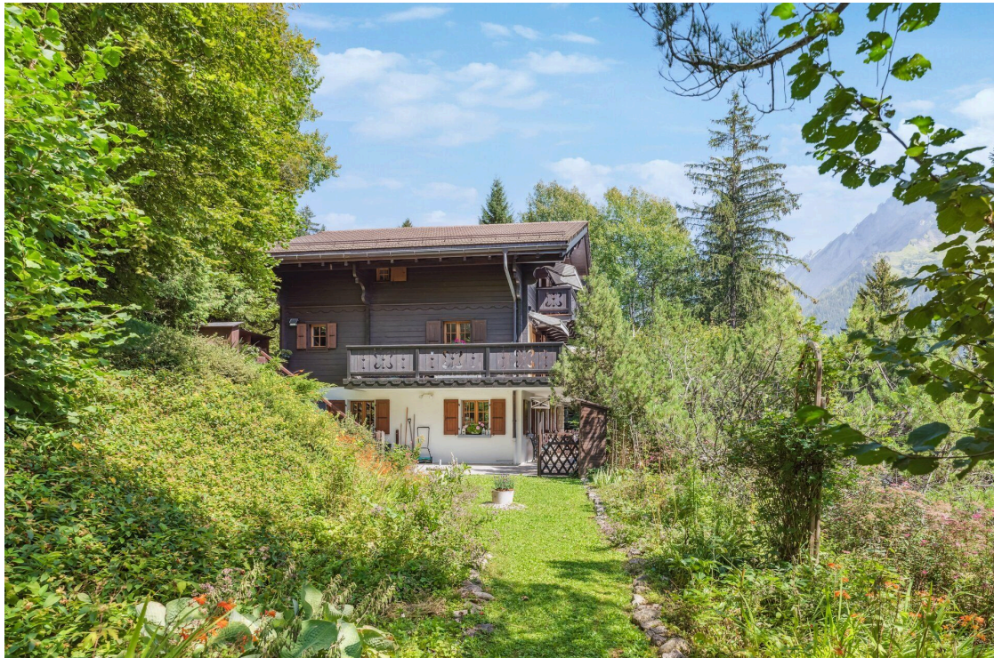
Jardin et chalet