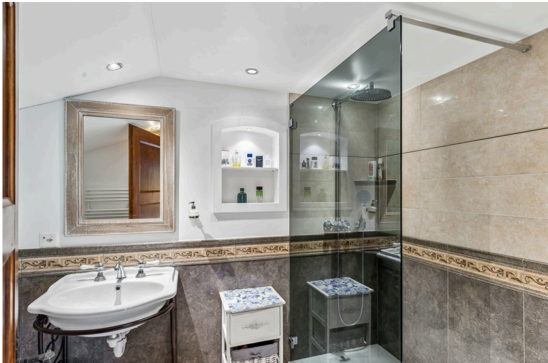
Salle de douche Chambre 2