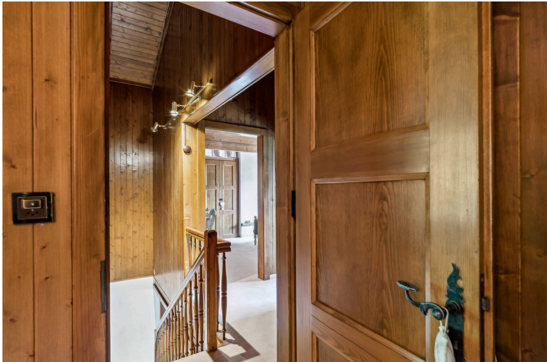
Palier 1er étage