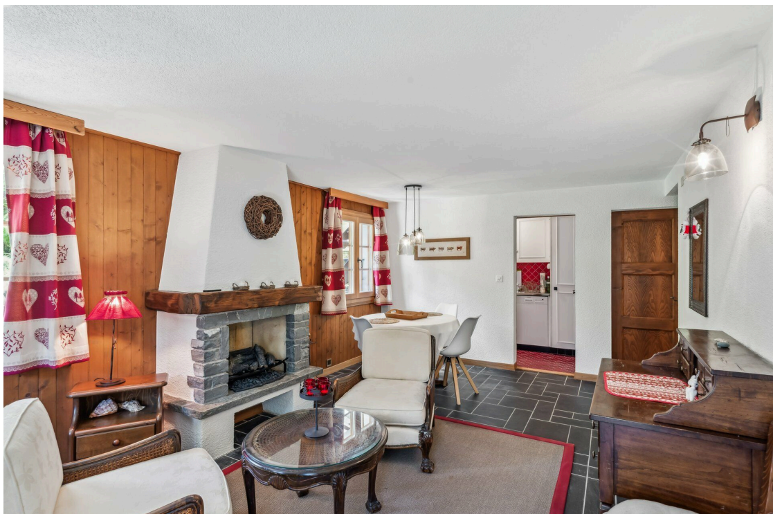
Salon appartement rez inférieur