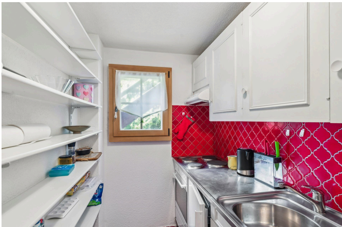
Cuisine appartement rez inférieur