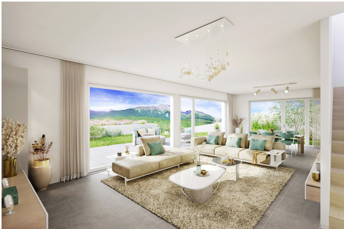
Pièce de vie