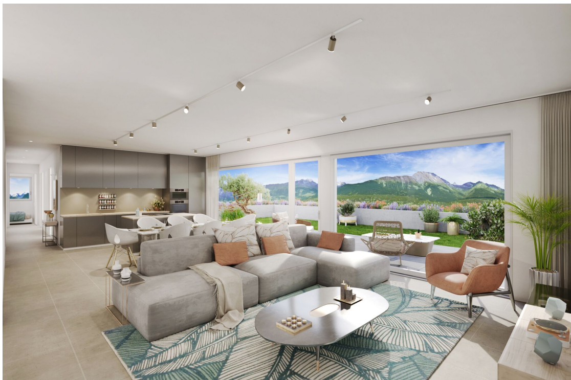
Pièce de vie