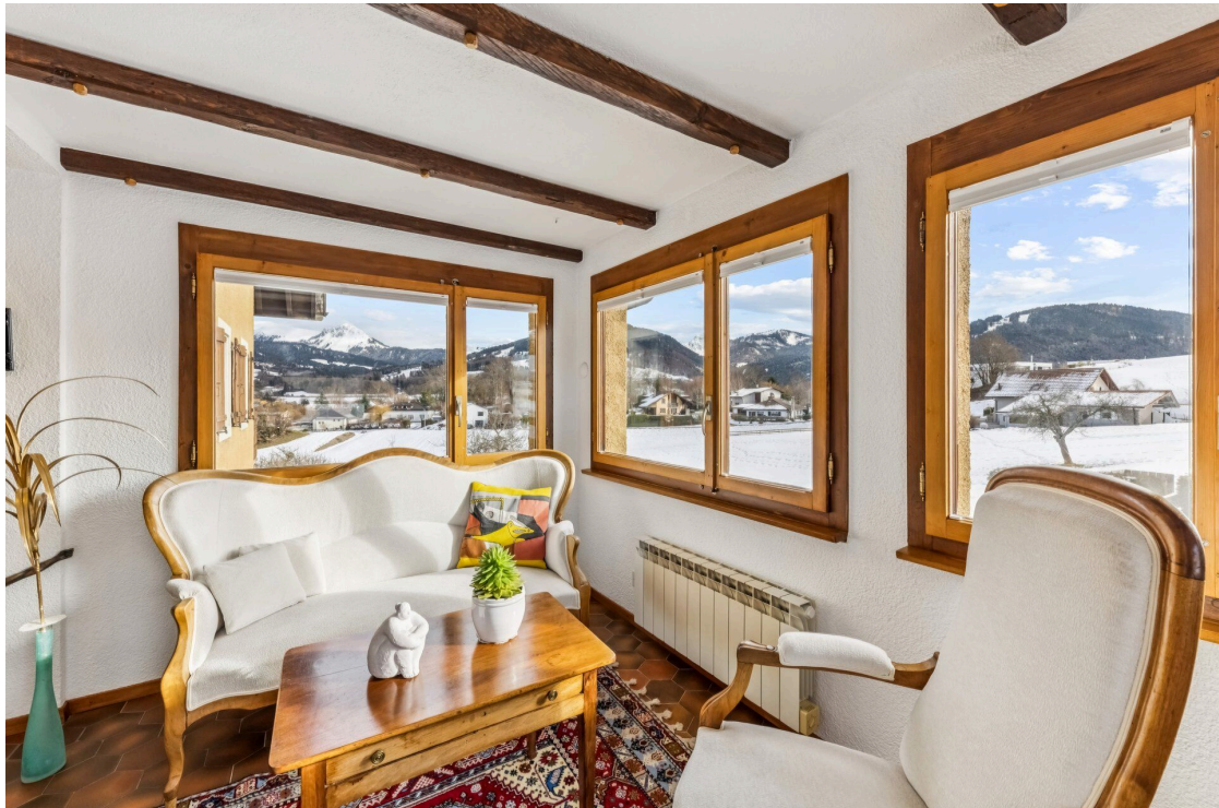
7,5p - entrée