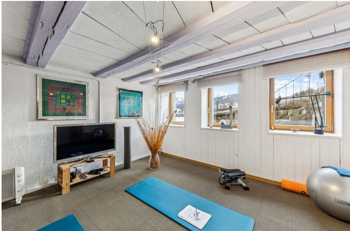
Salle de sport