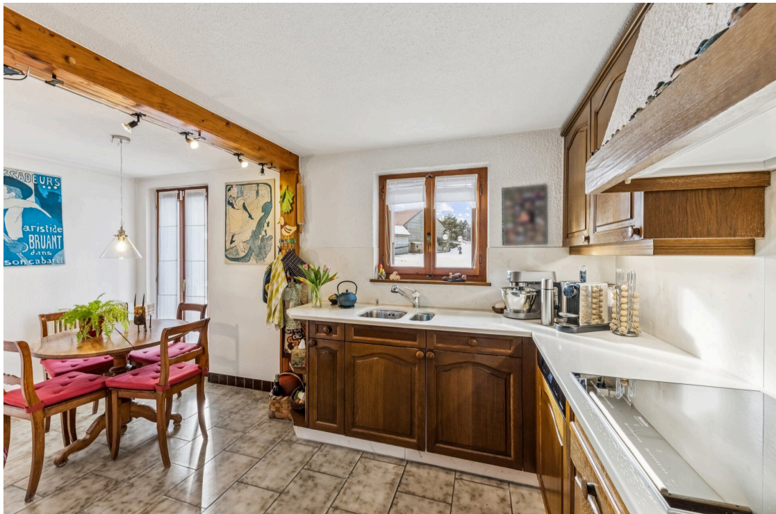
7,5p - cuisine