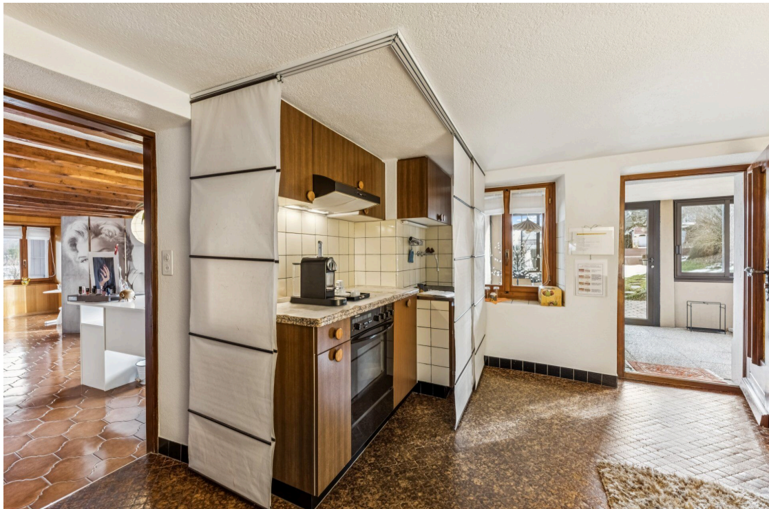
2,5p - cuisine