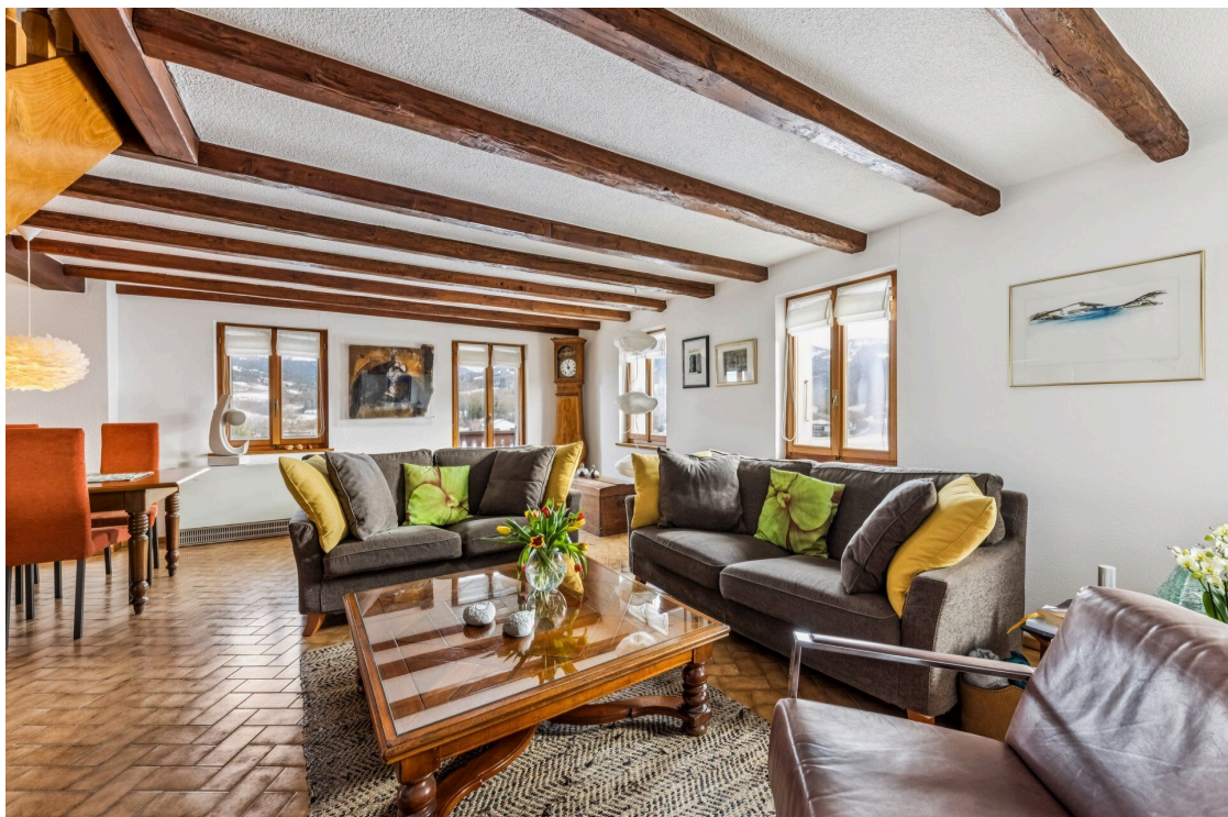
7,5p - séjour