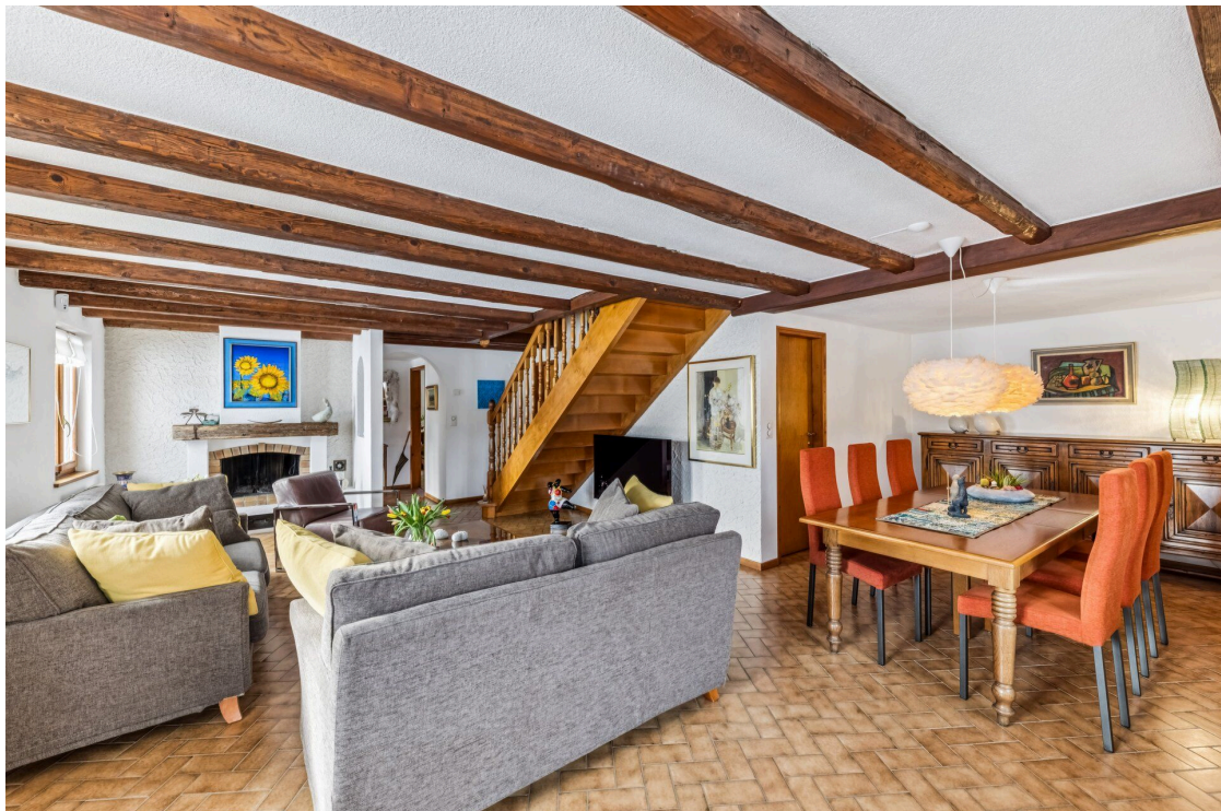
7,5p - séjour