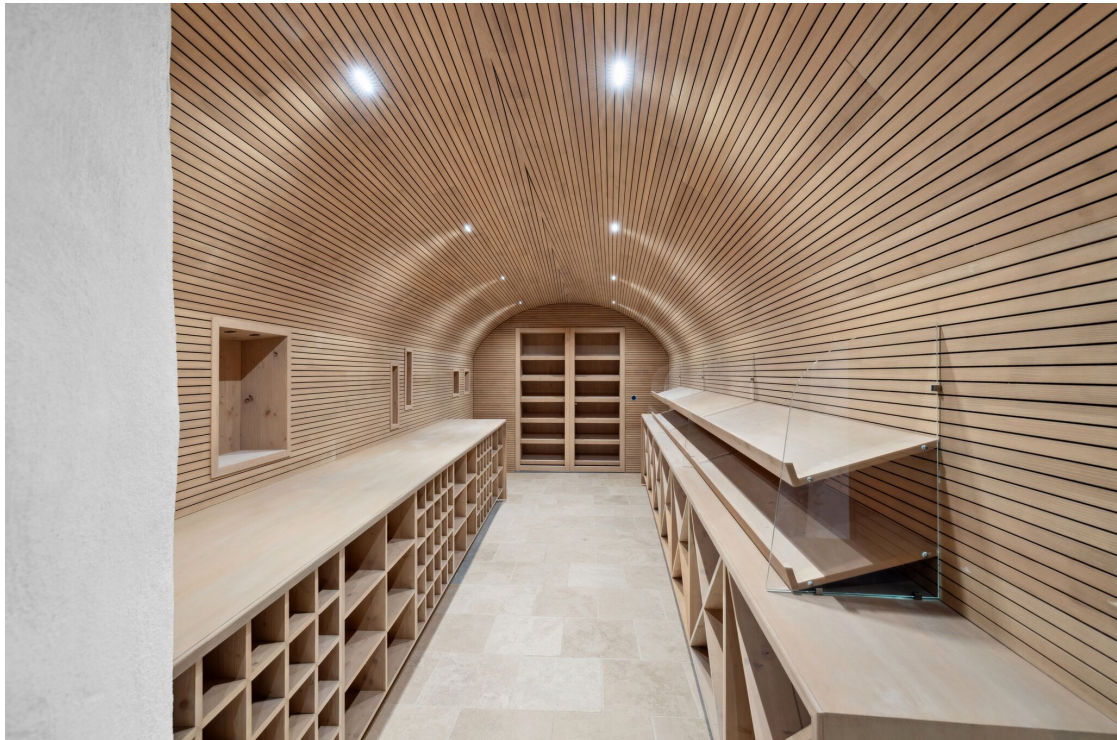
Cave à vin