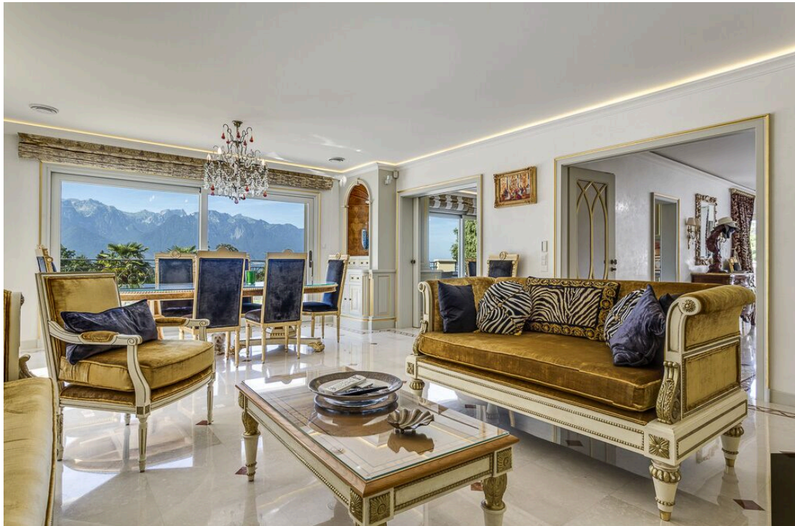
Séjour et espace à manger