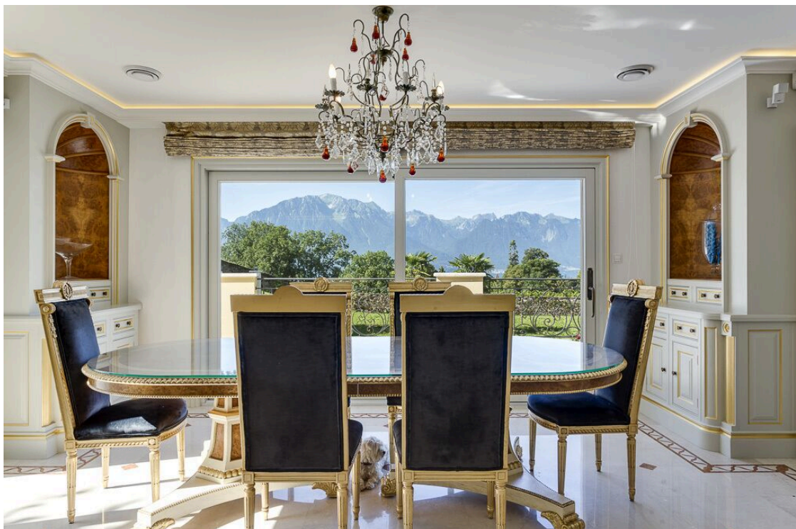
Espace à manger