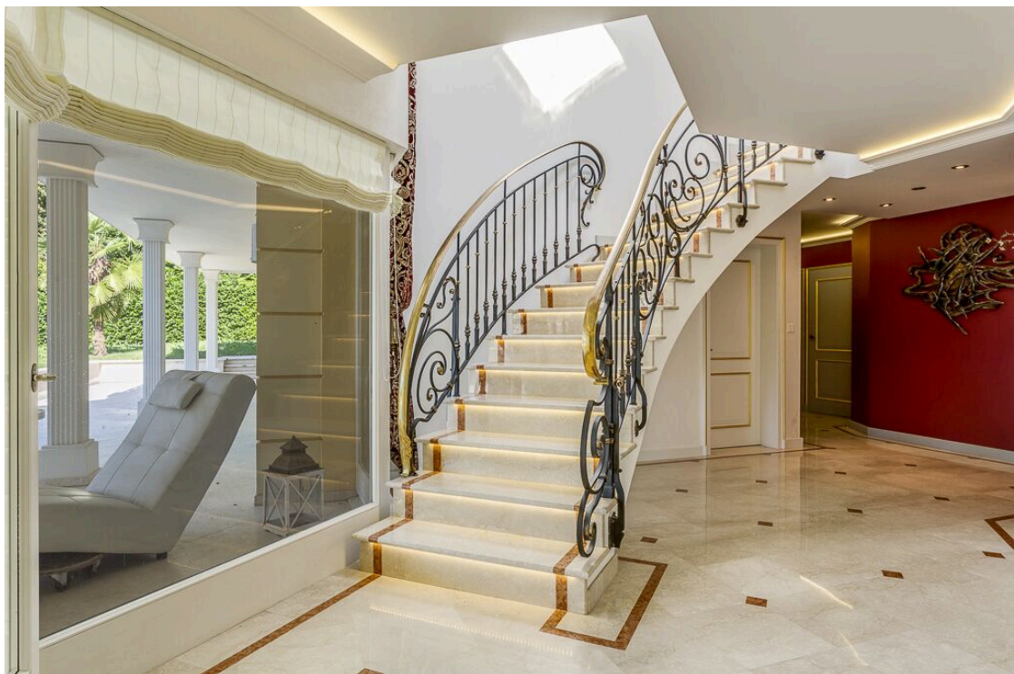
Escalier en marbre