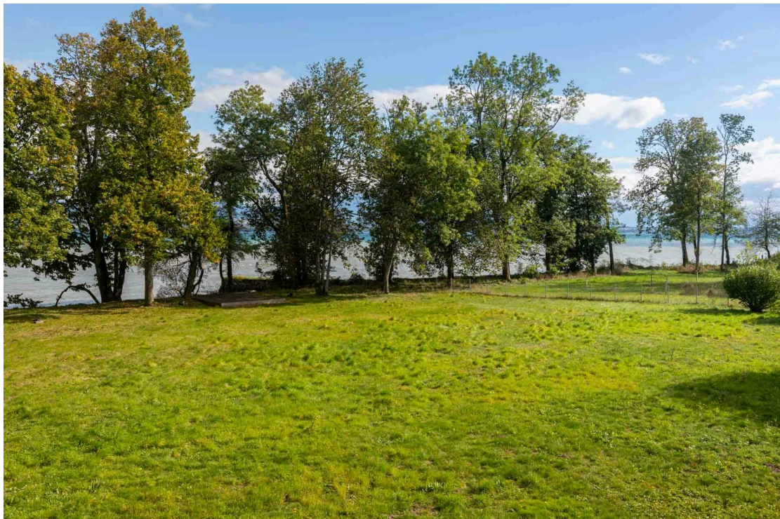
Vue depuis l'étage