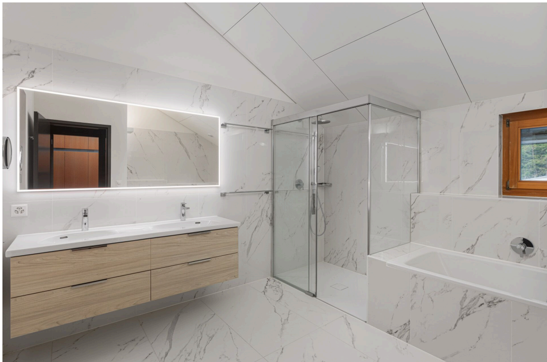
Salle de bains en suite