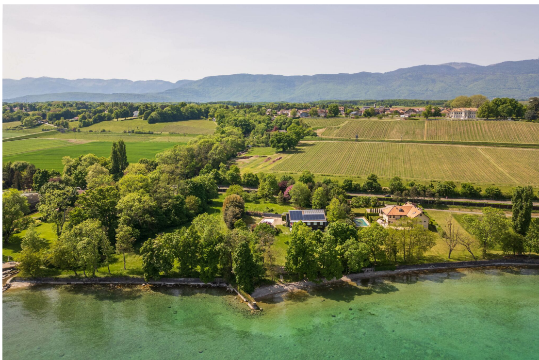
Propriété pied dans l'eau