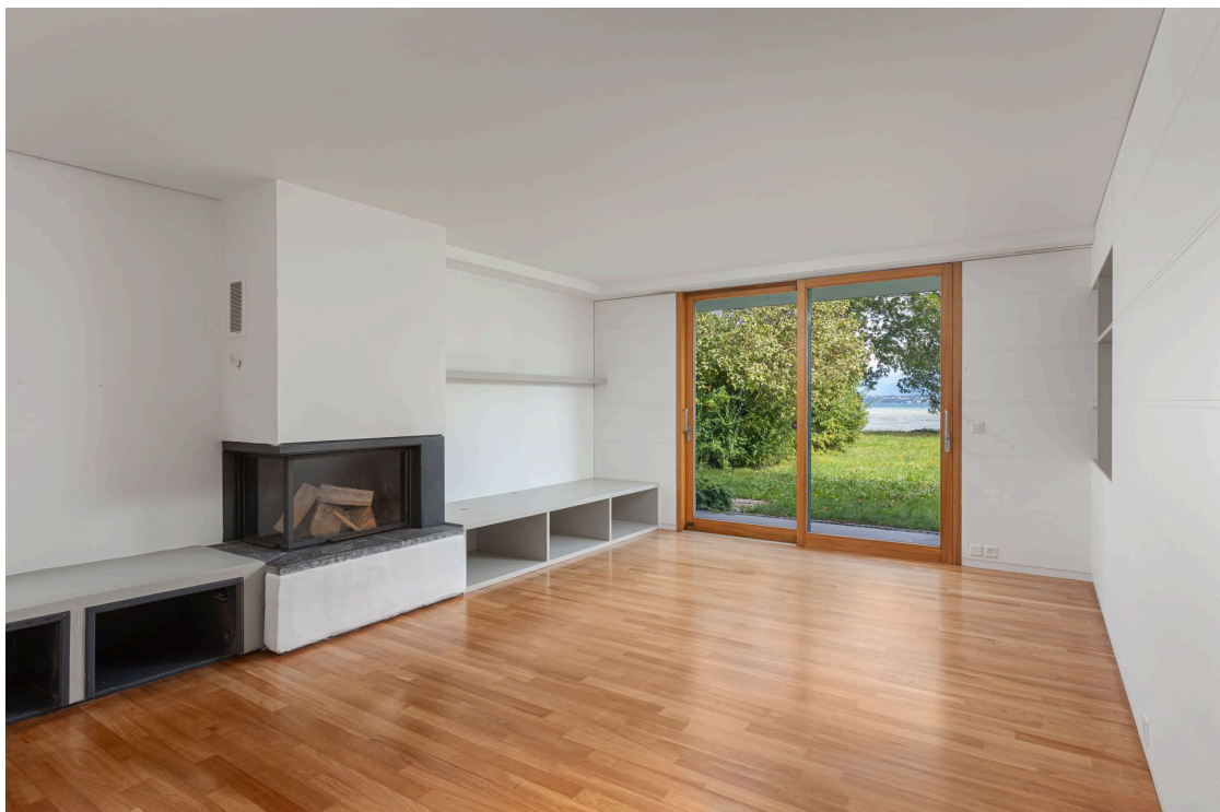
Salon avec cheminée et accès terrasse