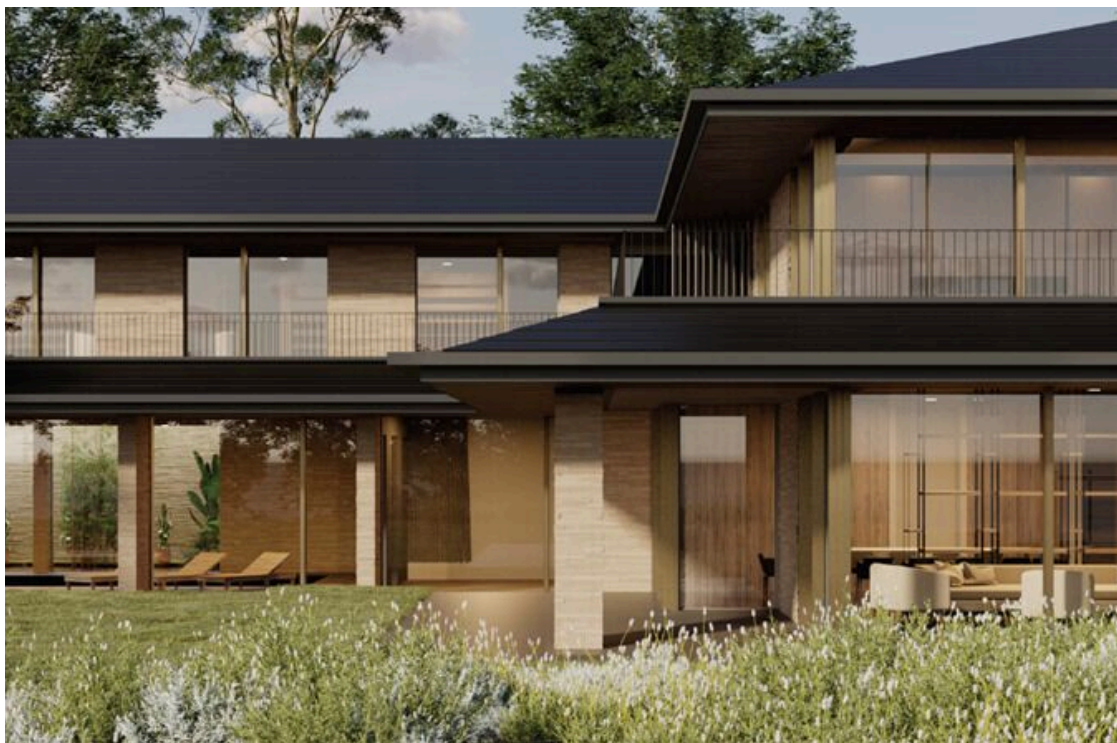
Projet - Image de synthèse