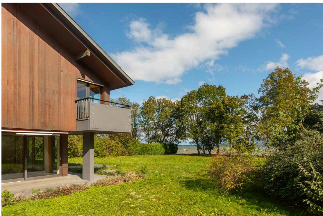
Terrain privatif pied dans l'eau