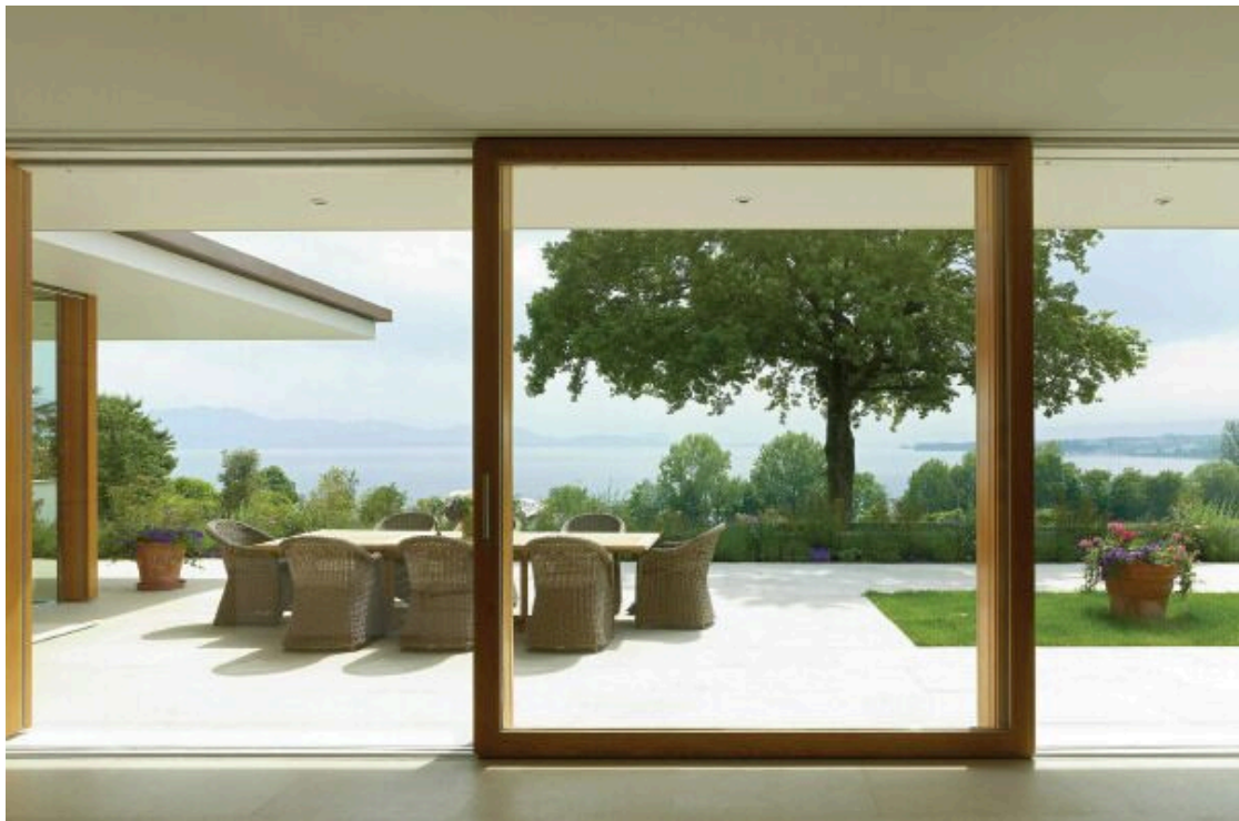
Salon - photo de synthèse