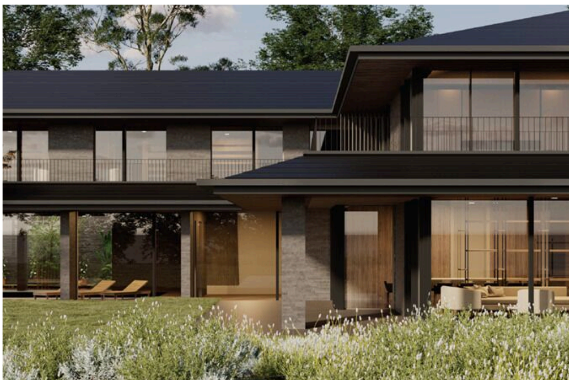
Projet - Image de synthèse