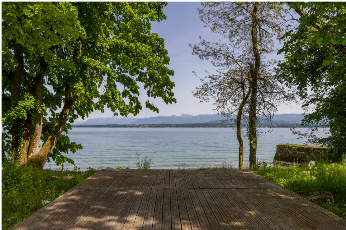
Terrasse pied dans l'eau