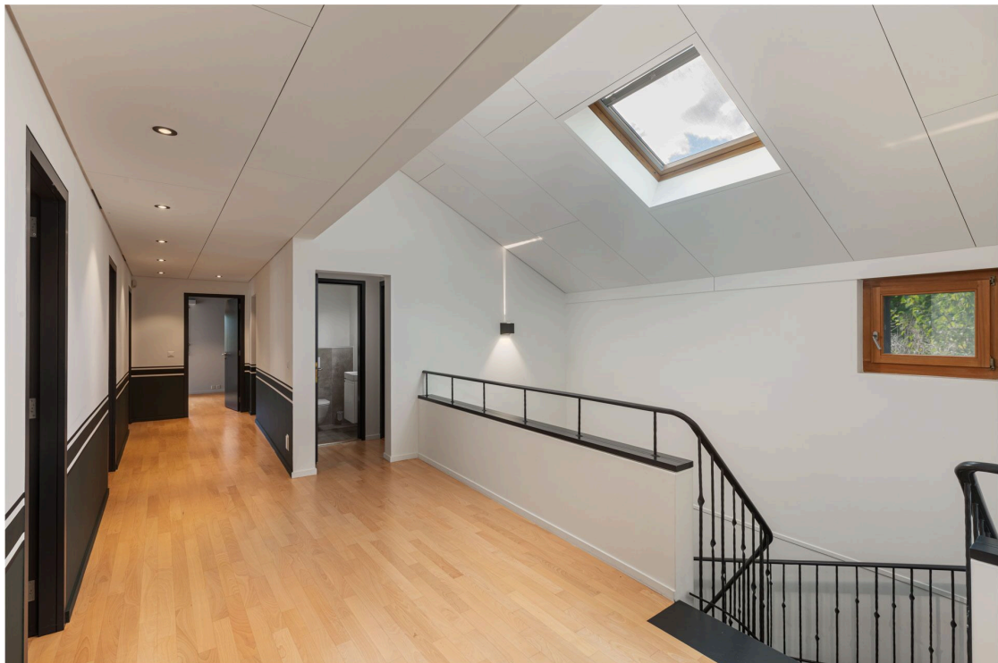
Couloir de distribution pour les chambres à coucher