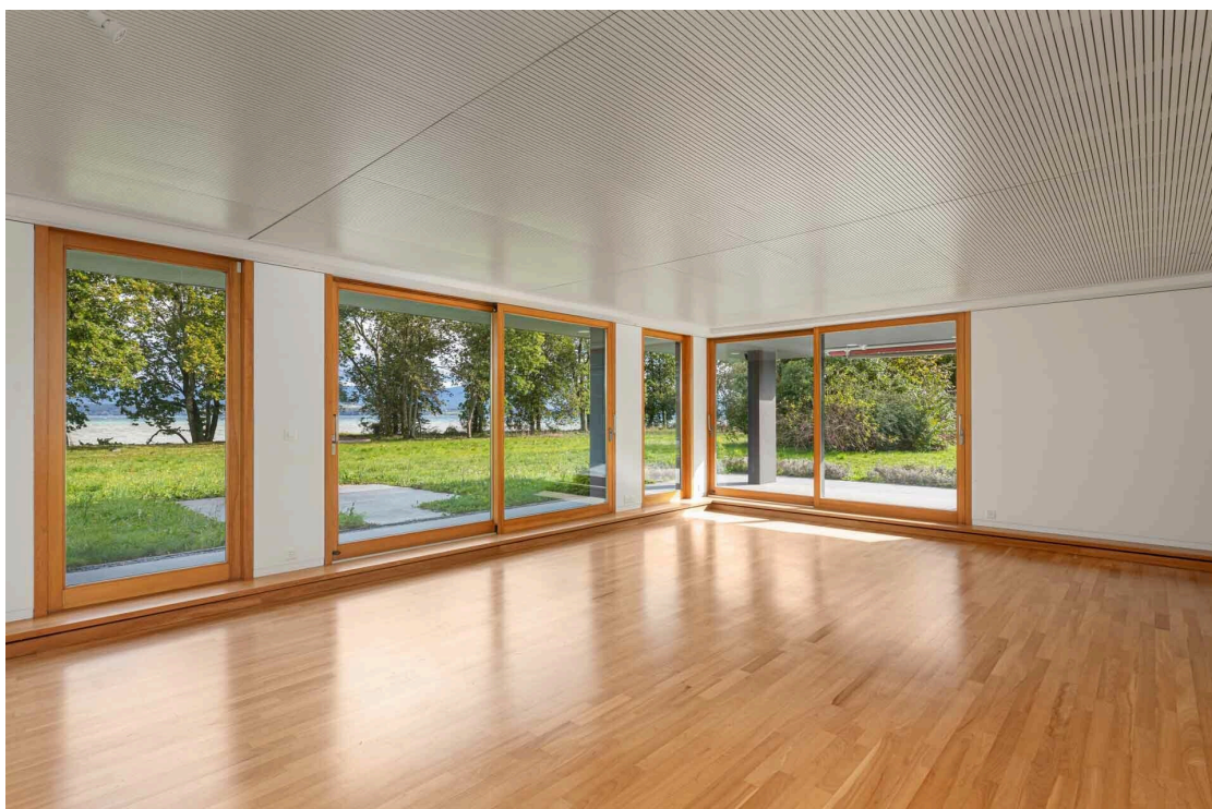
Salon avec vue lac et accès terrasse