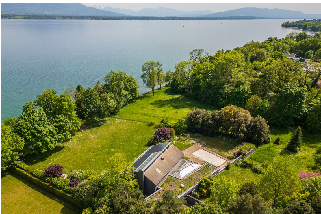
Vue aérienne - lac