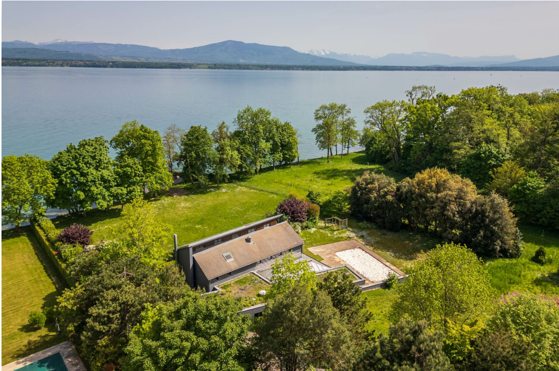
Vue aérienne de la propriété