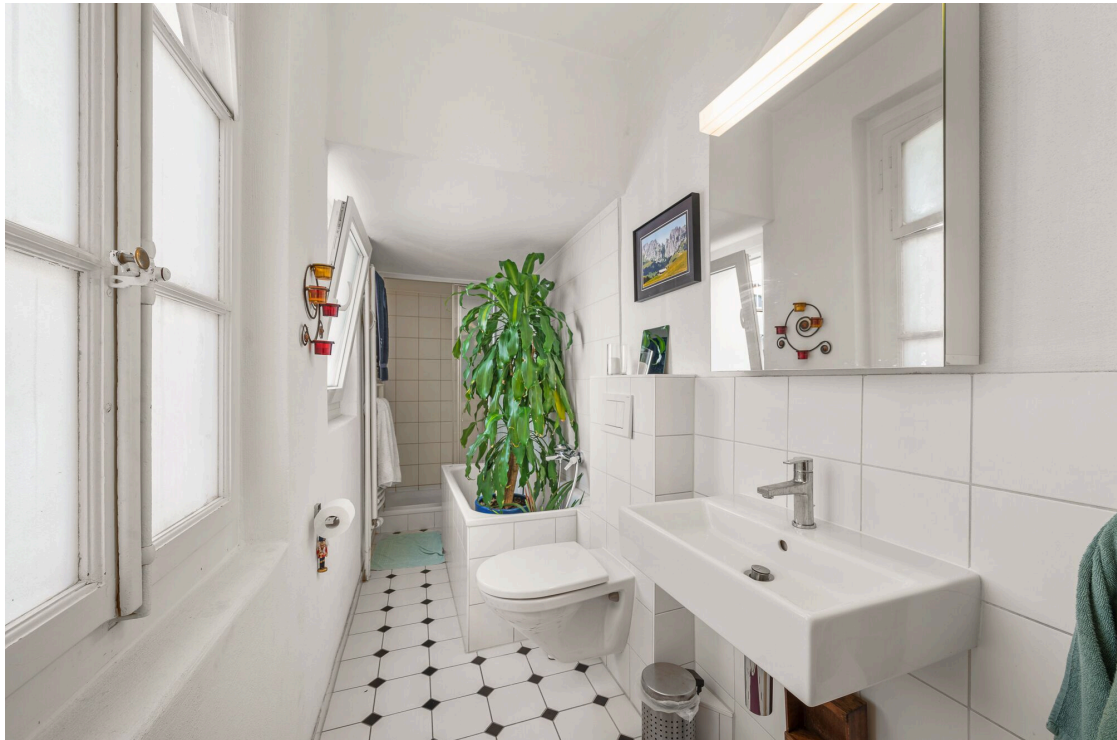
Salle de douche et bains