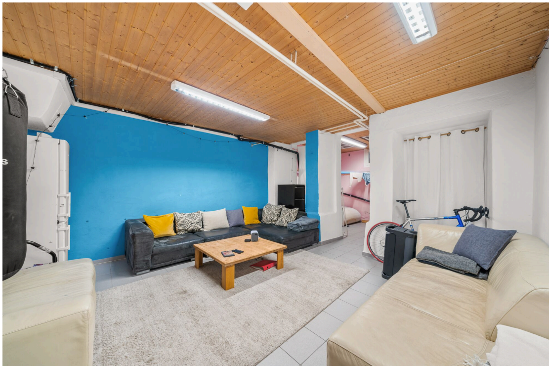
Disponible et buanderie