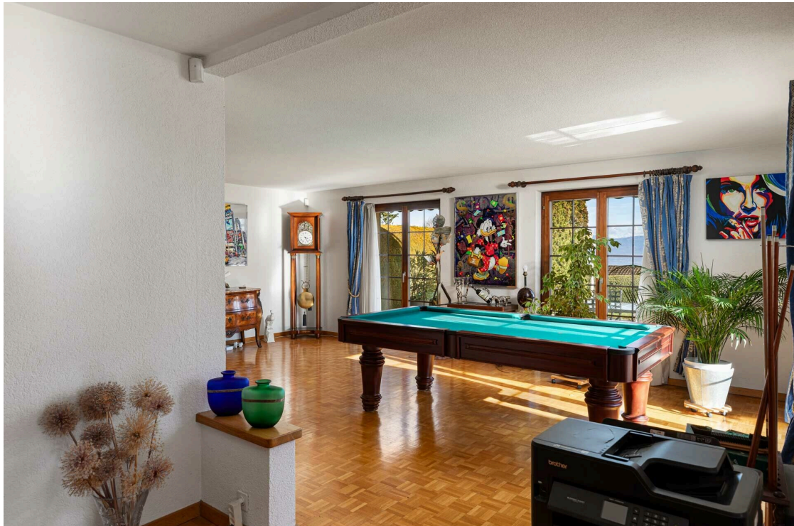
Salle de billard pouvant servir de salle à manger