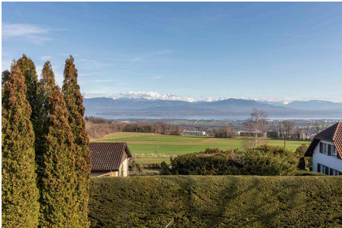
Vue sur le lac