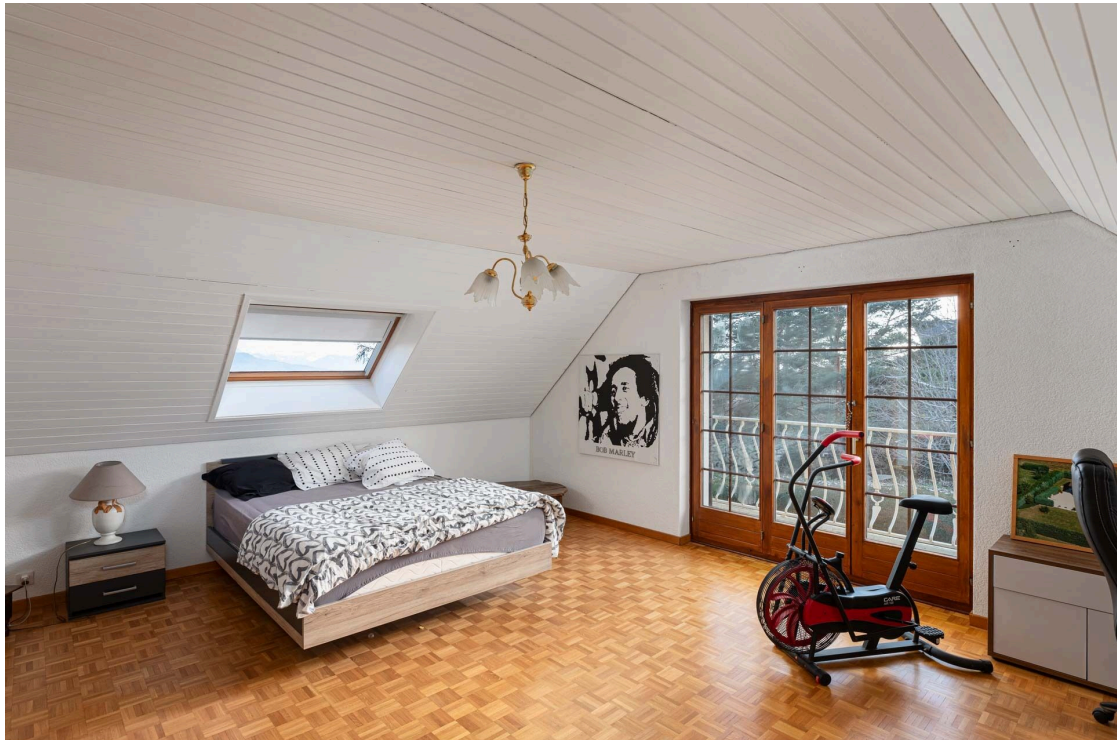
Chambre à coucher avec balcon et vue