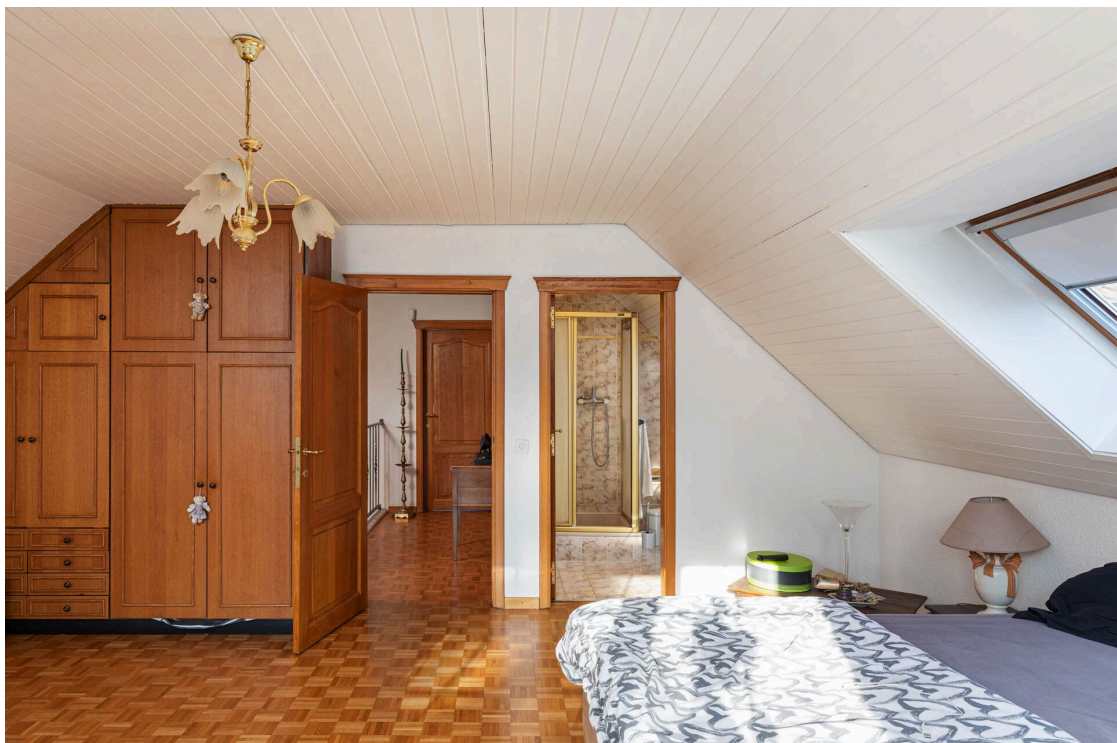
Chambre à coucher avec armoires et salle de douche en suite