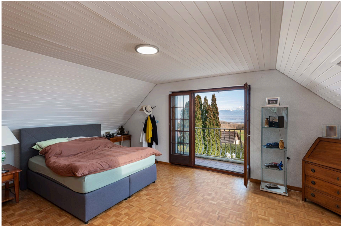
Chambre à coucher avec balcon et vue