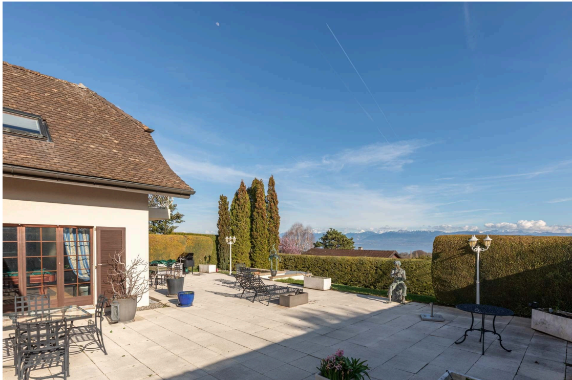
Terrasse avec vue panoramique