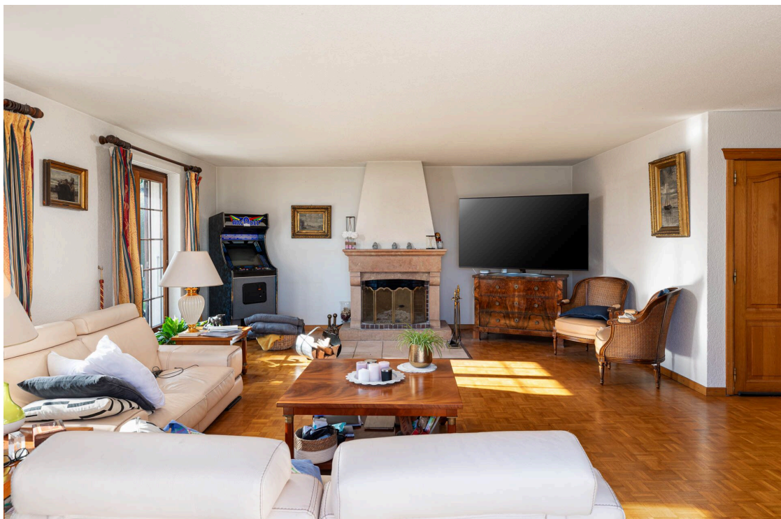
Salon avec cheminée