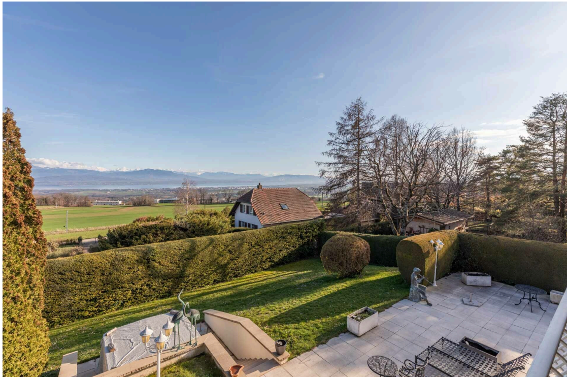
Jardin avec jacuzzi et vue