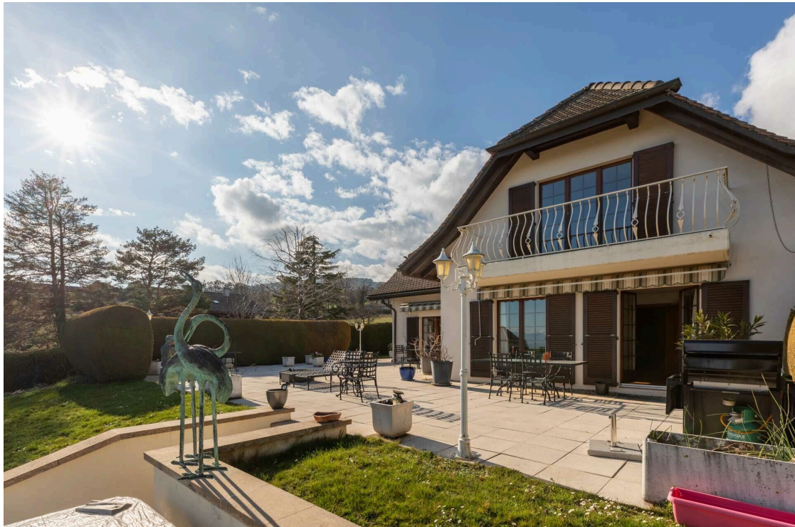
Terrasse bien exposée