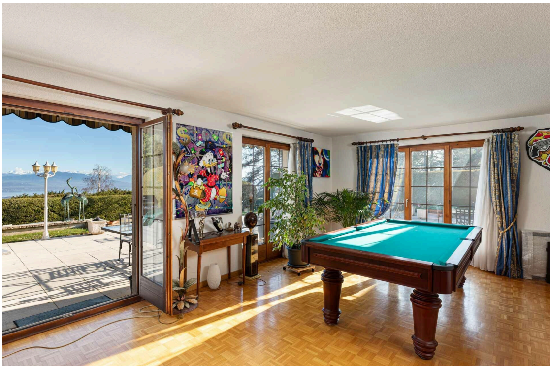
Accès vers la terrasse