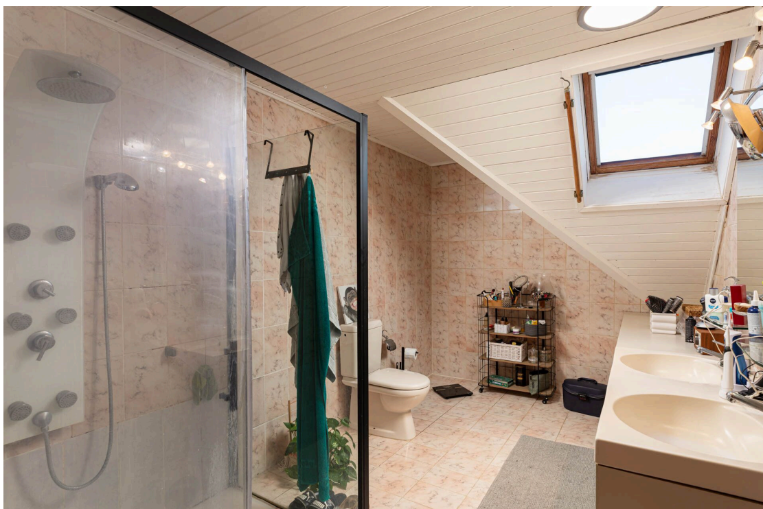
Salle de douche