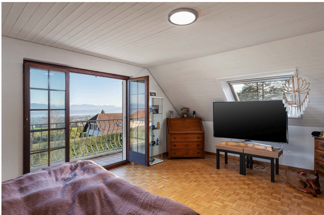
Chambre à coucher avec balcon et vue