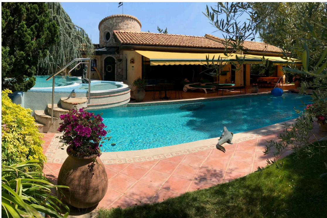
Pool-house, piscine et jacuzzi