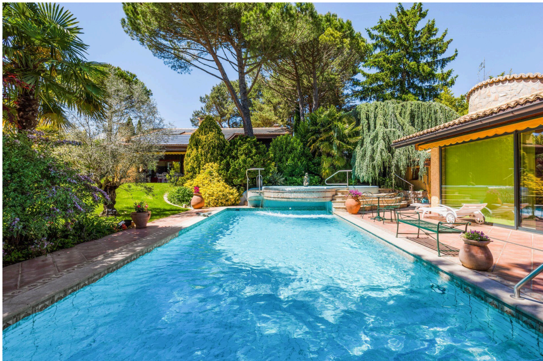
Pool-house, piscine et jacuzzi