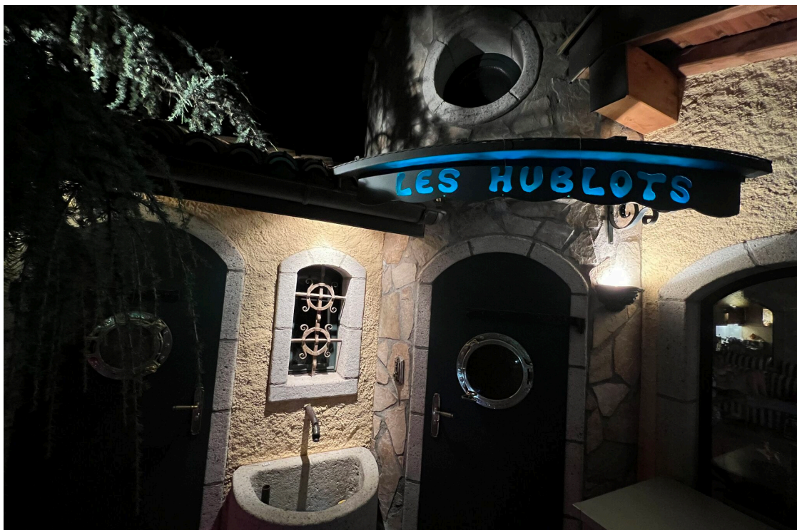
L'entrée du pool-house