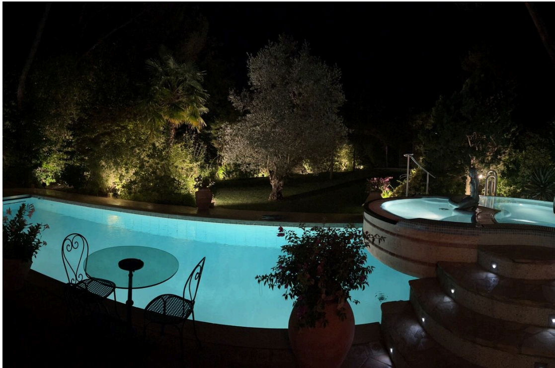
Piscine et jacuzzi