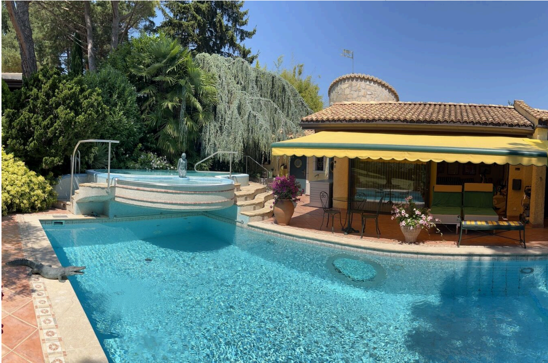
Pool-house, piscine et jacuzzi