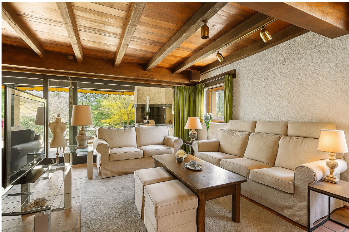
Salon TV avec bar et grande cheminée centrale ouverte - home staging