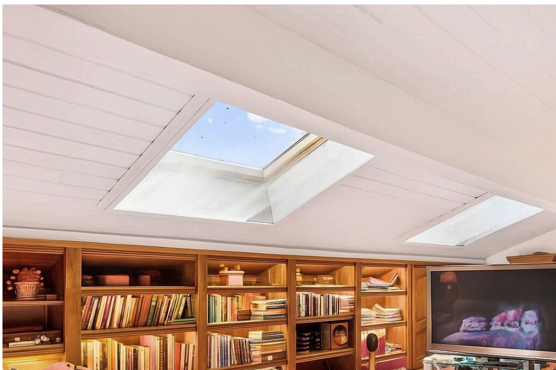
Grand bureau avec large bibliothèque, coin TV et système sono - home staging