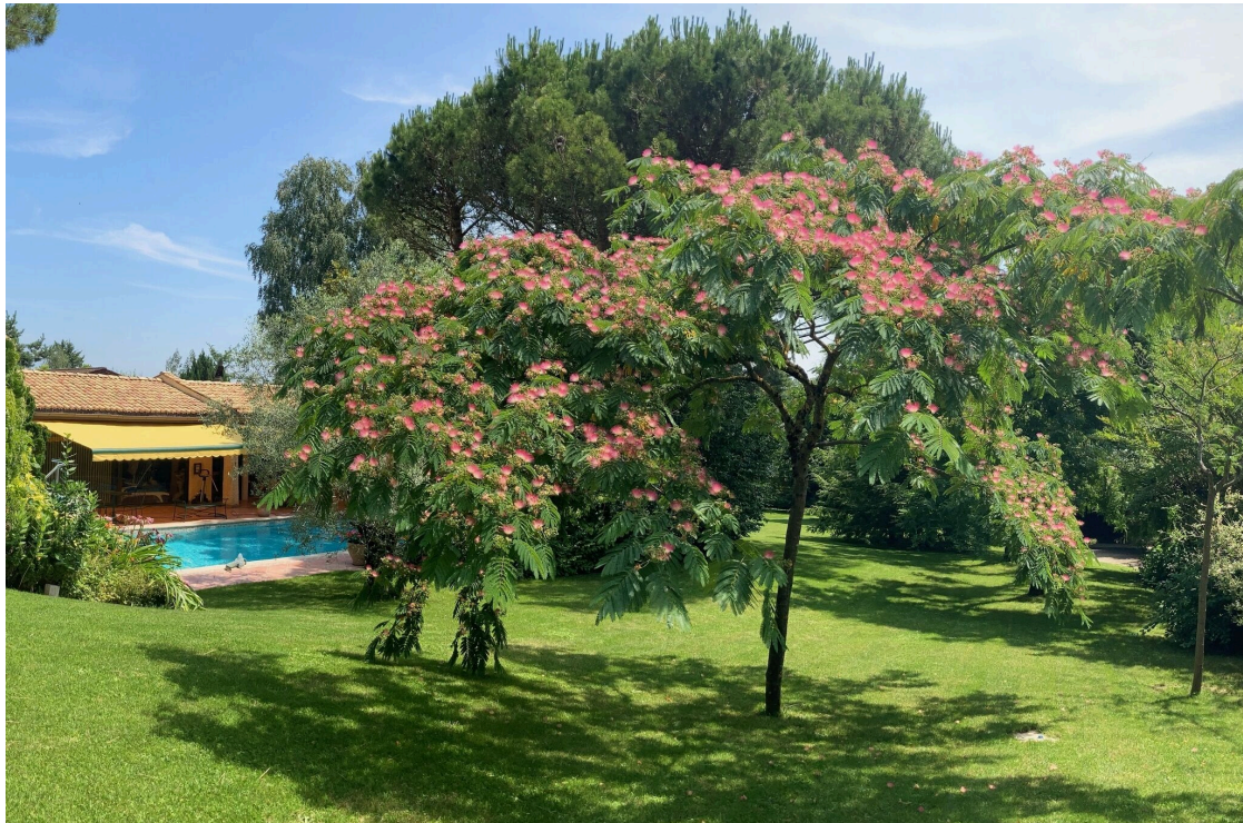
Albizia en fleur