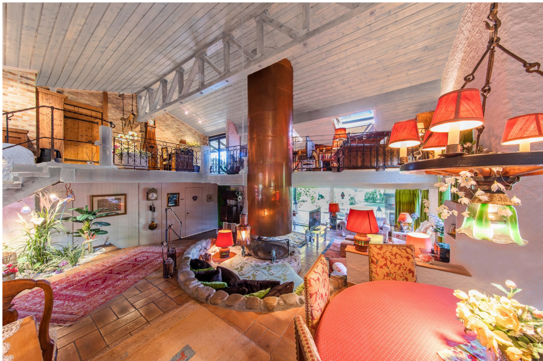
Rez-de-chaussée, partie plan ouvert - home staging