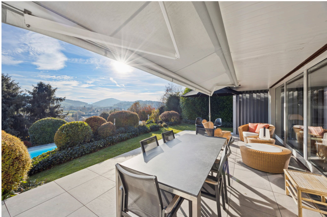
Terrasse avec magnifique vue dégagée