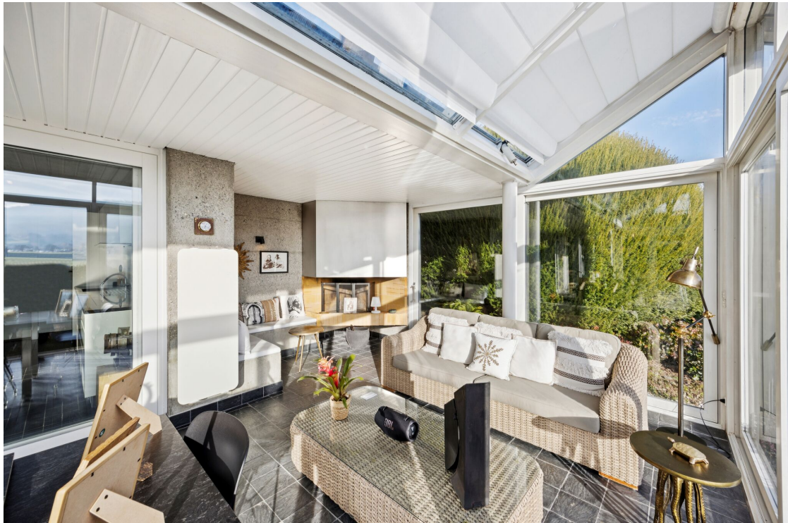
Spacieuse véranda avec cheminée