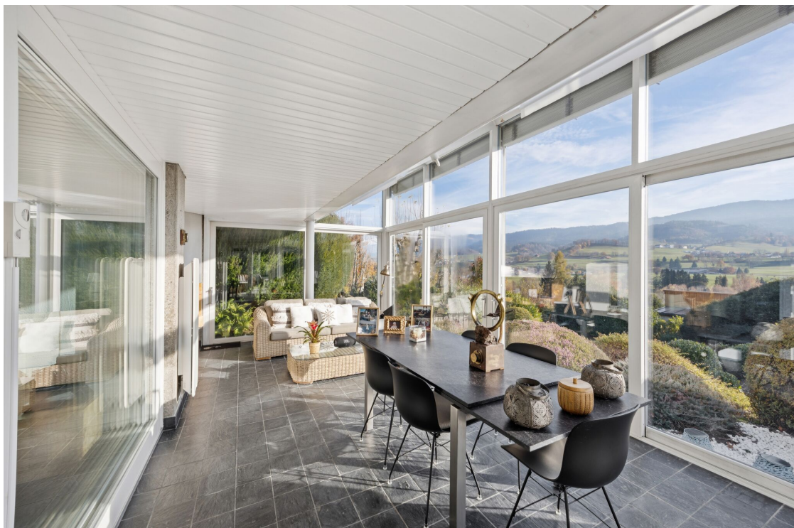
Spacieuse véranda avec cheminée