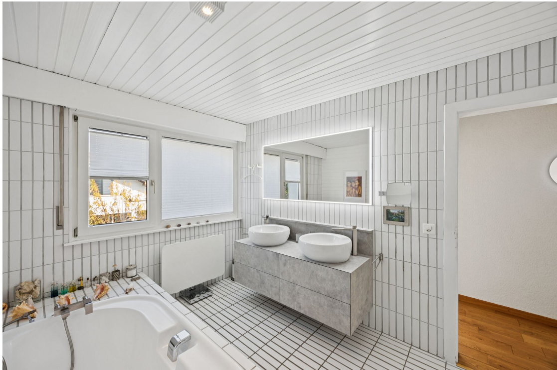
Salle de bains avec baignoire, douche et sauna