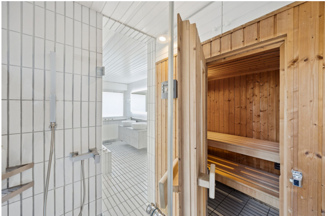
Sauna et douche