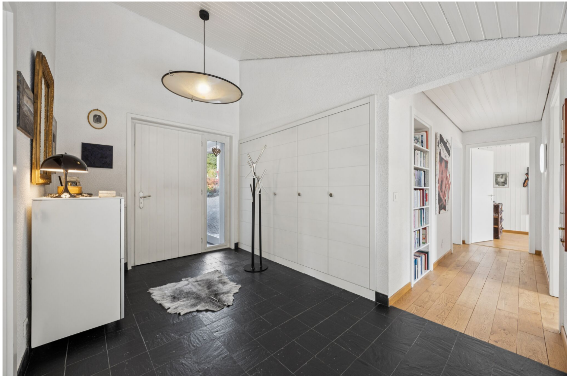
Spacieux hall d'entrée lumineux avec armoires murales