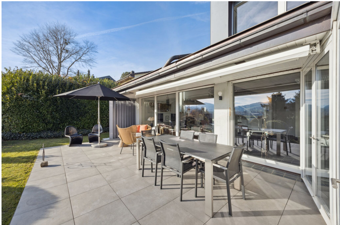
Terrasse avec magnifique vue dégagée