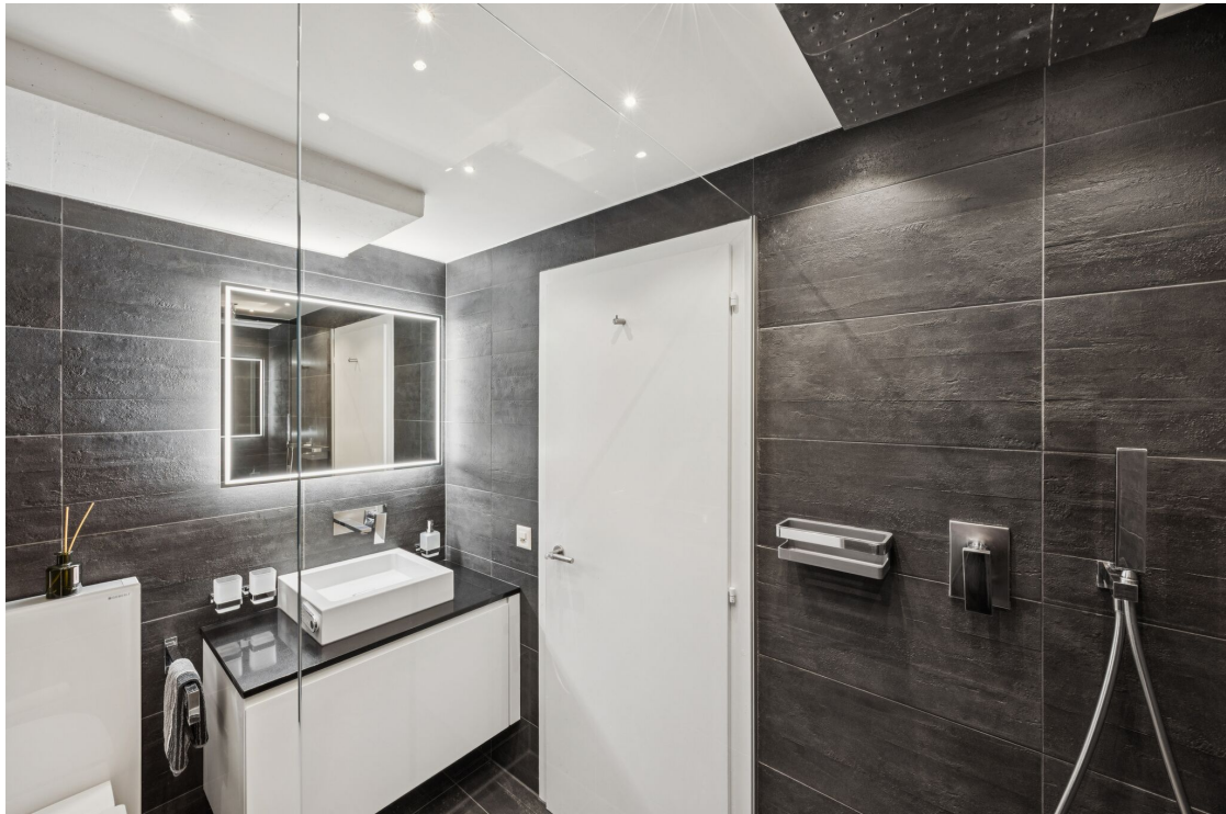
Salle de douche