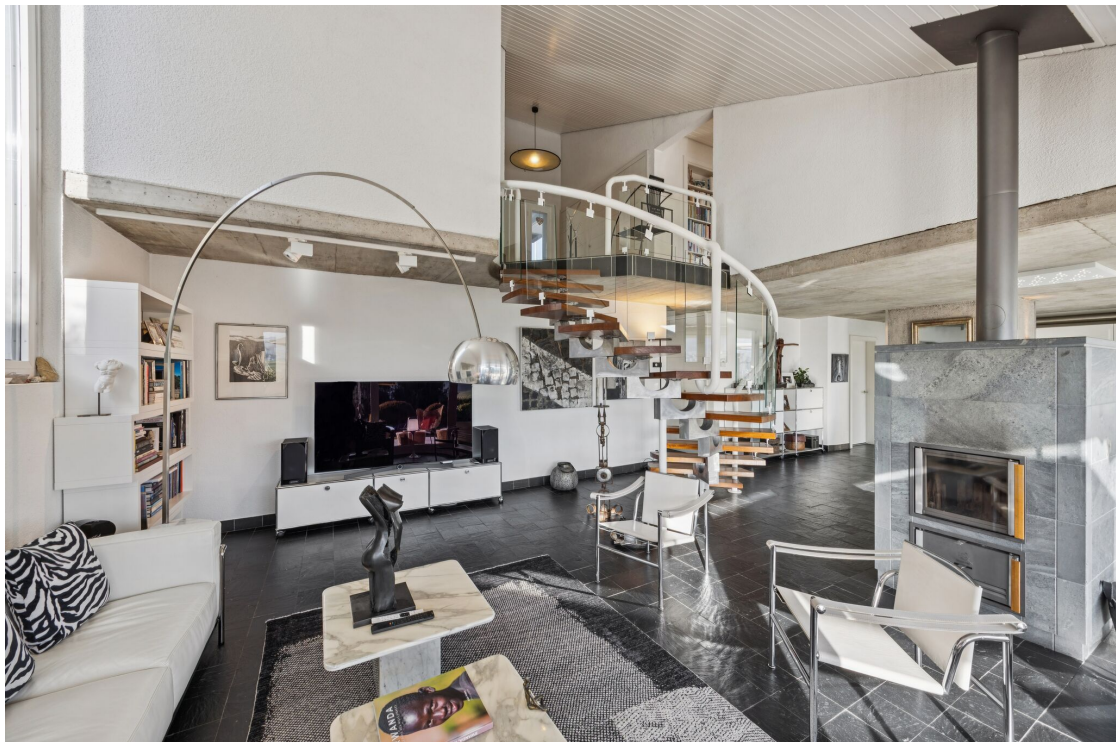
Spacieux séjour avec belle hauteur sous plafond et poêle