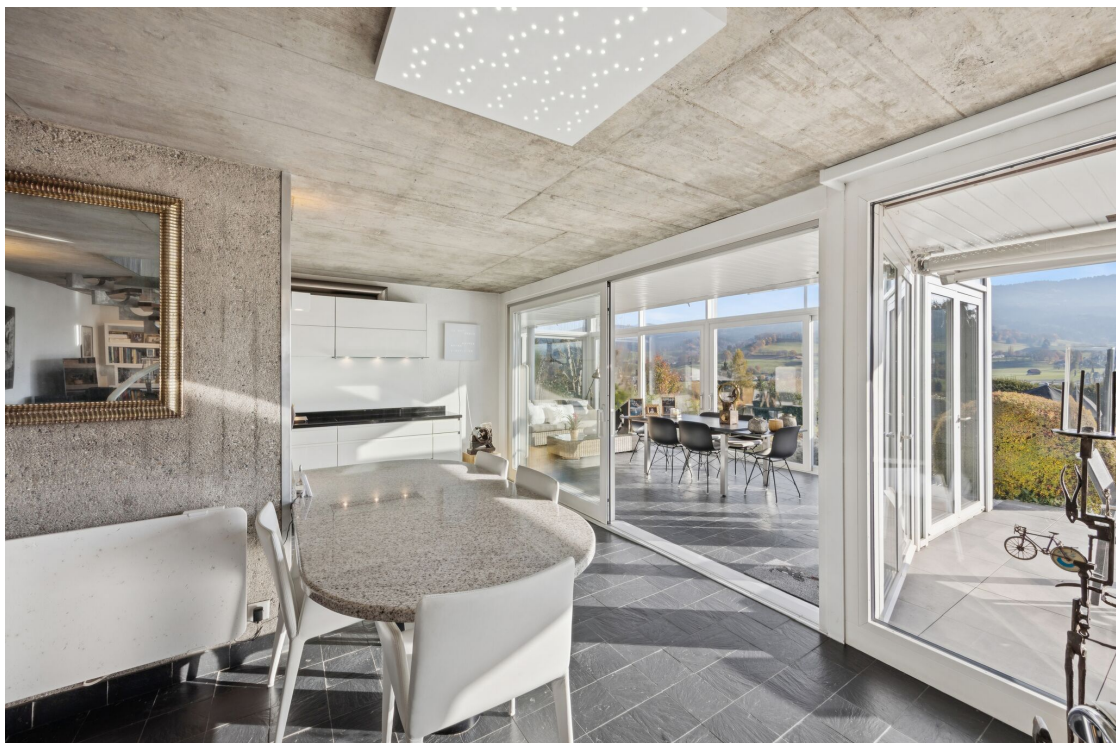
Salle à manger donnant sur la véranda