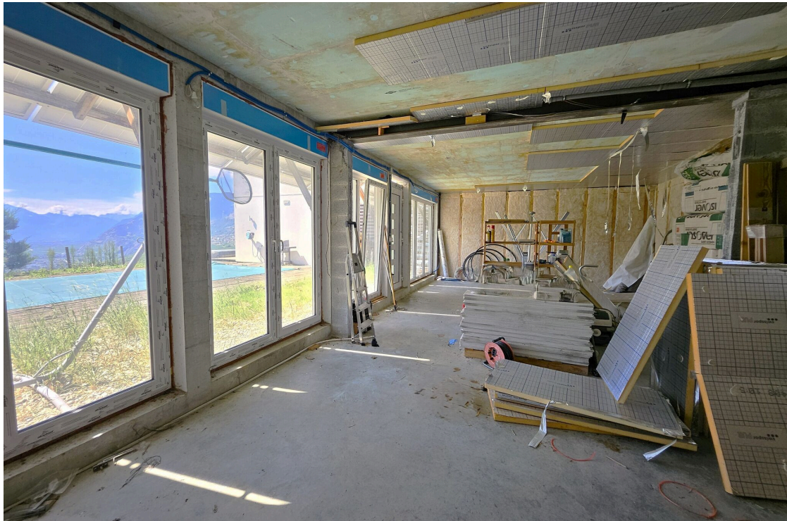
Local avec travaux à finir