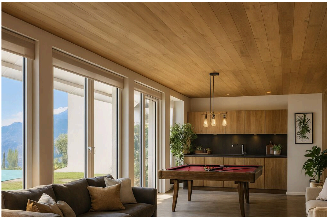
Photo retouchée IA après travaux