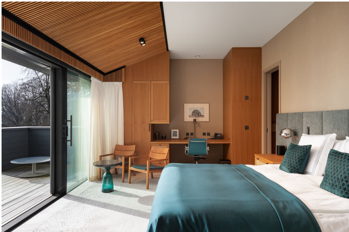
Chambre principale en suite