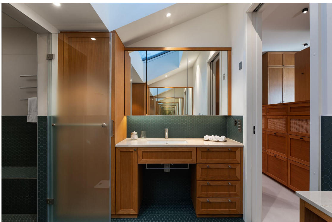
Salle de bains de la chambre principale