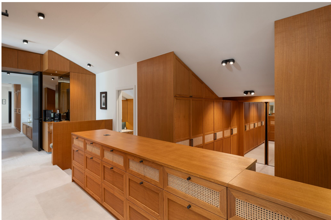
Dressing de la chambre principale