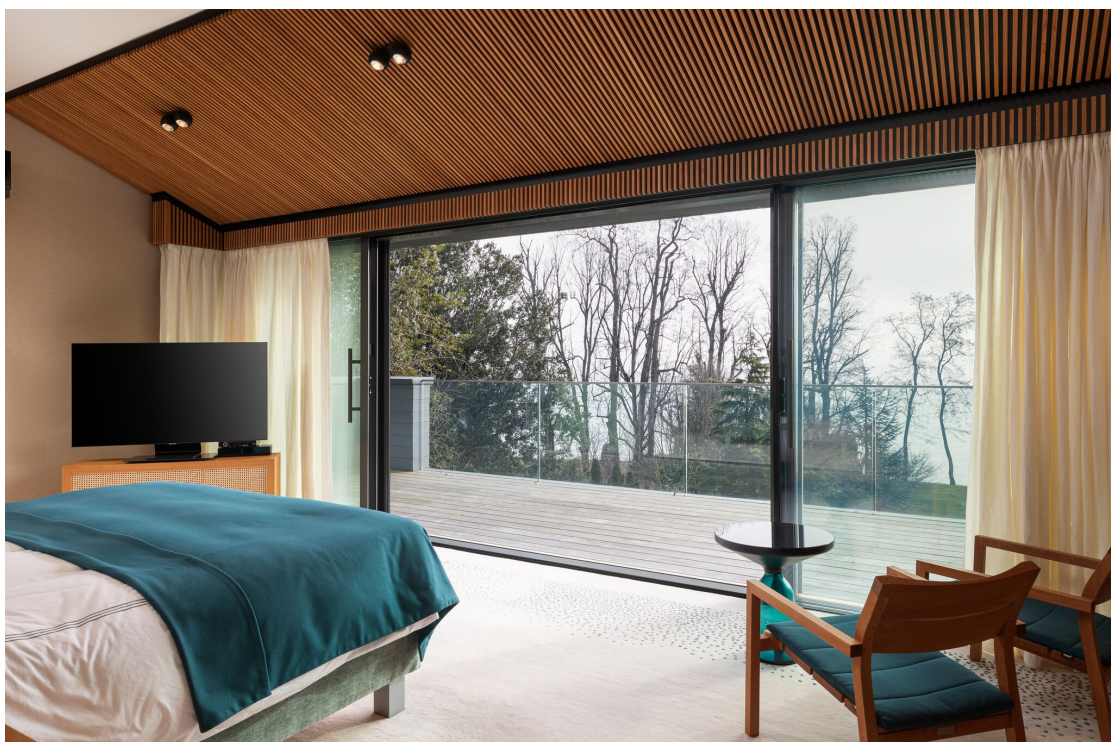
Chambre principale en suite