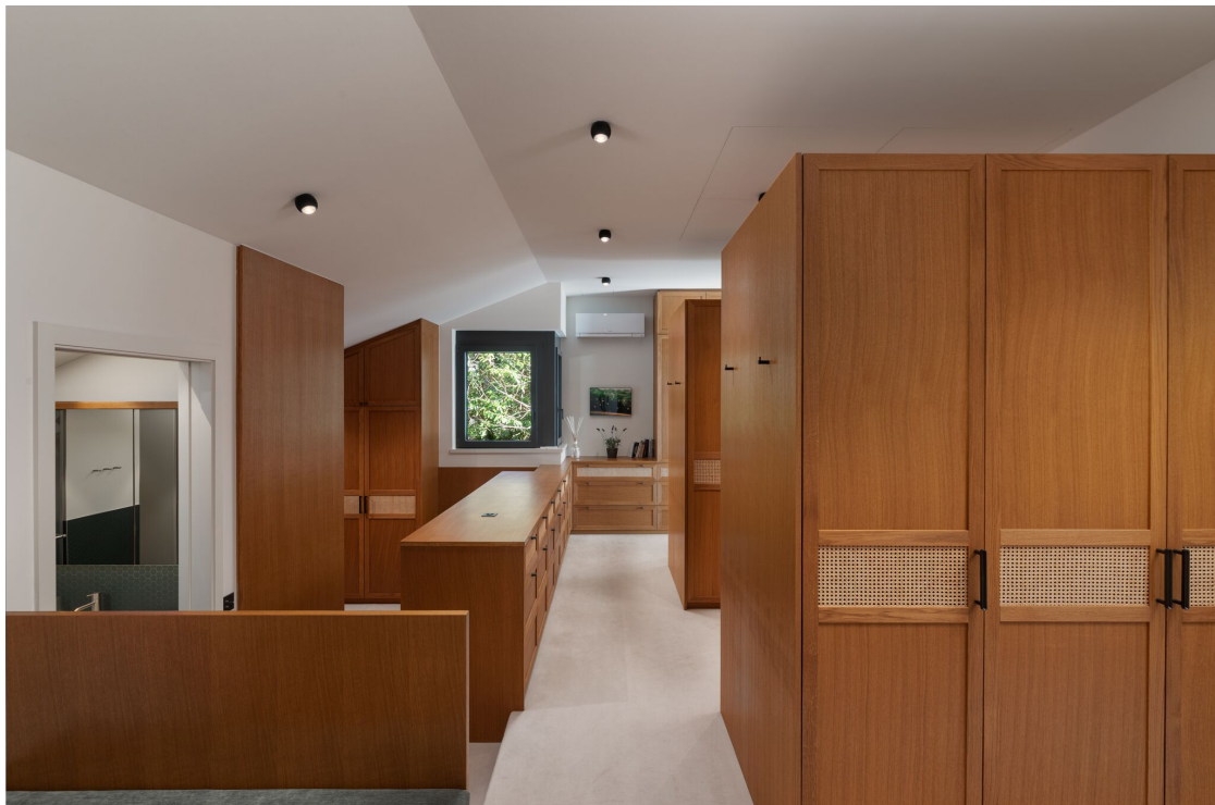
Dressing de la chambre principale