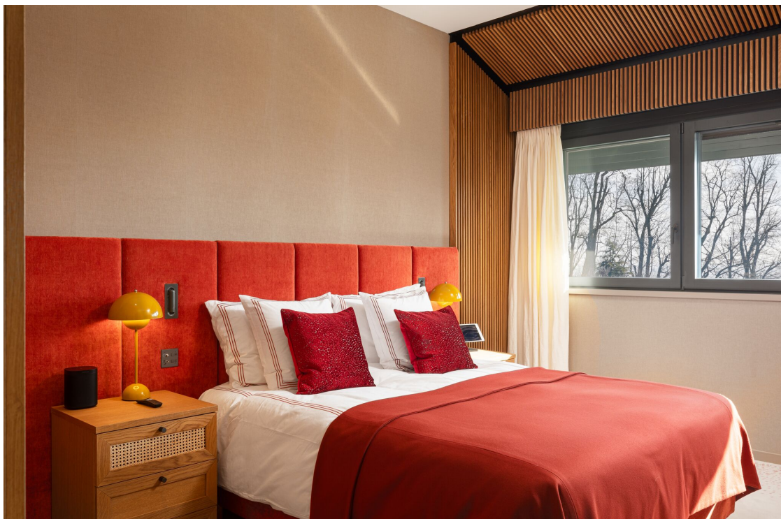
Chambre à coucher en suite