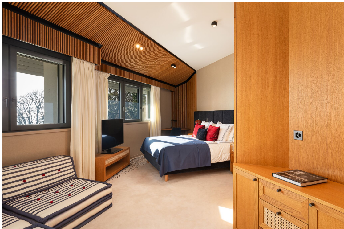
Chambre à coucher en suite