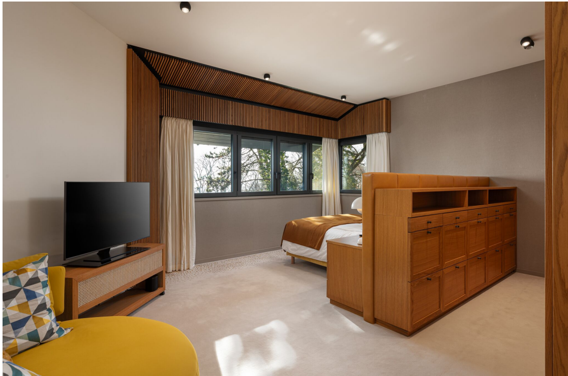
Chambre à coucher en suite