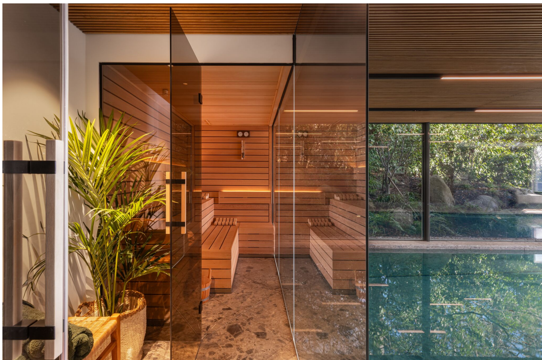
Sauna/Hammam avec douche et piscine intérieure