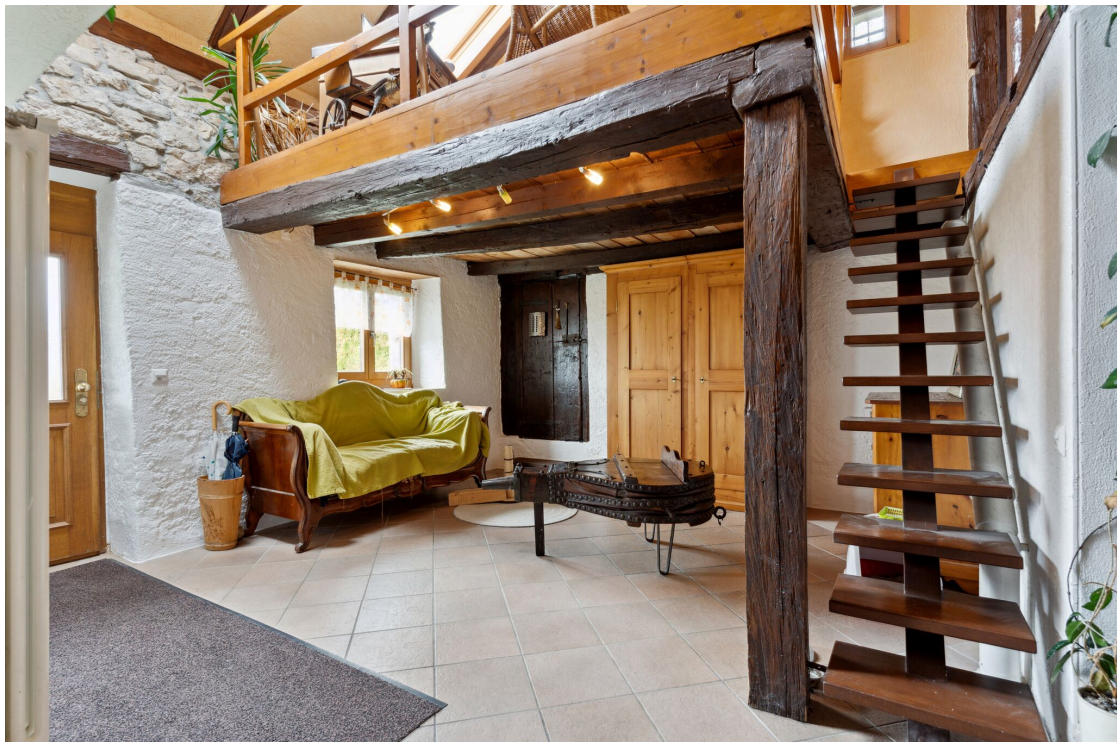
Coin lecture et mezzanine