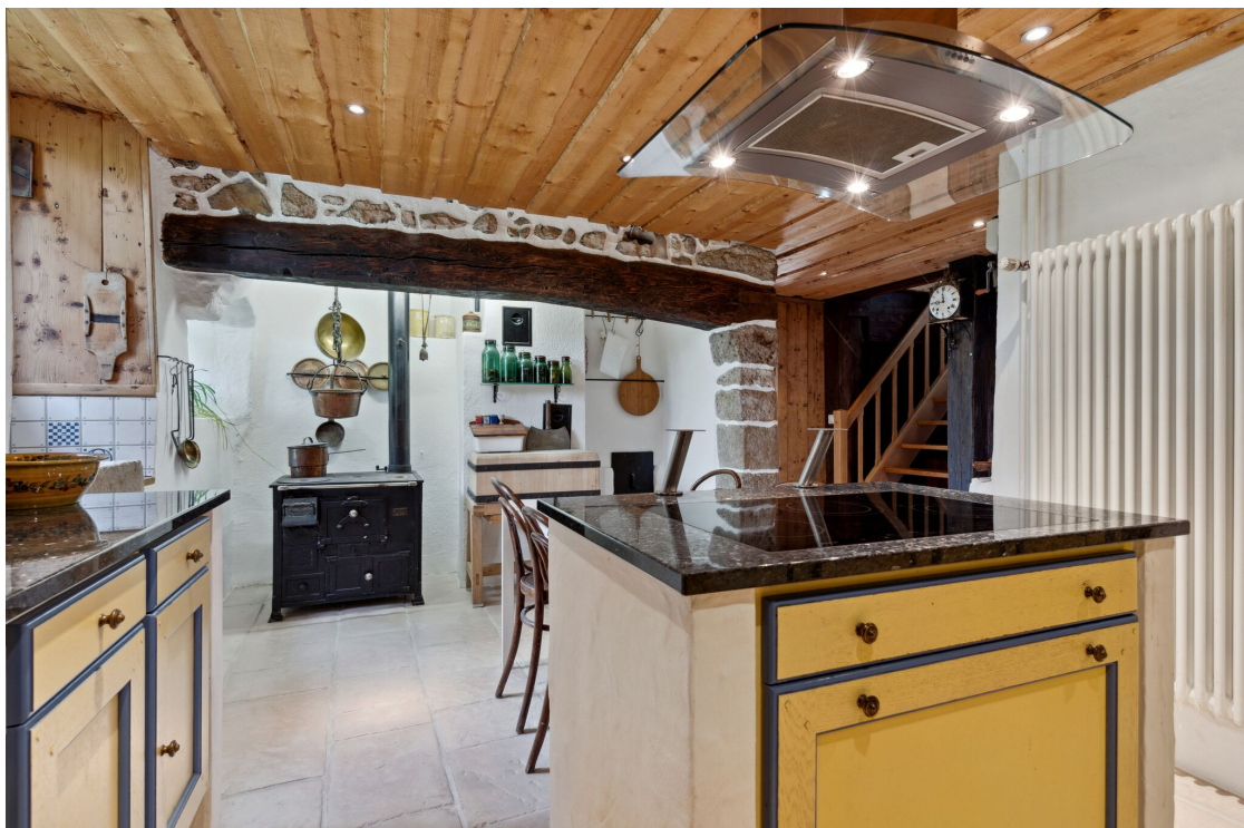
Cuisine habitable avec ilot