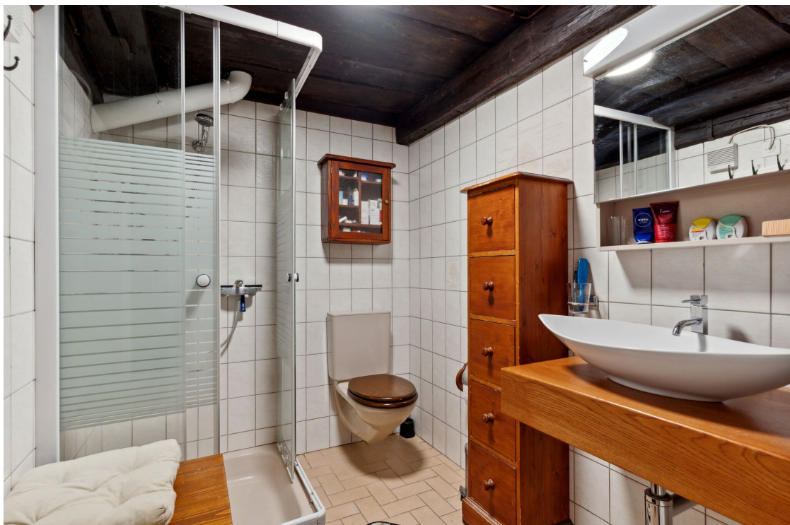
Salle de douche