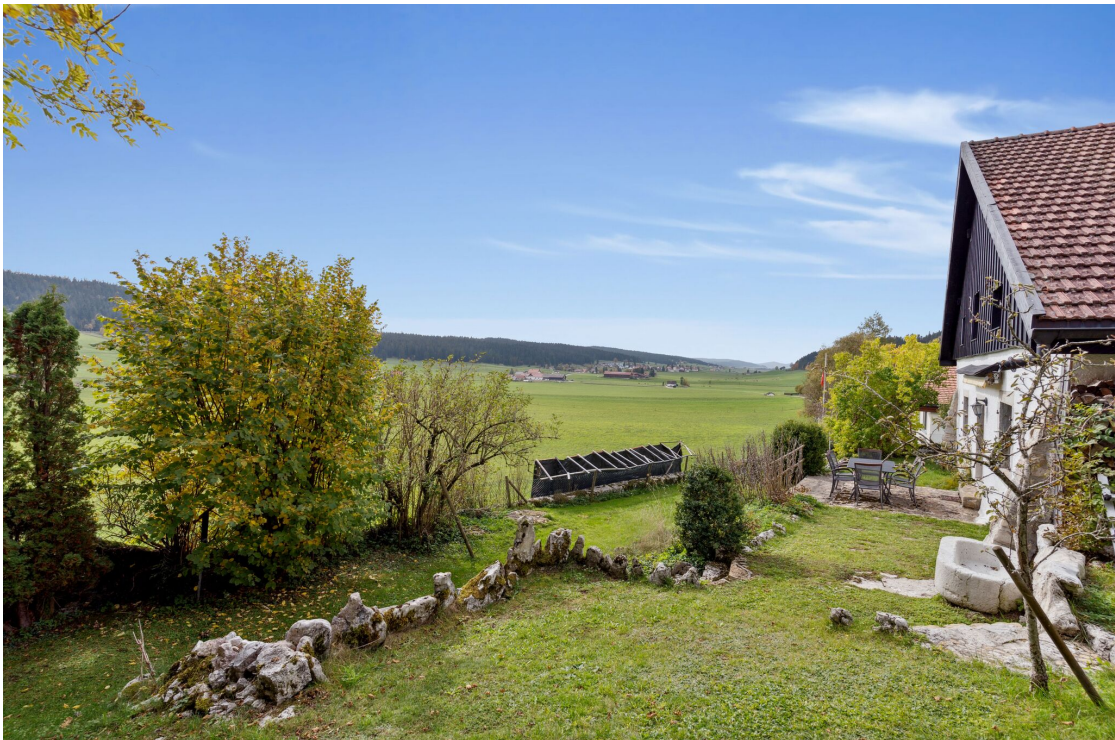
Vue dégagée sur la campagne environnante