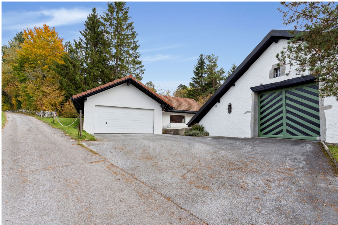
Garage double et atelier