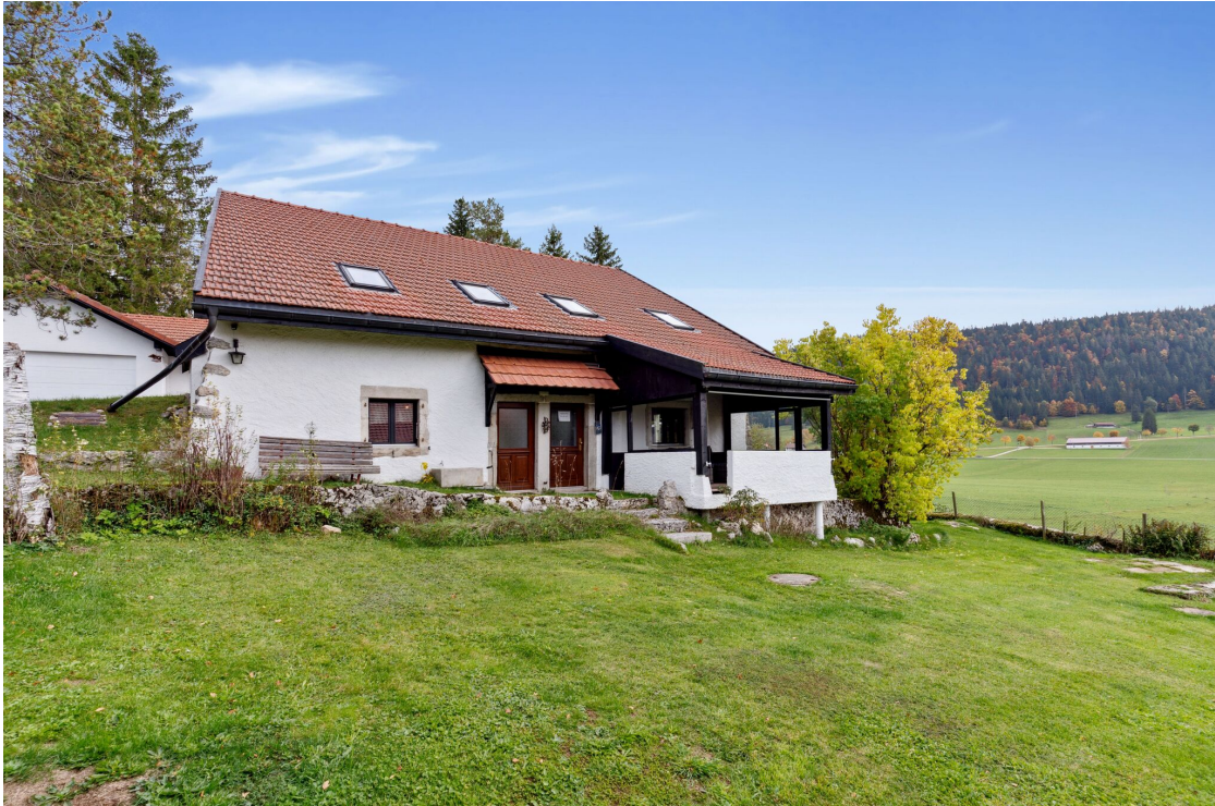
Grand jardin arboré