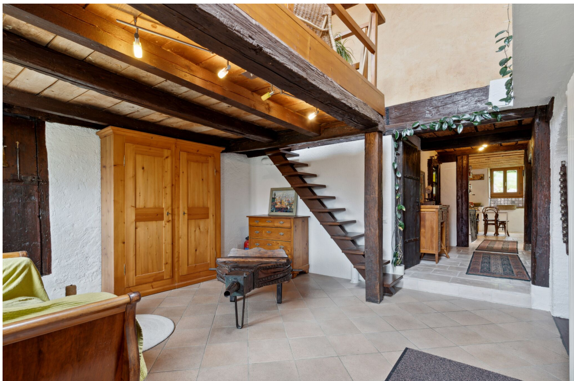
Coin lecture et mezzanine