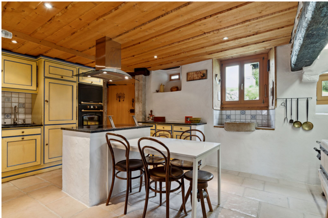
Cuisine habitable avec ilot