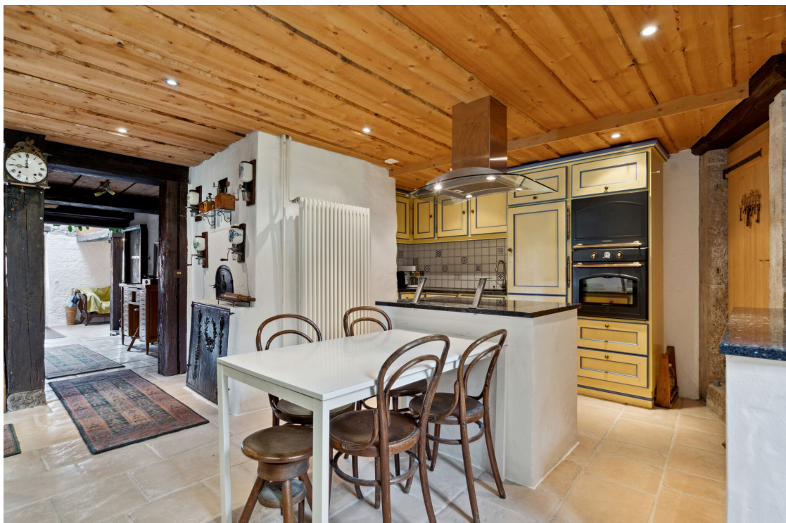
Cuisine habitable avec ilot