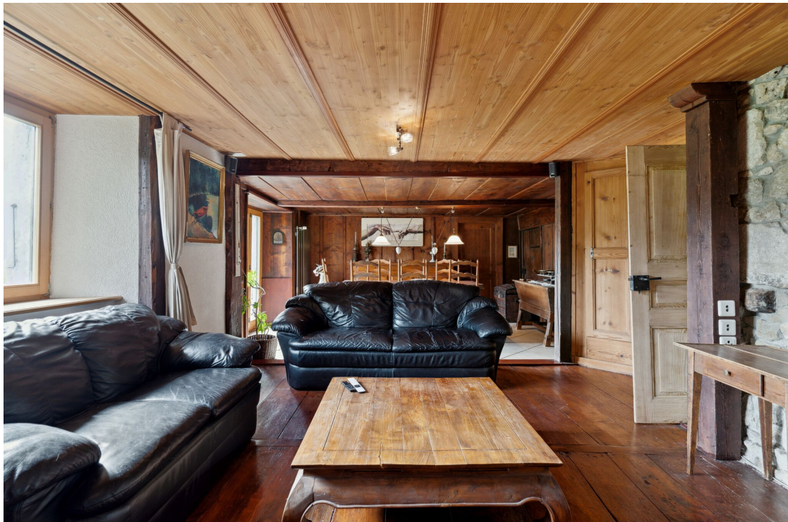
Séjour avec cheminée