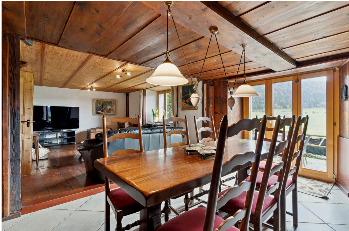
Salle à manger avec fourneau