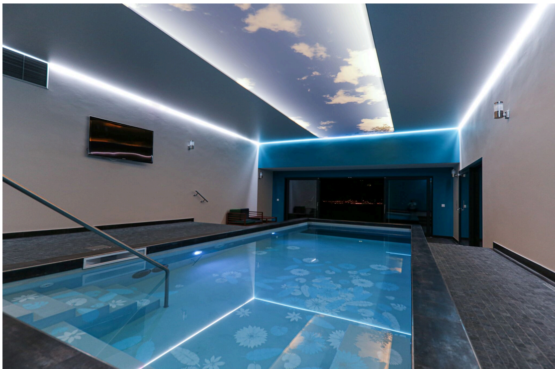
Piscine de nuit