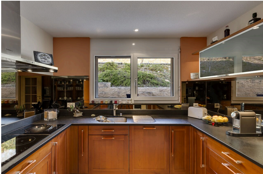
Cuisine entièrement équipée