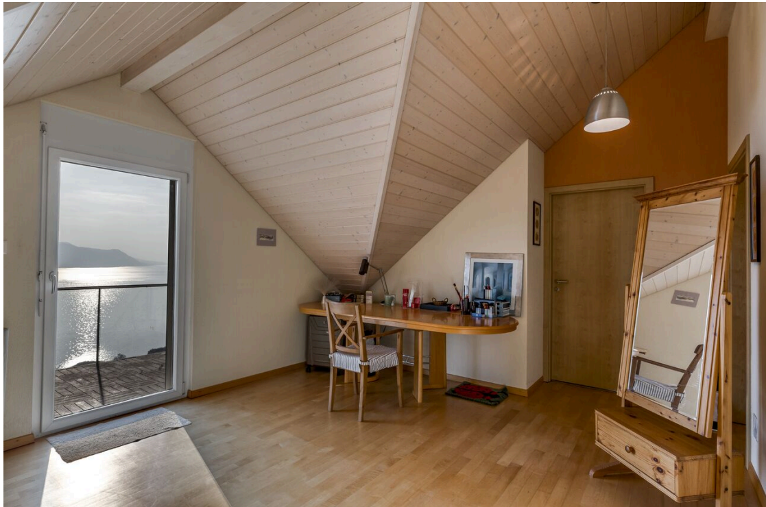
Chambre à coucher mansardée