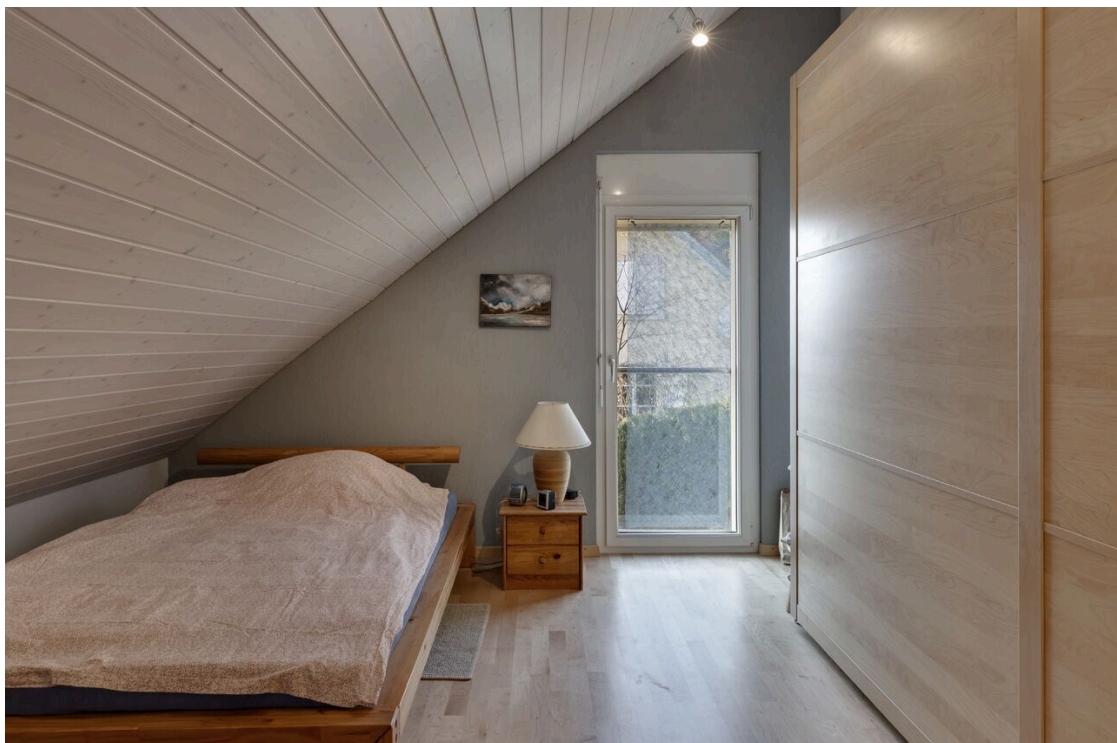
Chambre à coucher mansardée