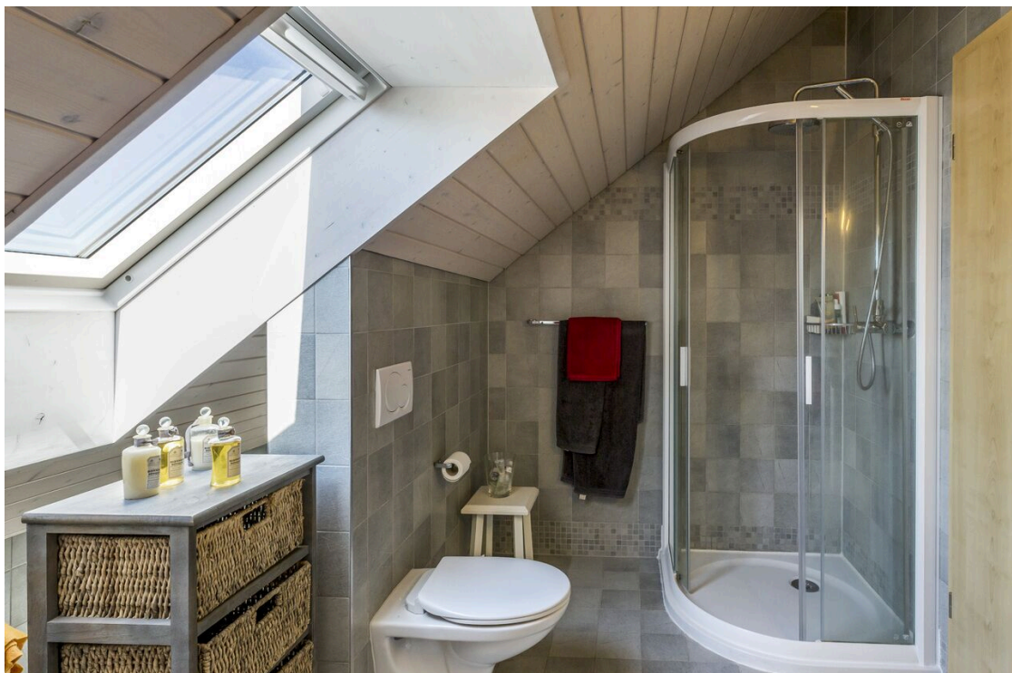
Salle de douche