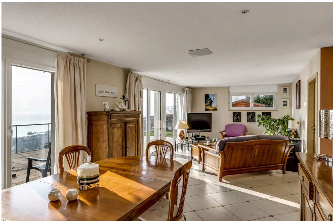
Belle pièce à vivre