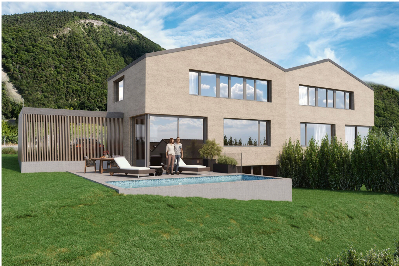
Villa d'architecte (A1) Le Clos d'Arbosson