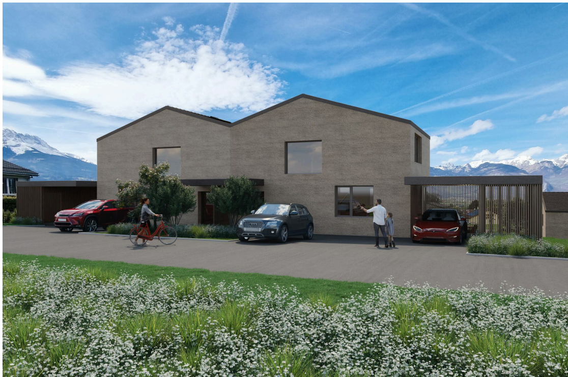
Villa type A - extérieur