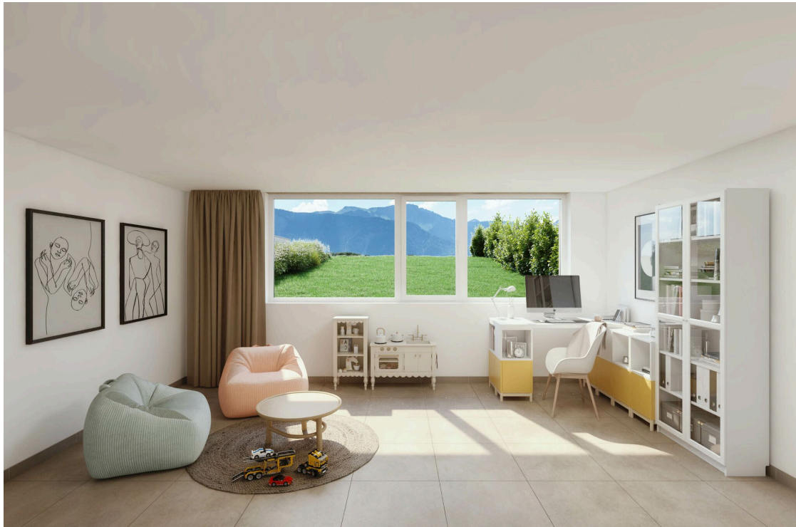
Villa type A - rez inférieur