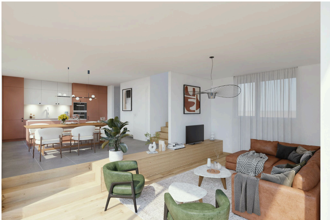
Villa type A - Pièce de vie