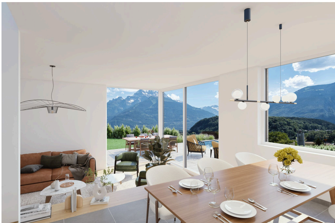
Villa type A - Pièce de vie