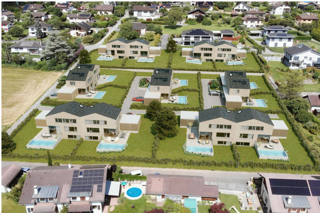
Vue du projet