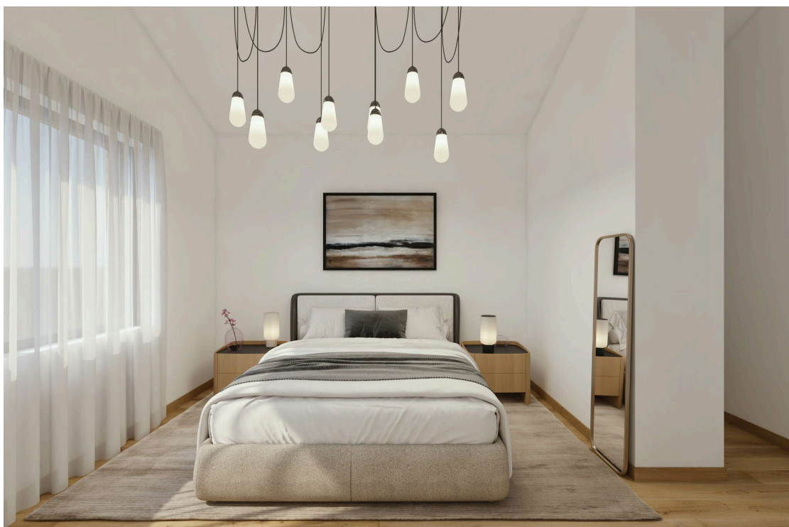
Villa type A - Chambre à coucher