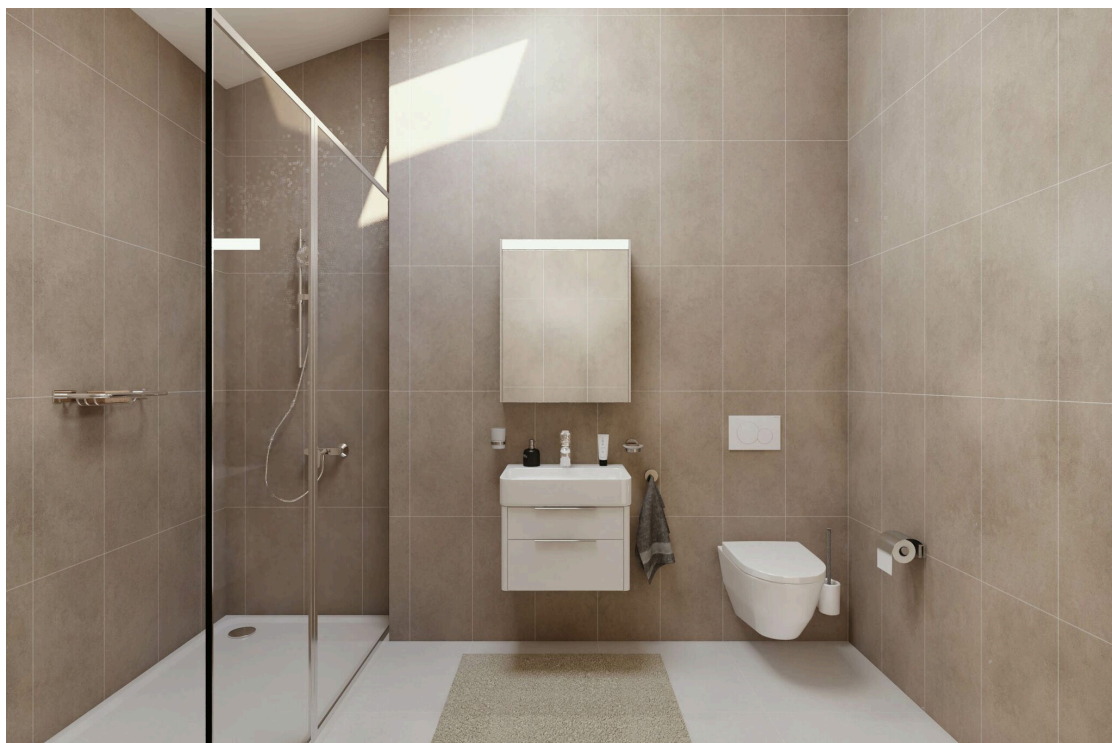
Villa type A - Salle de douche