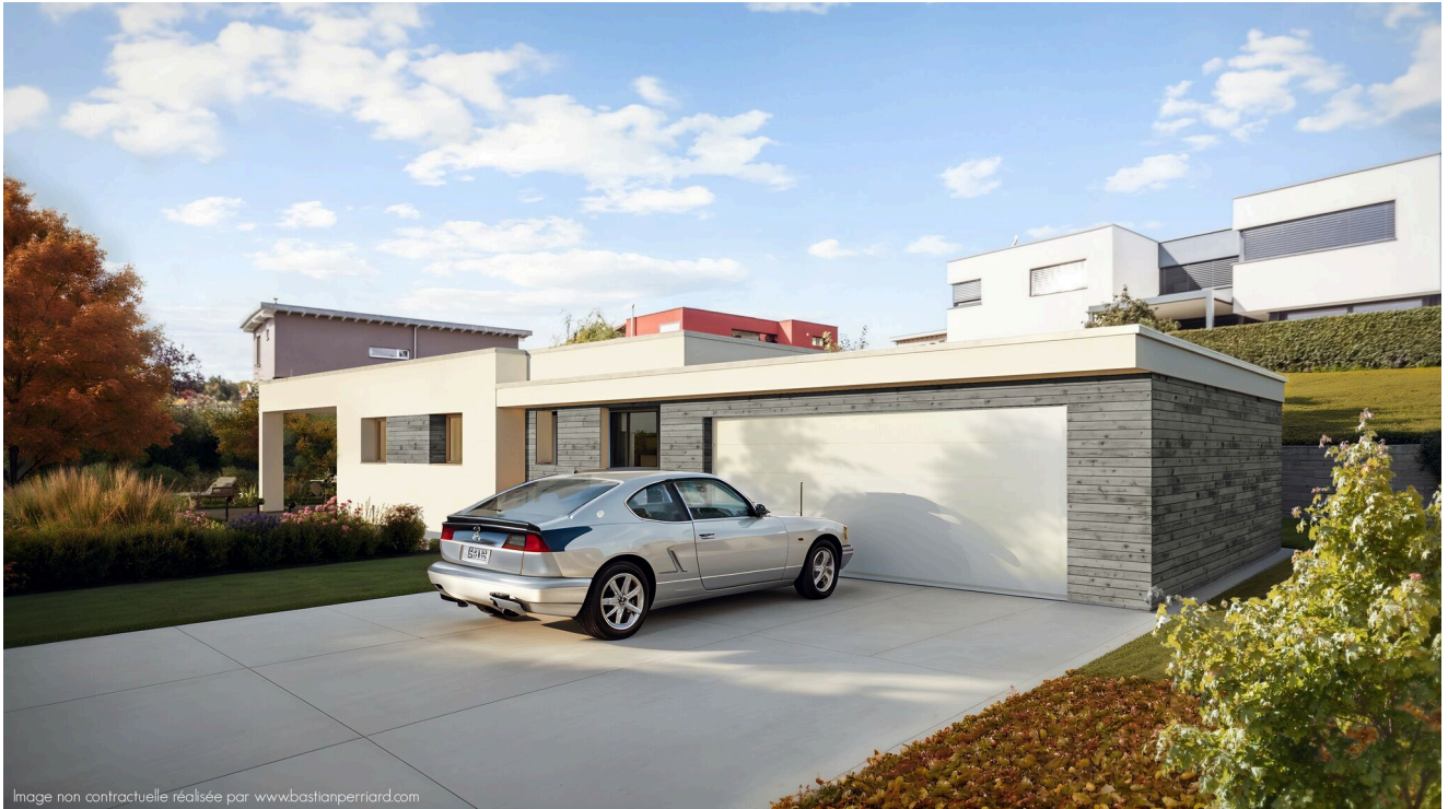
Image non contractuelle