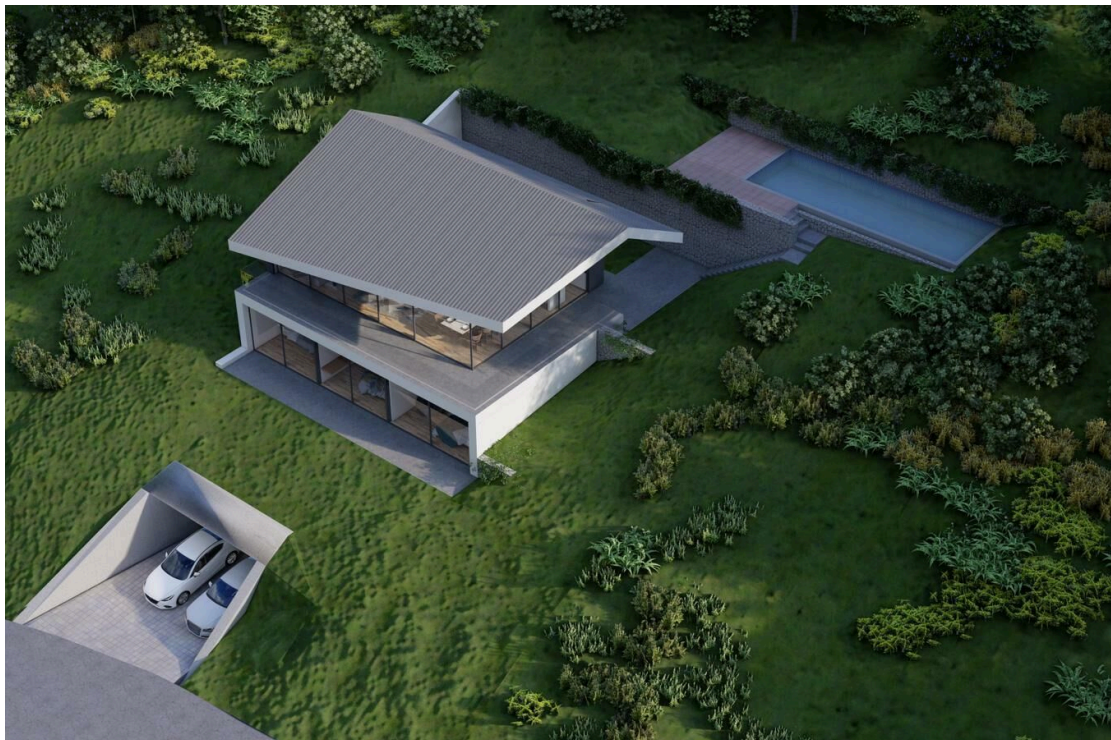
Image de synthèse