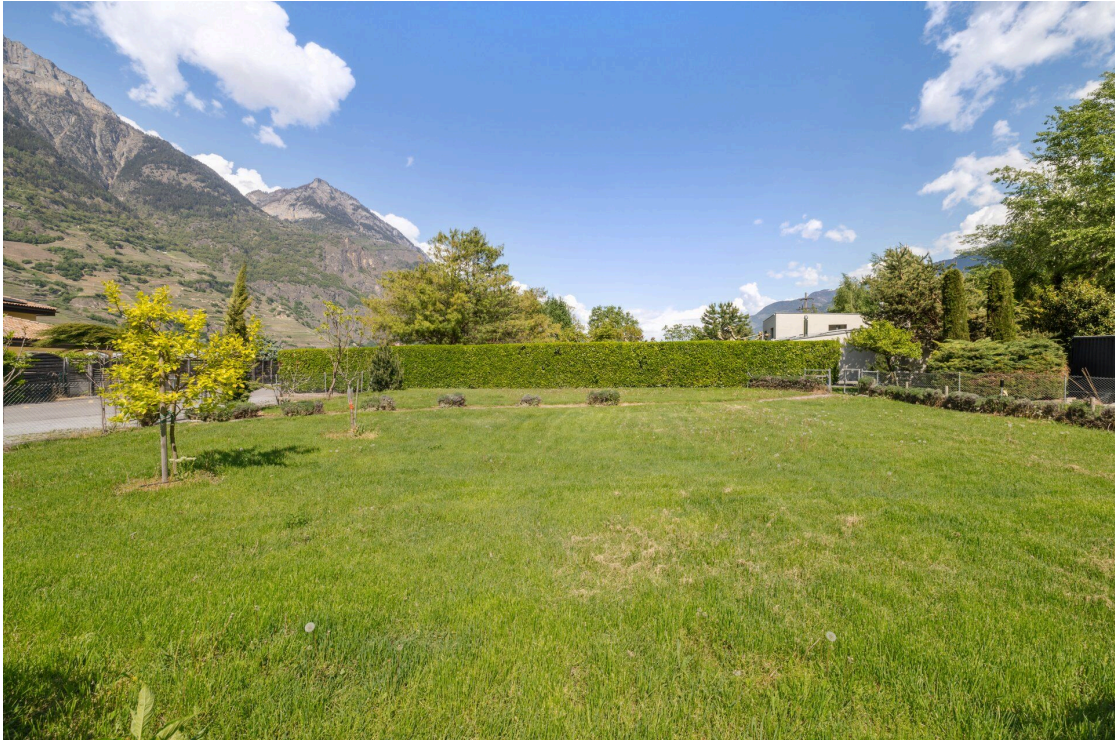
Parcelle de 1002m2 en SUS